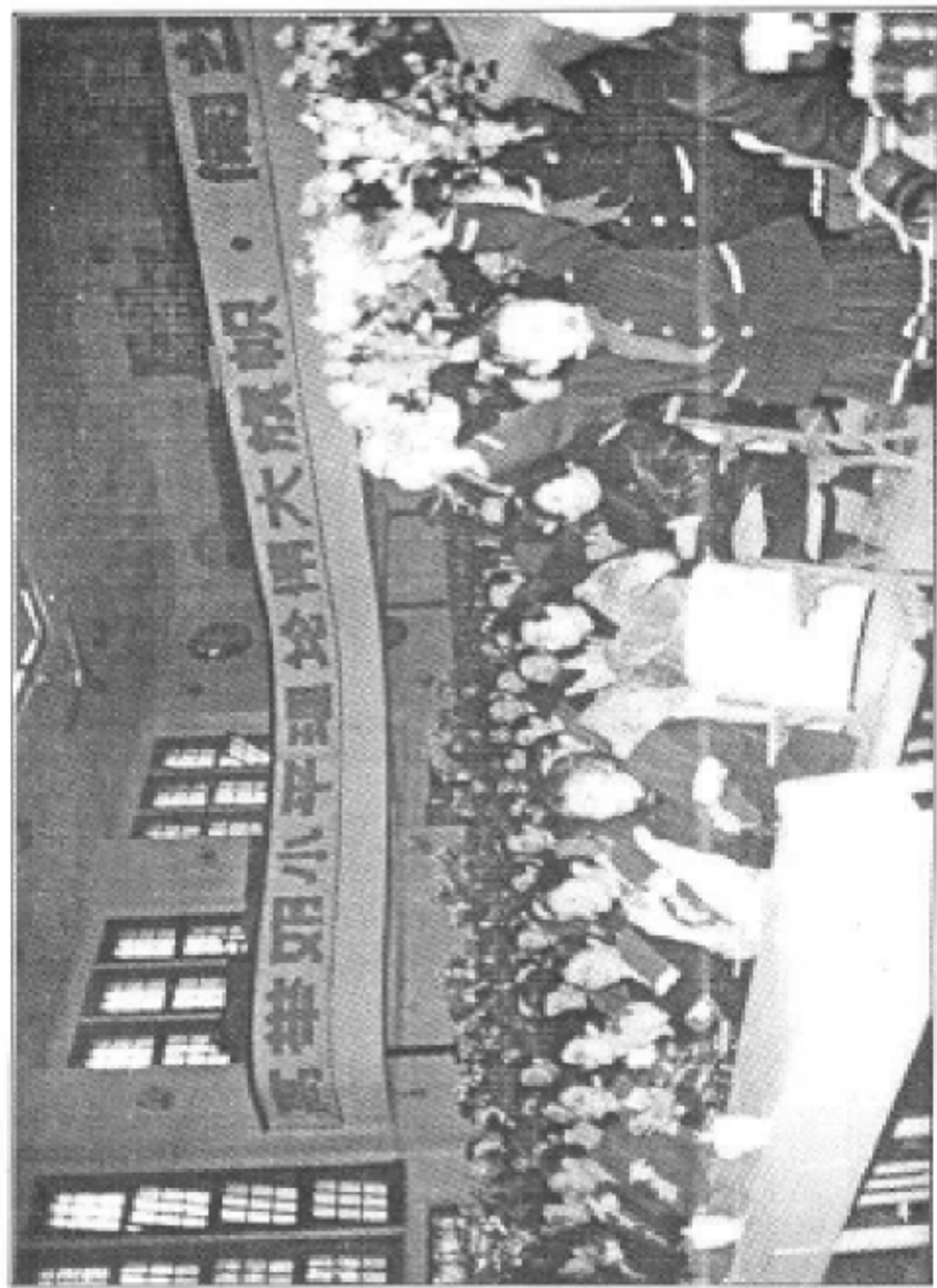
区第五届最佳教师授奖大会会场一隅