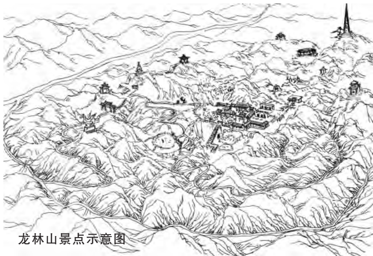
龙林山景点示意图

龙林山在吕梁山的东麓，是古晋阳的三圣境之一。它位于清徐县城西北的白石沟中段，碾底村以北，走向由北向南，海拔1387米，东临石窖沟，与天龙山相望；北界东梁岩沟和羊夫岩沟，遥望庙前山；西南以白石沟为界，与马鸣山遥遥相对，是庙前山的支脉。四周的村庄有石窖、涧沟、碾底、圪台头等。在龙林山的山坳里，弯腰沟(也叫碗岩沟)的沟背上，有千年古刹梵宇寺，