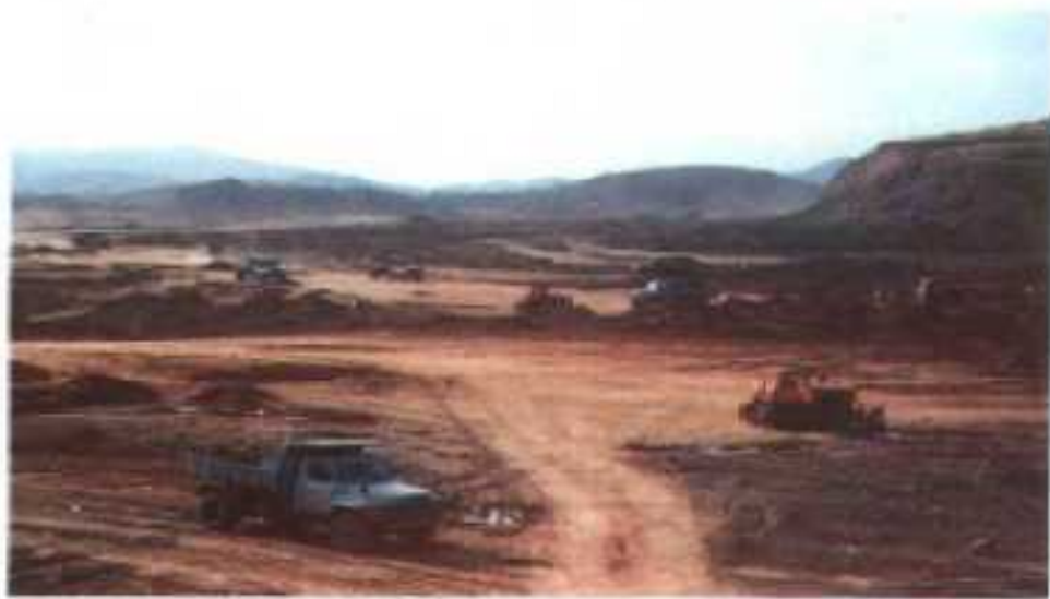
△正在开发中的龙川经济开发区。