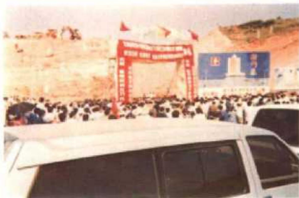
△龙川县经济开发区50米主干道、中银大厦、循州苑奠基盛况。