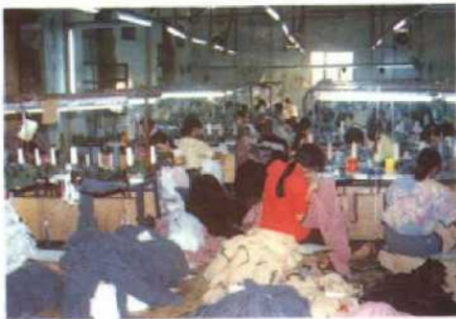
△创源服装有限公司生产车间一角。