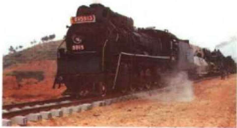
△1993年11月29日22时，京九铁路广梅汕段龙川站首次货车营运。