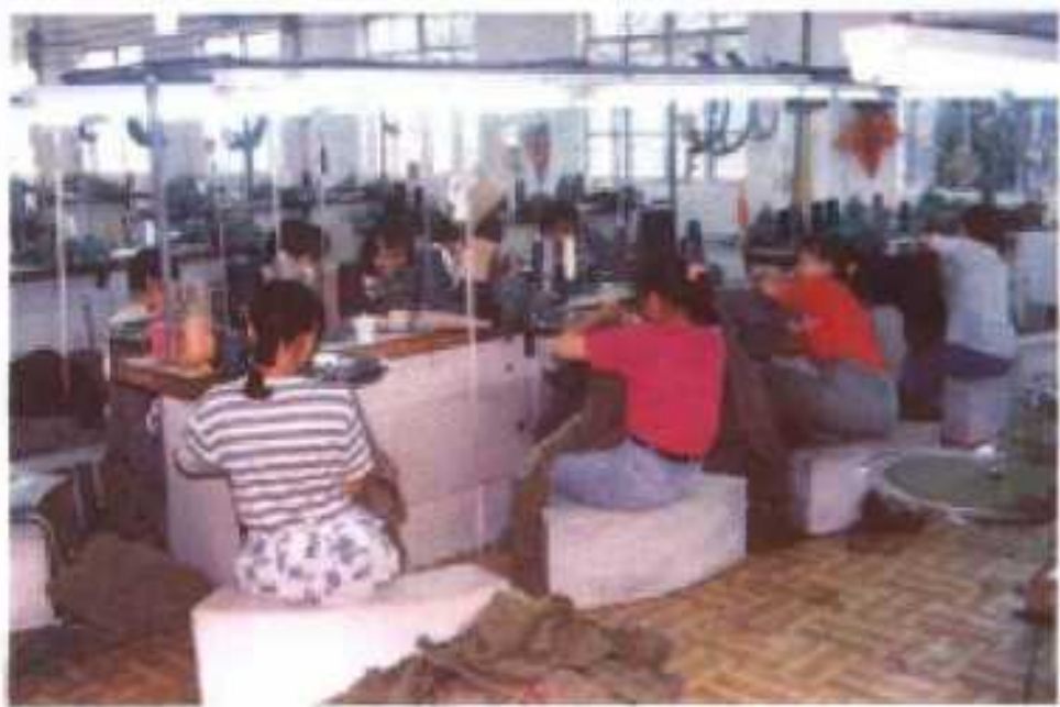
△全鹤针织有限公司制衣车间。