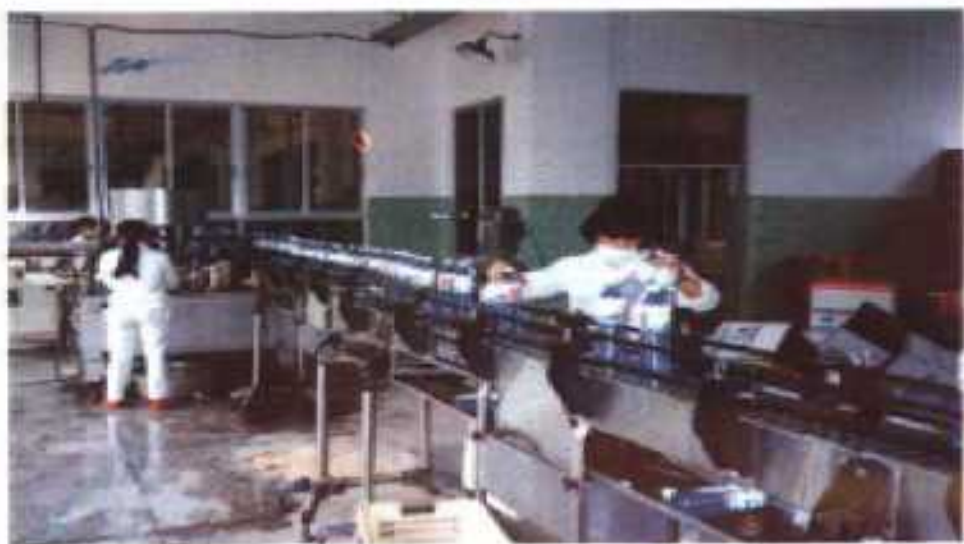
△中外合资龙川实业有限公司矿泉水车间一角。