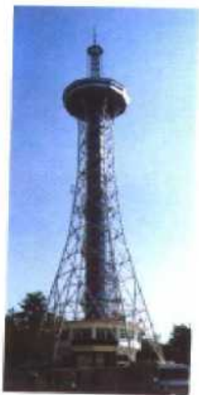
龙川县广播电视塔