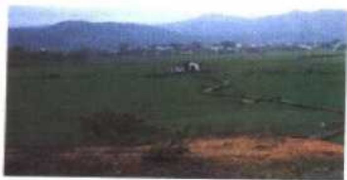
△今日紫湖（中图为风雨亭）