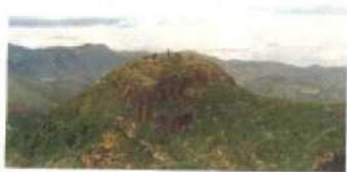
△龙川八景之一——龙台山