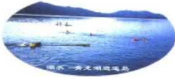
湖光——美之明珠瑶岛