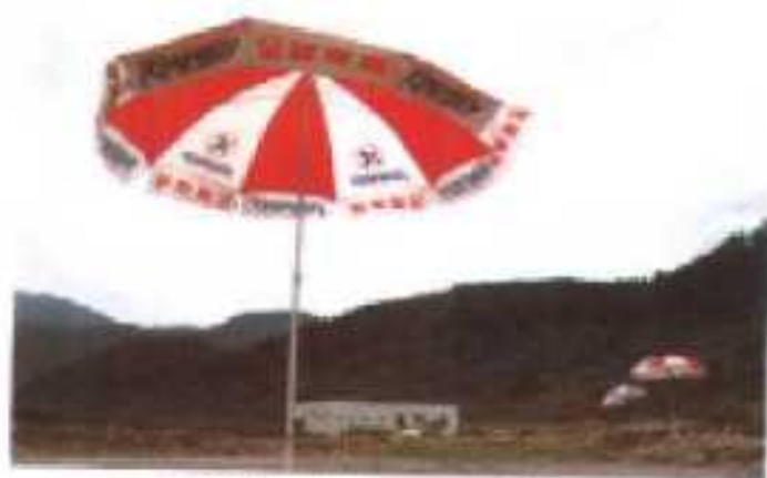
△龙川八景之一——合溪温泉