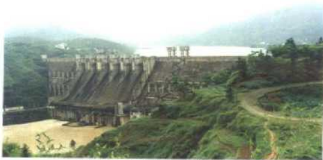
△岭南第二大水电站——枫树坝电站