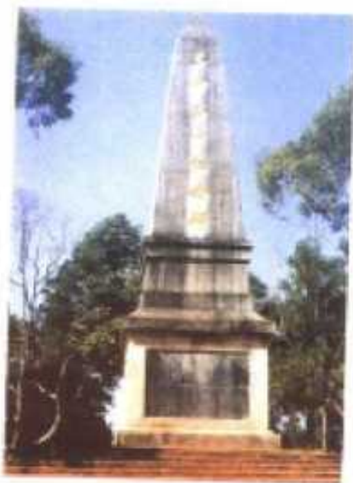
龙川县革命烈士纪念碑