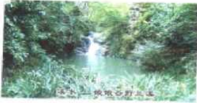
溪上——绿带石野五溪