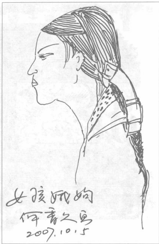
女孩娥姁 (何香久画)

还有一个故事说:吕公之妻十月怀胎,即将临盆,一天半夜,梦中听见小兀山上似有凤鸣之声,就从梦里惊醒了。无独有偶,吕公也做了一个同样的梦。他披衣下床,没出院子,就恍恍惚惚看见一只大鸟,金喙长尾,锦项华羽,从外飞