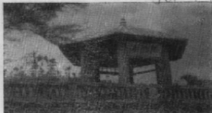
1、矗立于酒峡 坳战役阵亡将士墓 侧的武场亭。