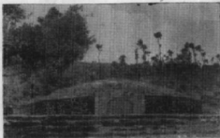
2、抗日战争中 酒峡坳战役阵亡将 士墓。