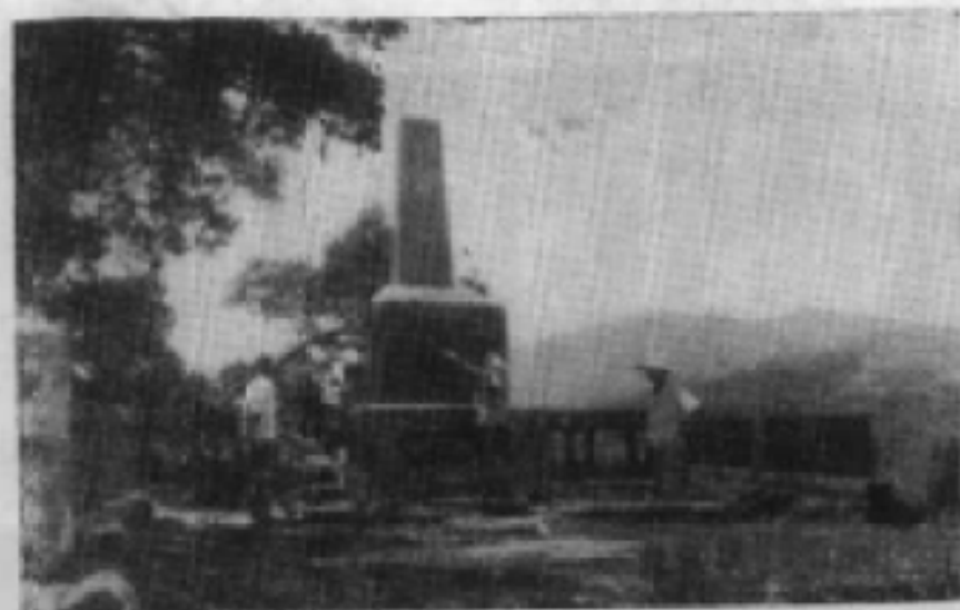
3、抗日战争中 酒峡坳战役阵亡将 士纪念碑。