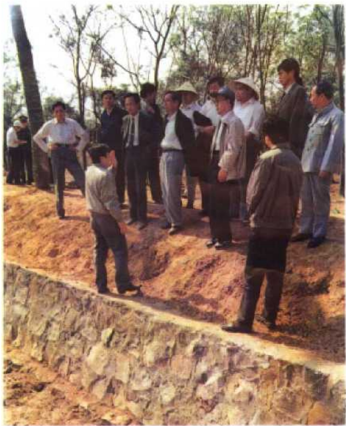
图为：1990年2月16日，国务委员陈俊生（右五）、农业部副部长刘江（左四）在副省长陈苏厚（左六）和县委副书记林亚华（左二）的陪同下视察临高县农业综合开发重点项目工程——调俗洋水利渠道。