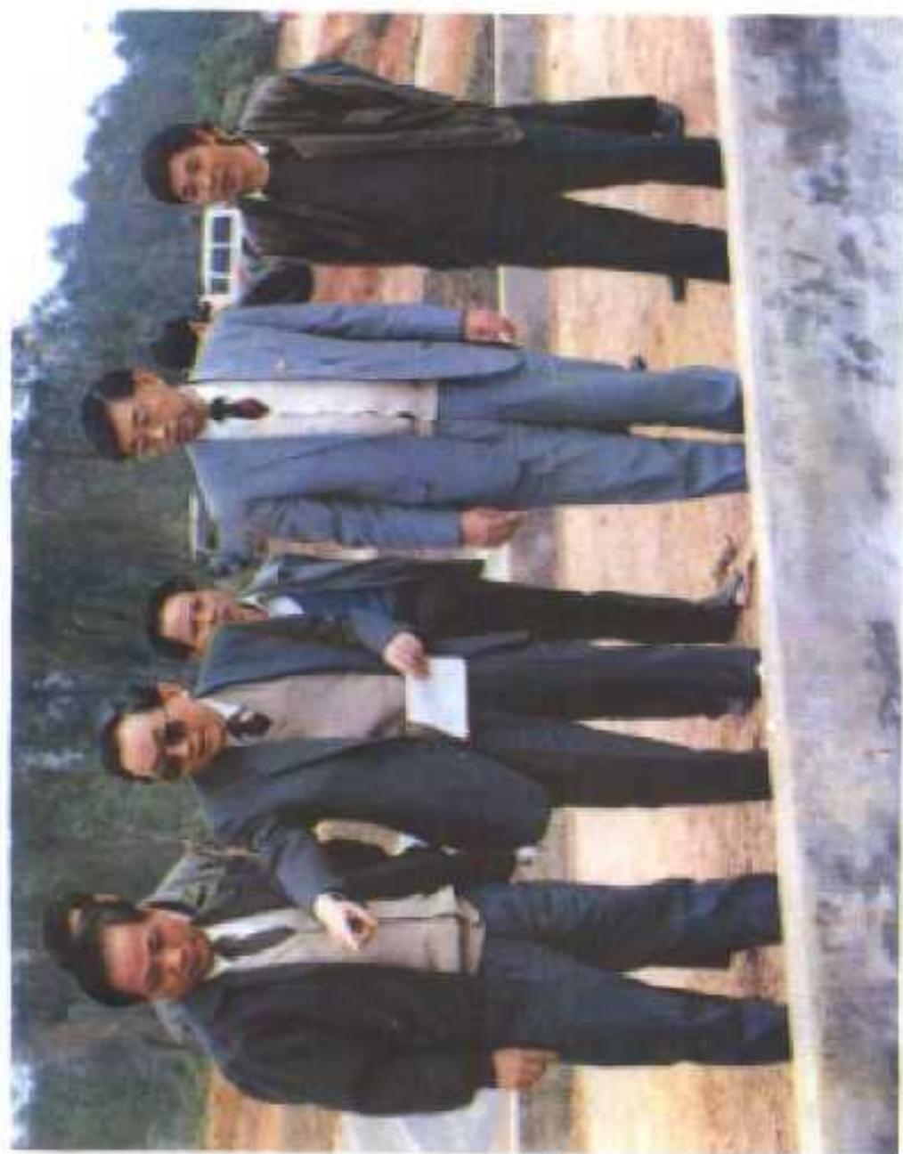
图为：1992年1月13日，国务院副总理田纪云（左二）在省长刘 剑锋（右二）、副省长陈苏厚（左一）、县委书记胥孟彪（右一） 的陪同下视察南宝乡水利设施。