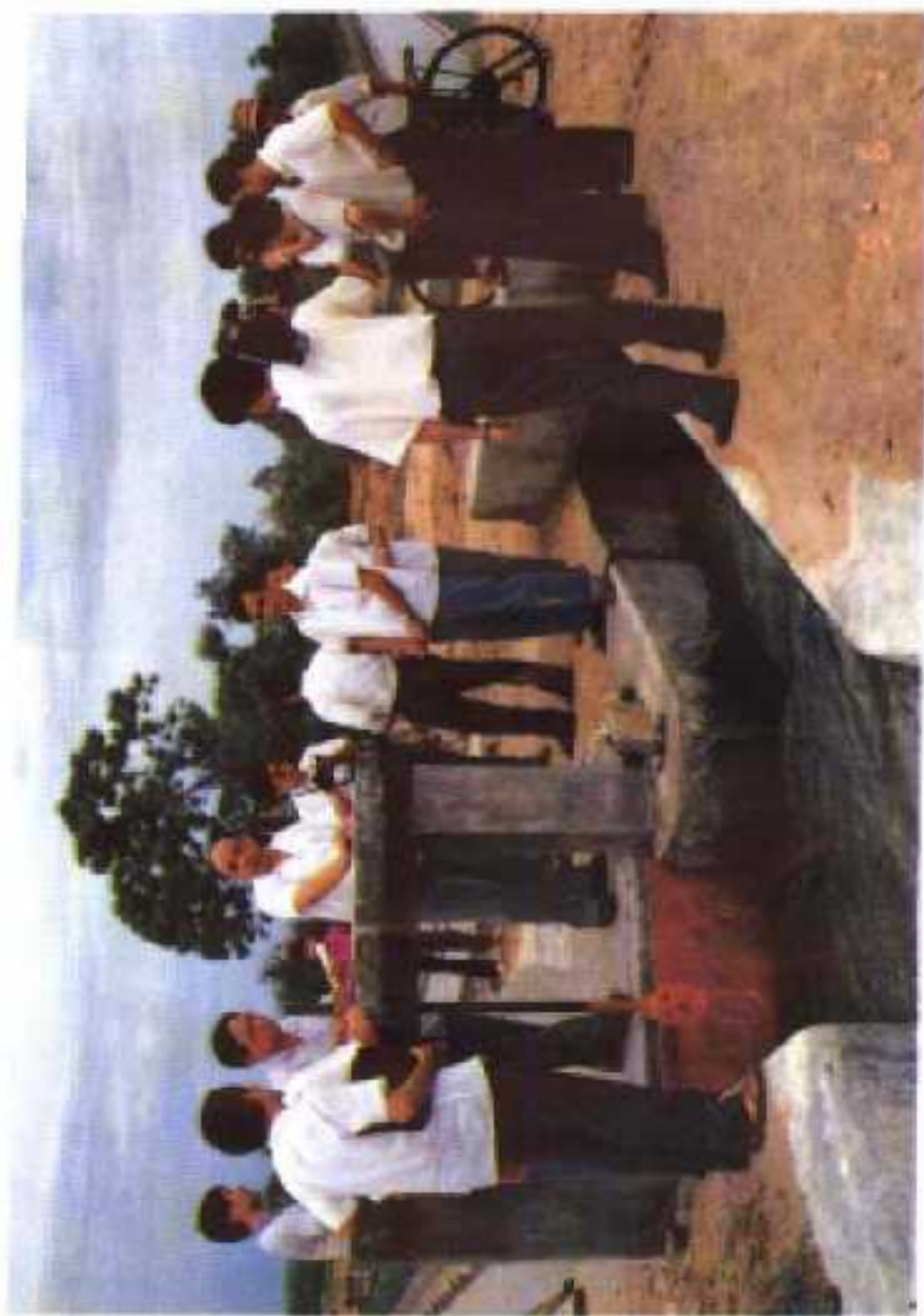
图为：1991年5月7日，省委书记邓鸿勋（左四）、副省长陈苏厚（左三）在县委书记井孟超（左二）的陪同下视察省农业综合开发9024重点工程南宝四支渠。