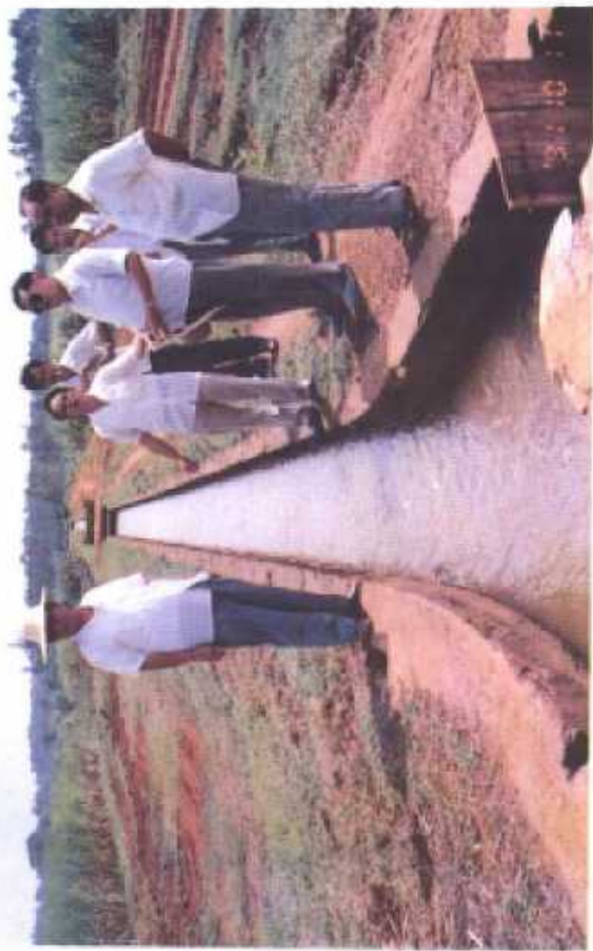
图为：1991年10月11日，省政府副主席姚文斌（右三）、副省长陈苏厚（左一）、 省水利局长黄强（右一）在县长蔡堂生（右二）、副县长曾庆钊（左二） 的陪同下，检查2719工程——头围坎水利渠道。