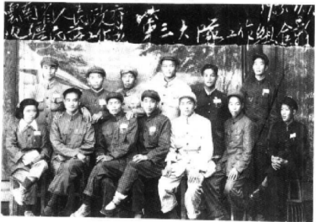
云南省民族工作队第三队工作组