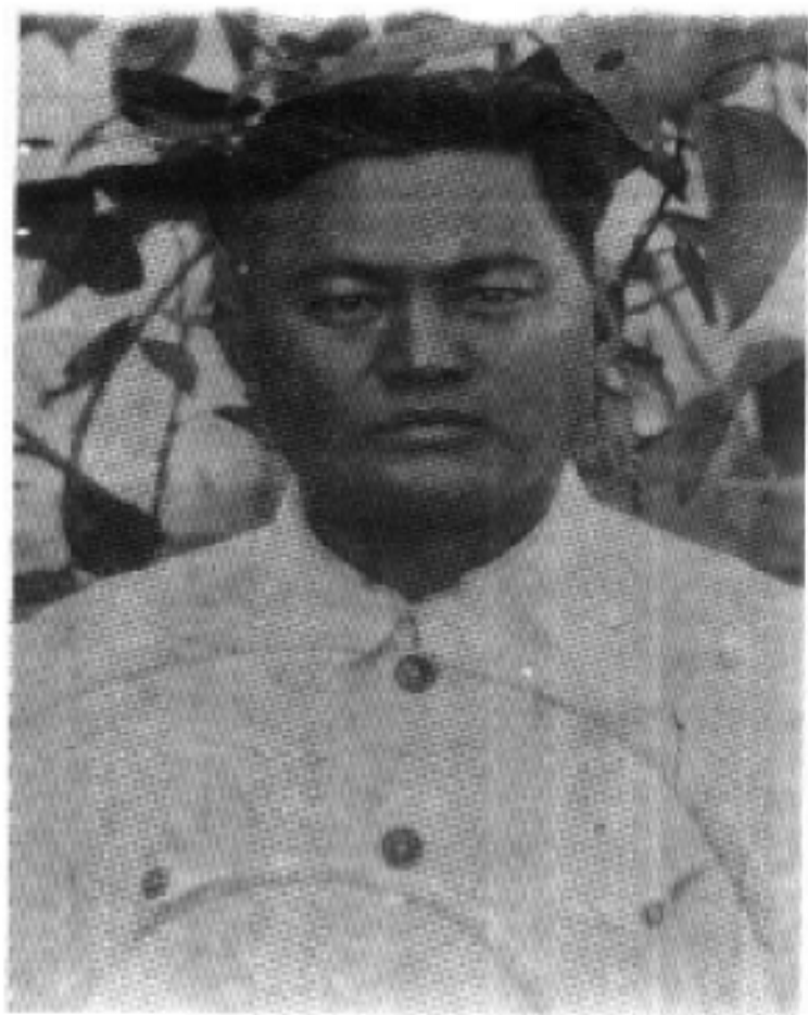
省政协第三届委员会副主席胡志华