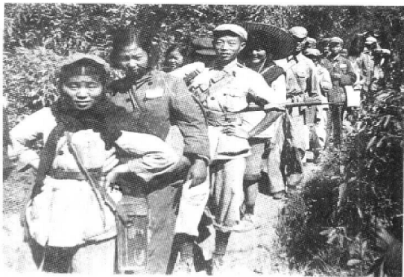
行军途中的民族工作队员