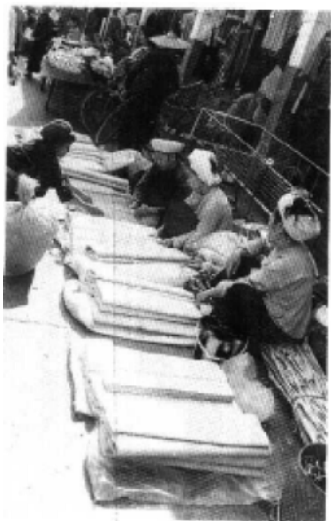
孟定集市上构皮纸交易一角