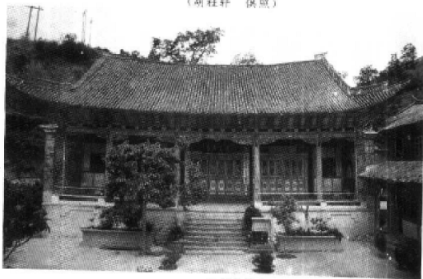
云县清真寺