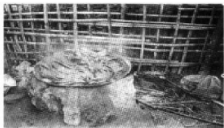
原始造纸中的拌灰煮构皮