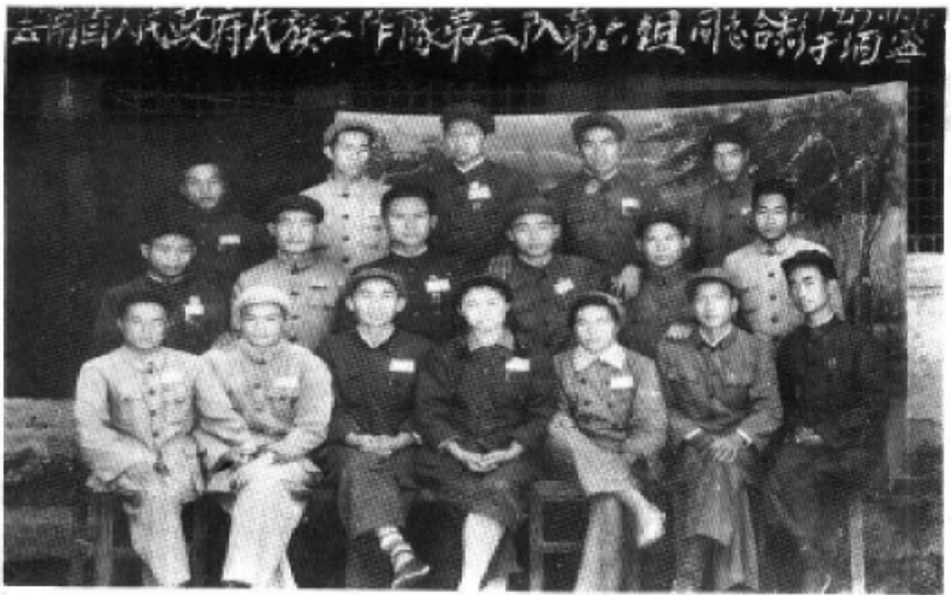
云南省民族工作队第三队第六组