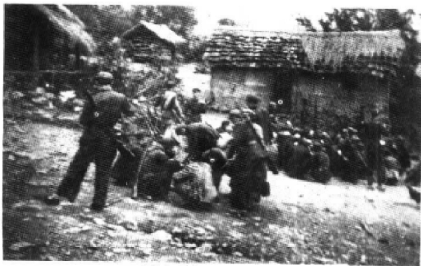
就餐中的大雷山区民族工作队员