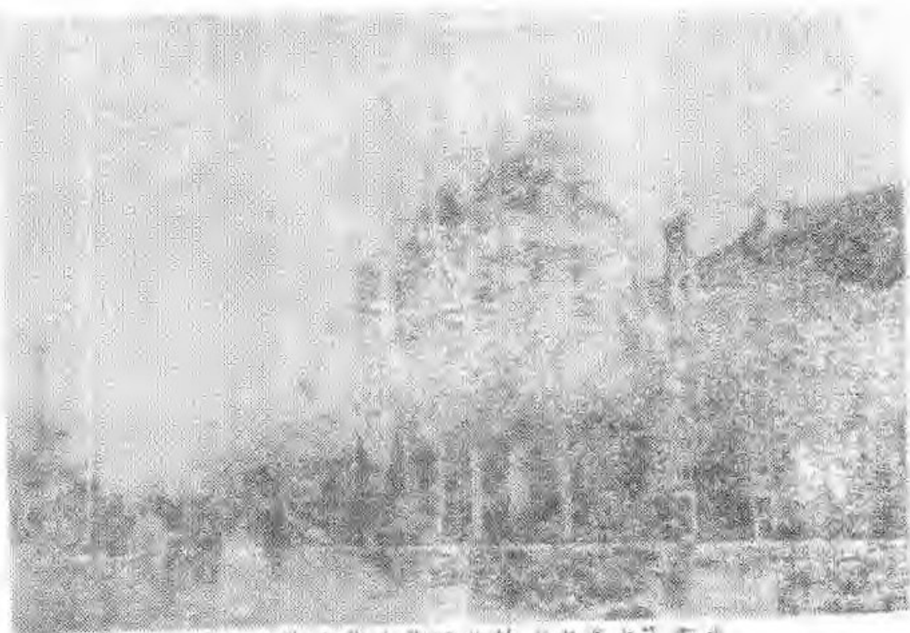
▲位于小什字街东街路北的“宏益东”布庄