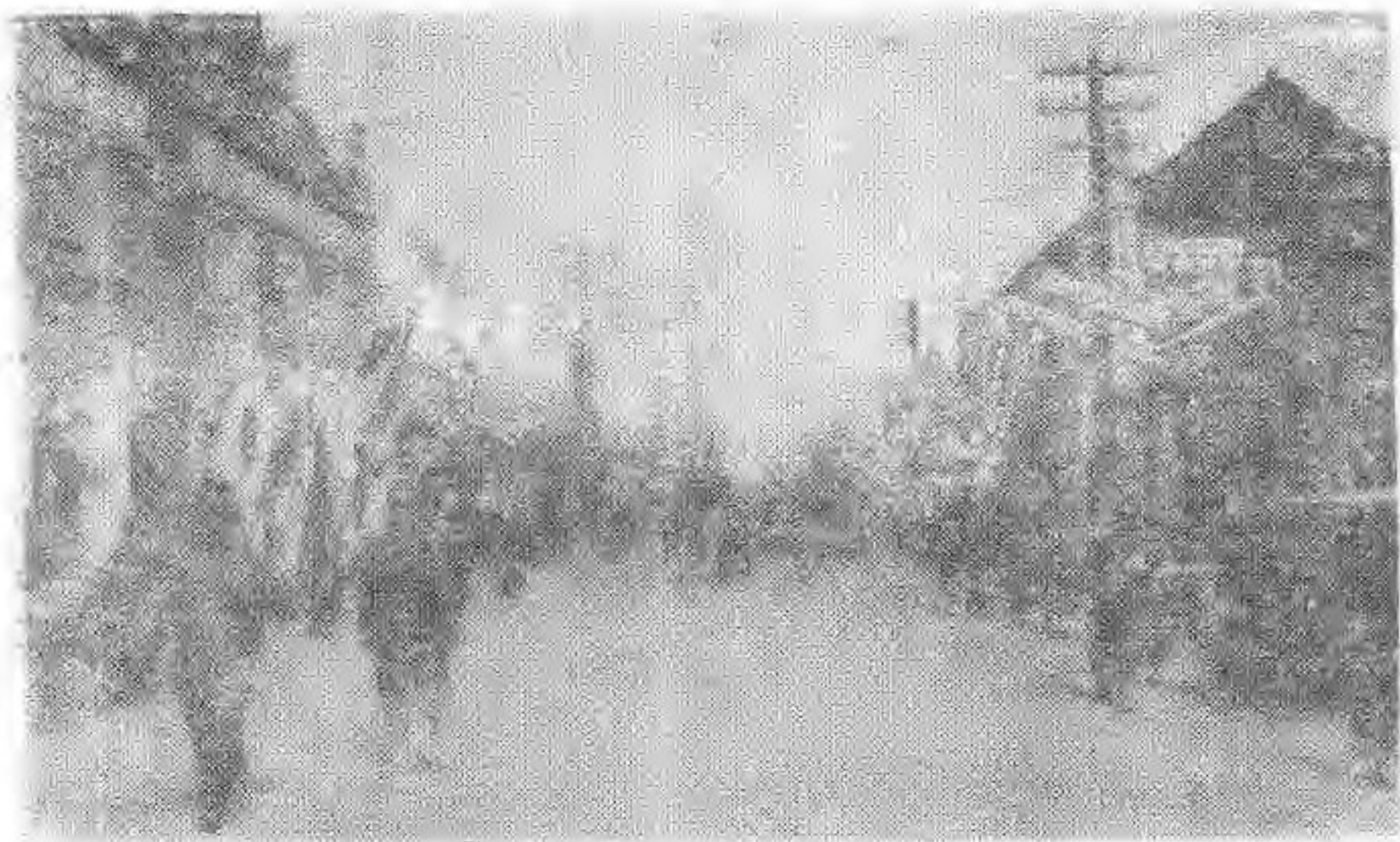
▲位于小什字街南街“福合长”商店南柜和“成巨兴”丝綢店（由南向北摄）