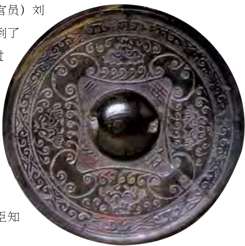
• 三国“位至三公”铜镜 •

“三顾茅庐”被后人渲染成一个传奇故事，可能是因为诸葛亮成功的出仕经历和卓越的名声，使其成为了后代文人眼中理想的形象。“学而优则仕”，文人们都渴望有明君的知遇，而高姿态的出仕又是一种无比的荣耀。所以，“三顾茅庐”实为千古文人心中一个梦想。