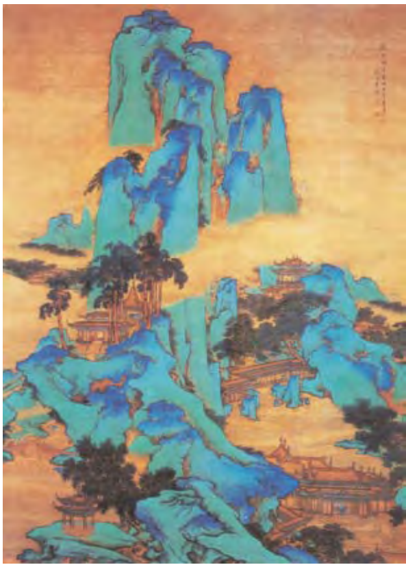
· 清代画家所绘的《阿房宫图》·

秦始皇为什么将这座奢华的宫殿命名为“阿房”呢？自古以来众说纷纭，概括起来有以下几种说法：一种说法源于《史记》的记载，称宫殿的形状“四阿旁广”，“阿”解释为“曲”的意思，阿房宫据此得名；另一种说法载于《汉书·贾山传》，称由于宫殿建在大陵上，“阿”就是“大陵”的意思，“高若干，阿上为房”；还有一种说法源自民间传说，相传嬴政（即后来的秦始皇）在赵国做人质时，深爱过一个美丽的民间女子阿房。嬴政返回秦国即位后，朝政大权掌握在相国吕不韦手中，仍无法立一个民间女子为后。为了怀念阿房，他便不惜耗费巨大的财力、物力、人力，修建了极尽豪奢之能事的阿房宫。