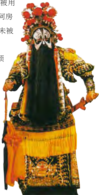
· 戏剧中西楚霸王项羽的形象 ·

最后，项羽的刚愎自用、意气用事是他被误解的情感基础。在率军征战的过程中，项羽屠城、活埋、烧杀的事例屡见不鲜，进入咸阳后仍延续这一行事风格。火烧阿房宫恰恰符合项羽的性格特征，无怪乎人们冤枉了项羽两千多年。