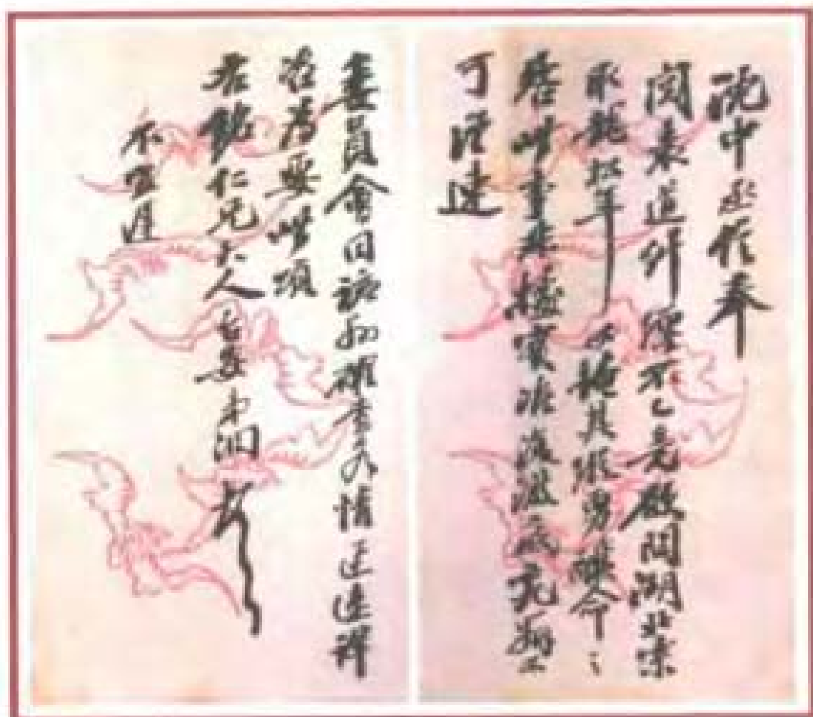
張之洞致陳寶箴手札