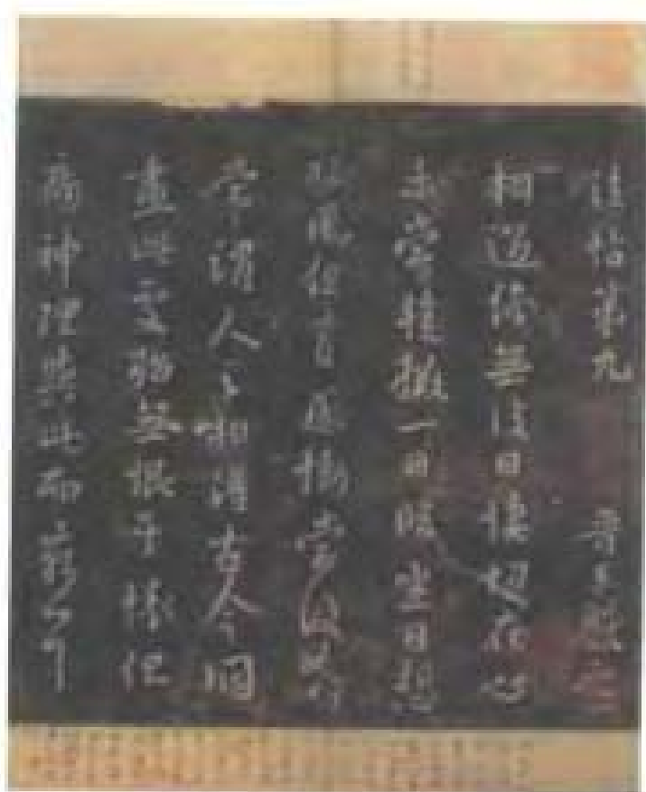
宋拓本《淳化閣帖卷九》卷首及卷尾