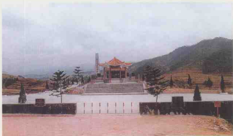
第一枪纪念亭公园