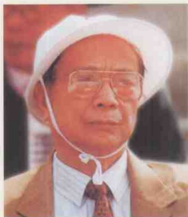
2008年1月7日欧初同志应邀出席“三罗”武装斗争富林战斗第一枪60周年大会 (原粤中纵队副司令员兼参谋长)