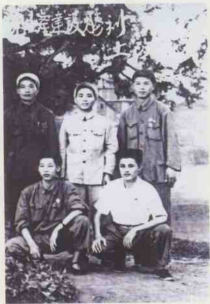
区祥任副区长， 胜利完成土改