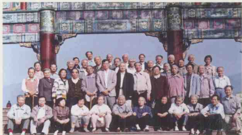
原粤中四支队肇庆联谊合影