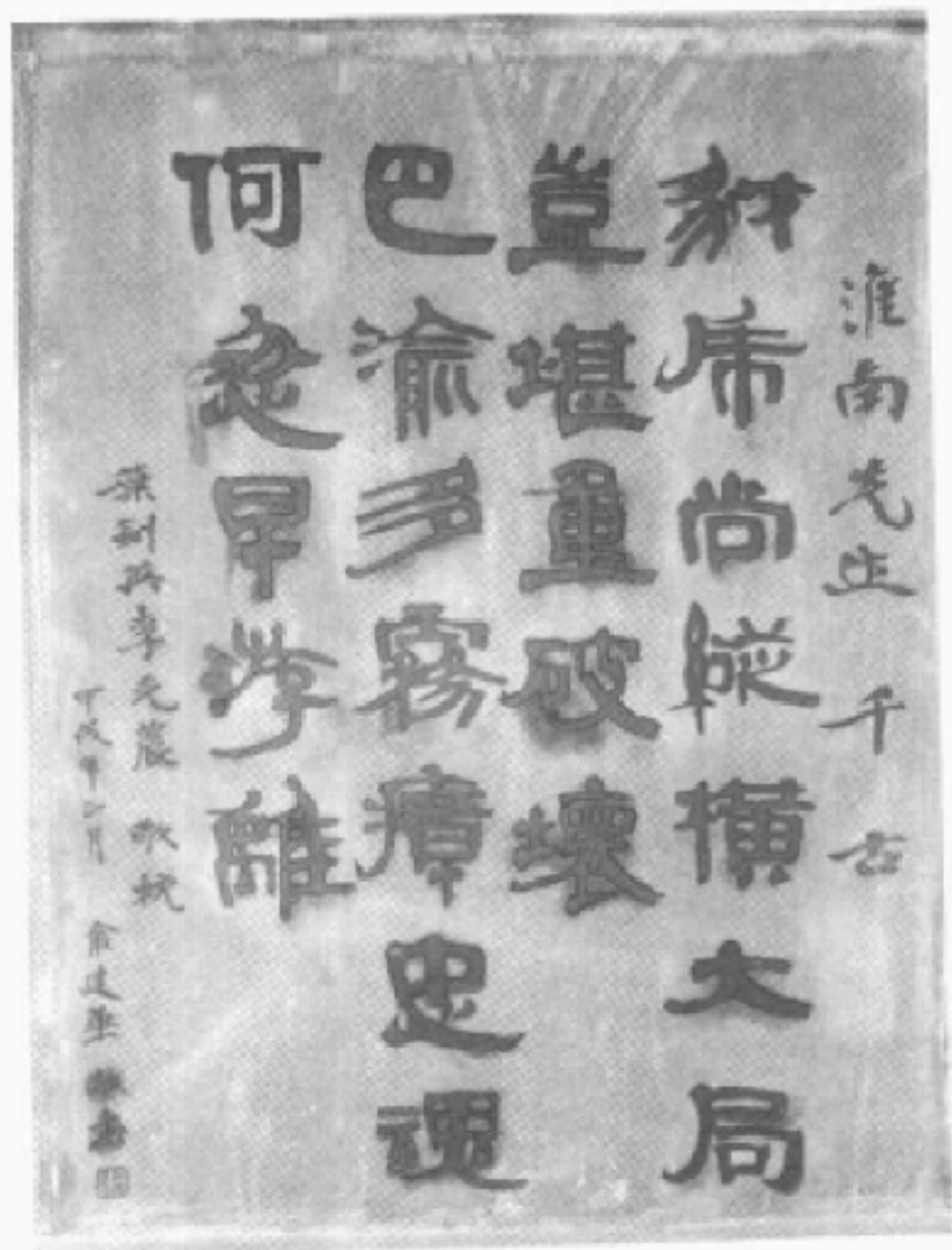
葉劍英、李克農同志輓聯刻碑照