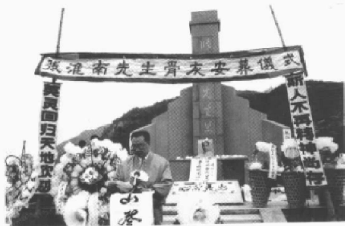
浙江省政協副主席陳法文在張淮南先生骨灰移葬儀式上的講話照