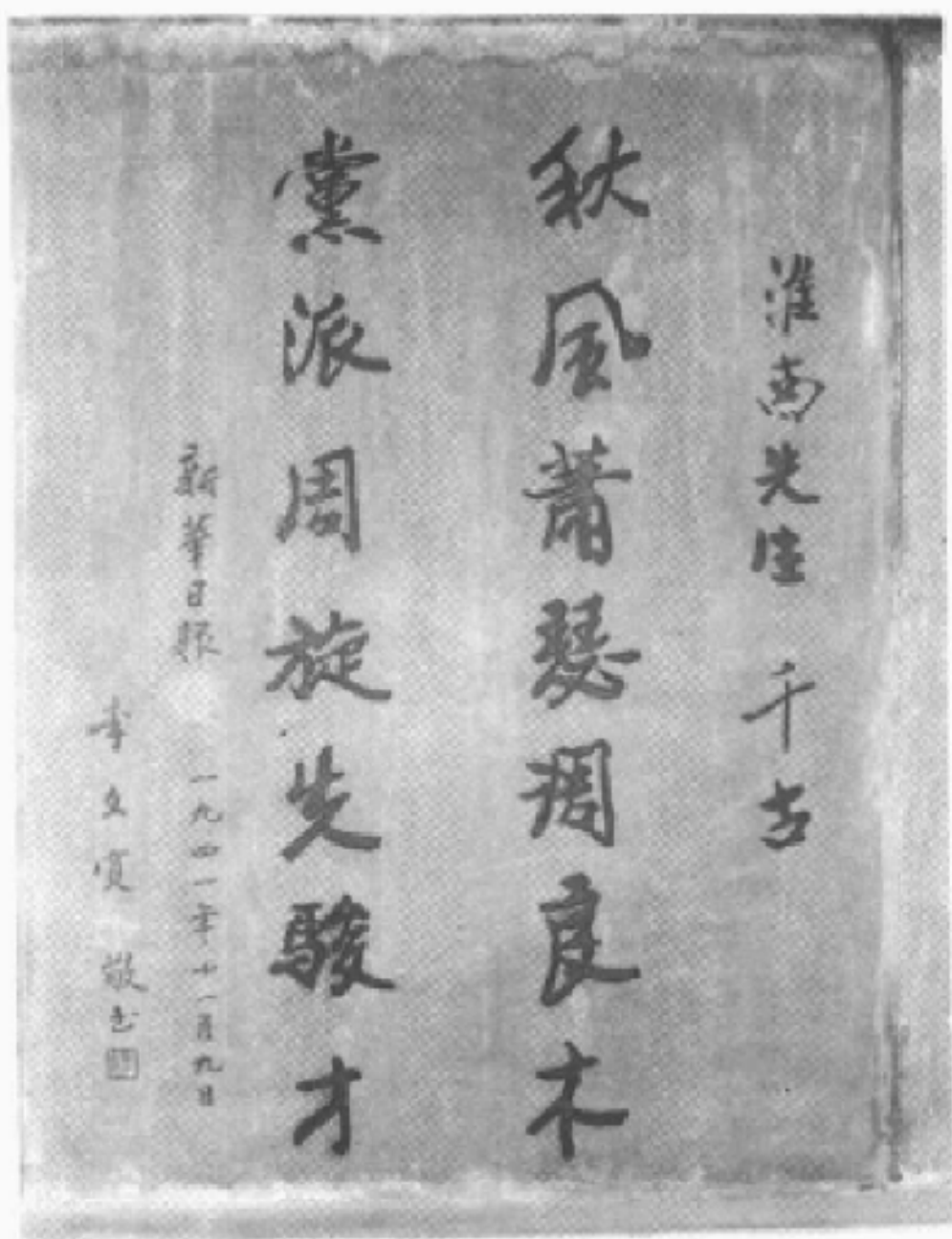
《新華日報》輓聯刻碑照