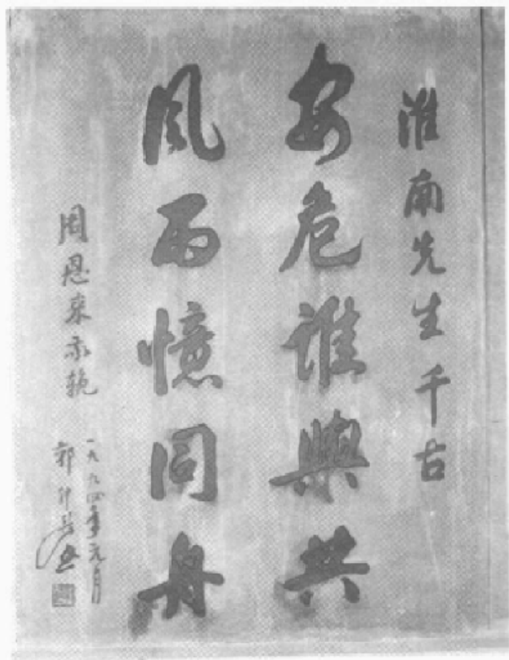
周恩來同志輓聯刻碑照