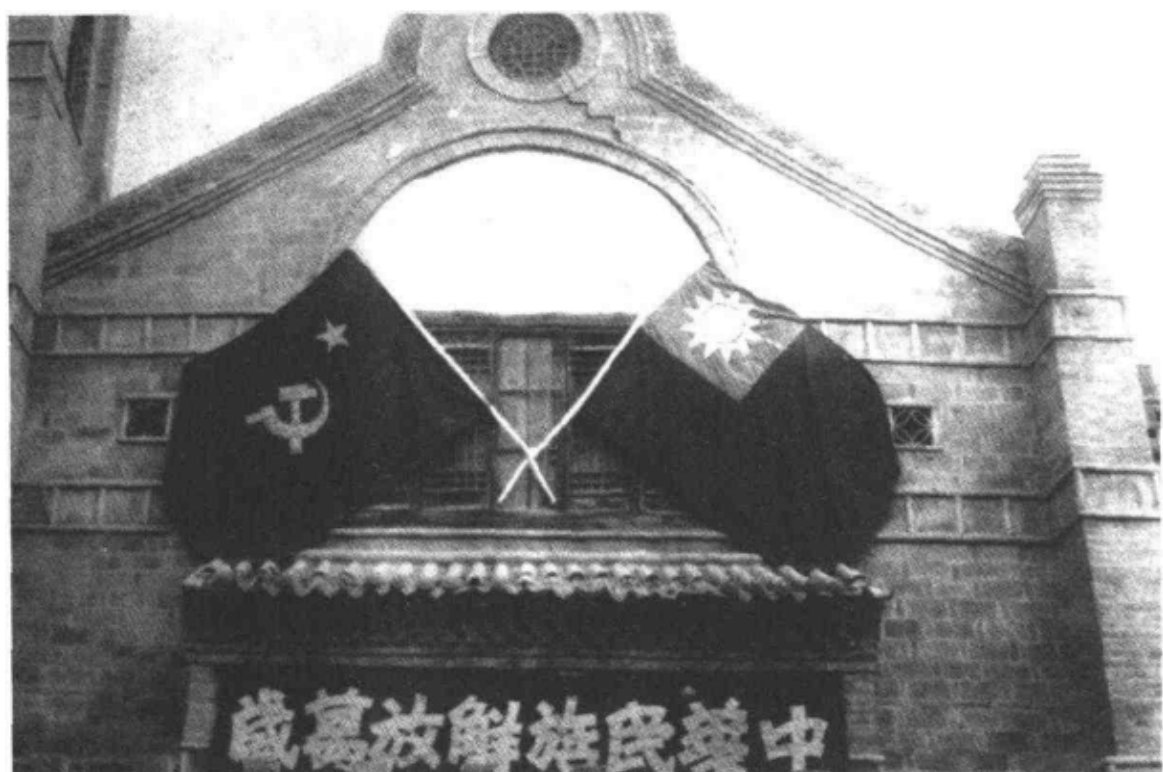
图⑤ 为了欢迎国民党中央调查团，延安同挂苏维埃政府与国民政府的旗帜。

至此，顾祝同、周恩来等就红军改编为国民革命军一部，苏维埃政府取消，改为中华民国特区政府等原则达成协议，不过在具体细节上则陷入了可以预料的僵局。2月15日至22日，国民党五届三中全会在南京举行，尽管宋庆龄、何香凝等人提案要求恢复孙中山的联俄联共政策，中共也尽量放低姿态以有利其主张，居于上风的国民党仍以严厉的语气通过“根绝赤祸案”：（一）一国之军队必须统一编制，统一号令，方能收指臂之效，断无国家许可主义绝不兼容之军队同时存在。故须彻底取消其所谓“红军”，以及其它假借之武力；（二）政权统一为国家统一之必要条件。世界任何国家，断不许一国之内，有两种政权之存在者。故须彻底取消所谓“苏维埃政府”及其它破坏统一之一切组织；（三）赤化宣传与以救国救民为职志之三民主义，绝不兼容，与我国人民生命与社会生活，亦极端相背。故须根本停止其赤化宣传；（四）阶级斗争以一阶级之利益为本位，其方法是将社会分成种种对立