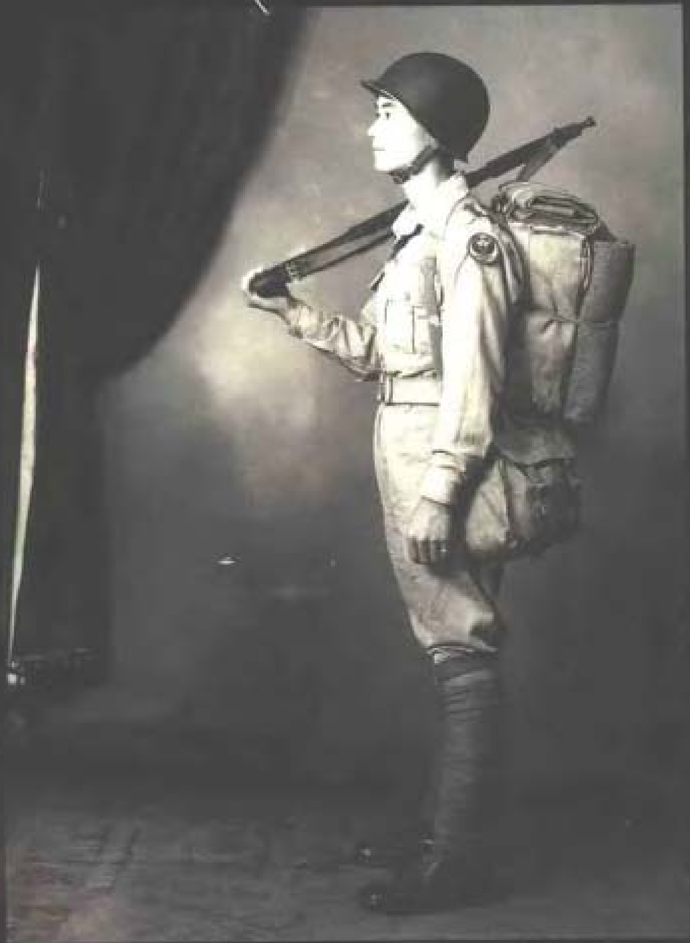
“国军”士兵（1948年摄于长春）