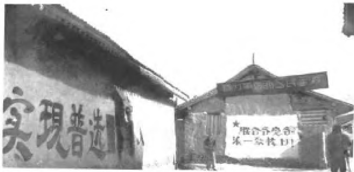
图⑥ 延安城内的政治标语包括了“实现普选”等口号。