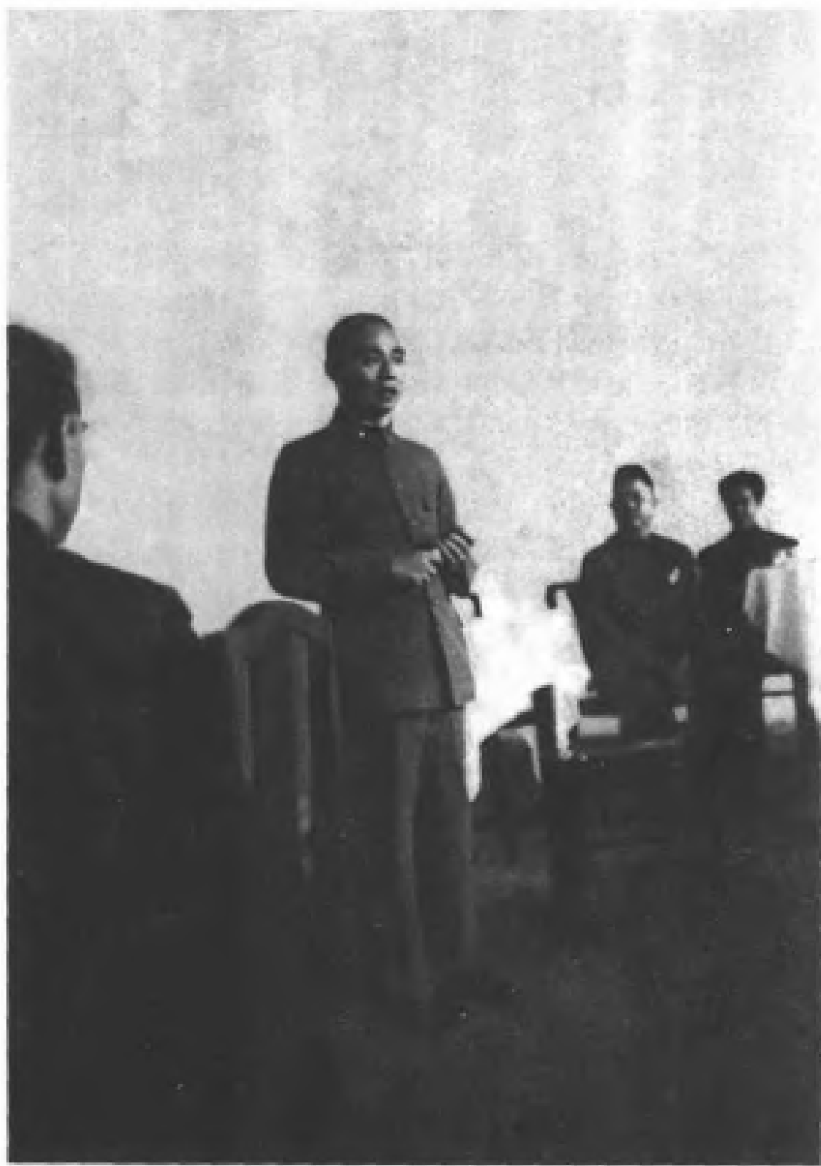
图① 中央调查团出发前，西安行营主任顾祝同向团员们发表谈话。