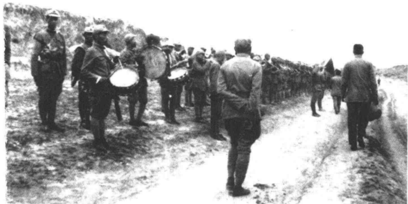
图④ 欢迎中央调查团的红军鼓乐队

员会，红军应派代表参加。国民党保证不逮捕共产党员，不破坏党组织，红军中的党组织不变。隔日，毛泽东再电周恩来，又补充几点：中共应参加国府军委会、总司令部、国防会议、国民大会等，抗日后参加政府。尽管中共中央立场明确，不过此时东北军和第十七路军（西北军）已呈分崩离析，红军又陷形只影单的不利局面，上述条件被国民党接受的可能性几乎是零，只能看成一连串讨价还价的起点。与此同时，在国民党召开五届三中全会前夕，中共致电要求国民党停止一切内战，保障言论、集会、结社之自由，释放一切政治犯。并且保证共产党：（一）在全国范围内停止推翻国民政府武装暴动；（二）工农政府改名为中华民国特区政府；（三）在特区政府内，实施普选的彻底民主制度；（四）停止没收地主土地之政策，坚决执行抗日民族统一战线之共同纲领。