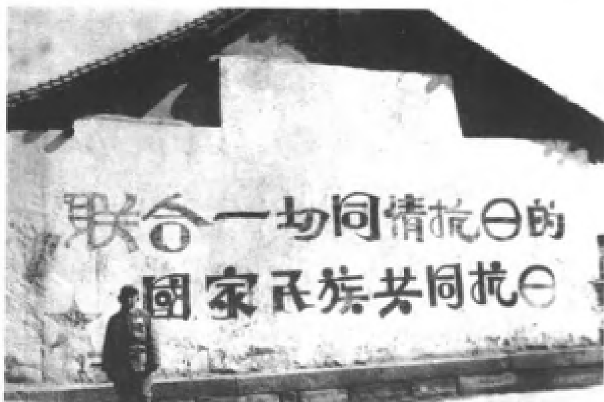
图⑤ 延安城内的政治标语强调团结抗日