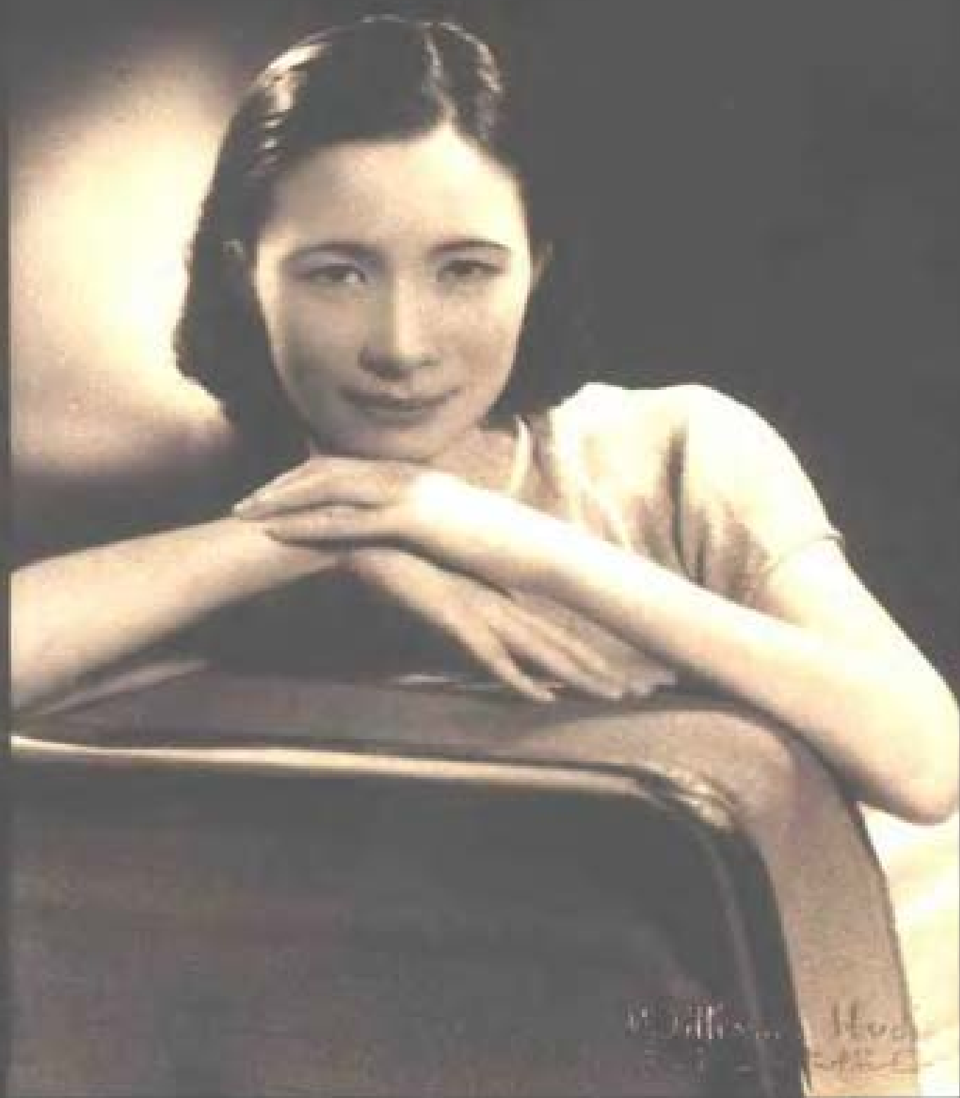
城市女性（摄于20世纪30年代）