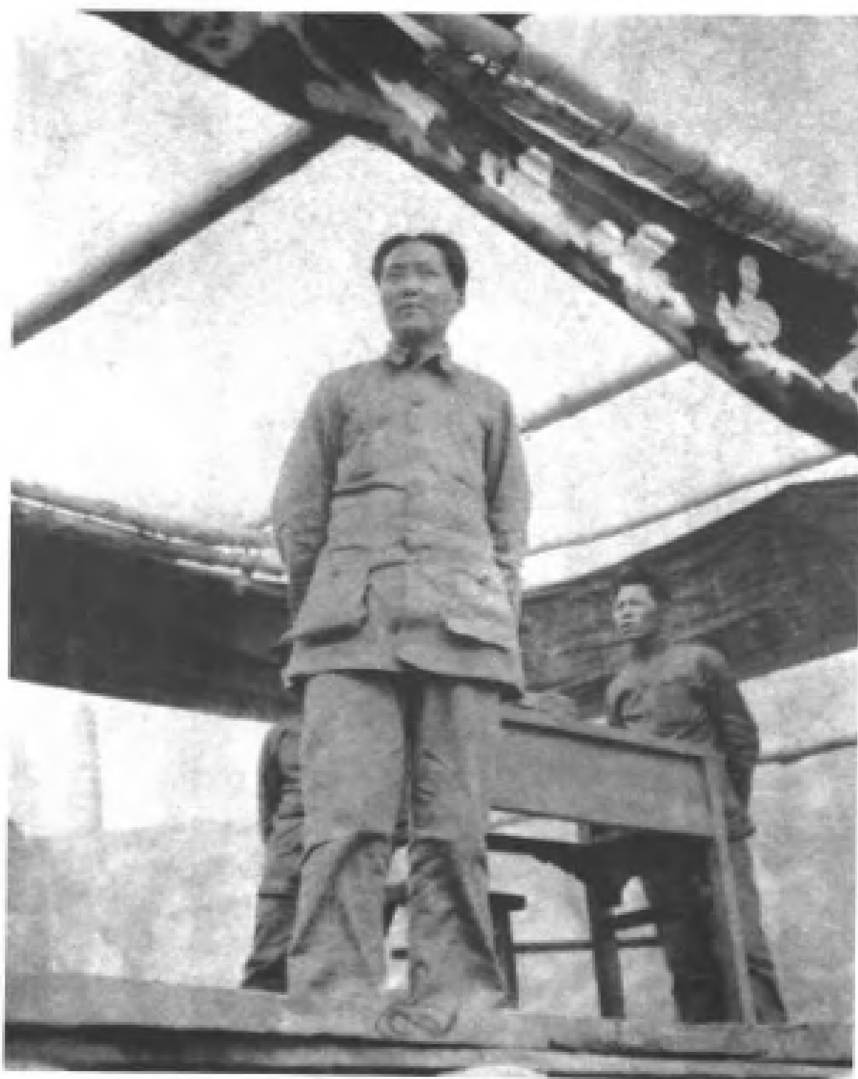
图⑤ 毛泽东在欢迎会上致词，强调区共两党合作将是长期的。