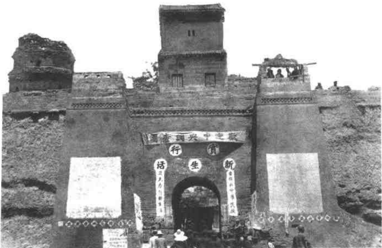
图③ 延安城南门挂起“欢迎中央调查团”的标语，同时也呼吁“实行新生活”，以看上去与国民党中央保持步调一致。

国民党旗帜，穿起国民党军装后，共产党必须继续与国民党进行根本的区隔。可以想见，在那样的环境中，共产党对内的思想斗争必然十分严格，一切都是为了保障自我的完整免受侵蚀。