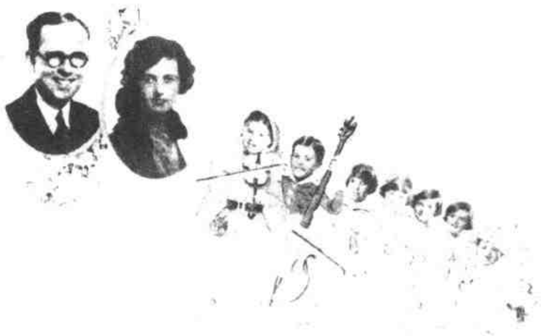
1927年肯尼迪家别致的圣诞贺卡

《幸福》杂志的一篇文章列举了1957年最有钱的美国人，文章估计约瑟夫的私人财产在两亿至四亿美元之间。而约瑟夫自己认为，他在1960年大约值“两亿美元”，大部分财产是1941年以后得到的房地产。也就是说，比他富有的美国人不过15至20人，这种实力足以激励他为子女的成长做巨额投资。