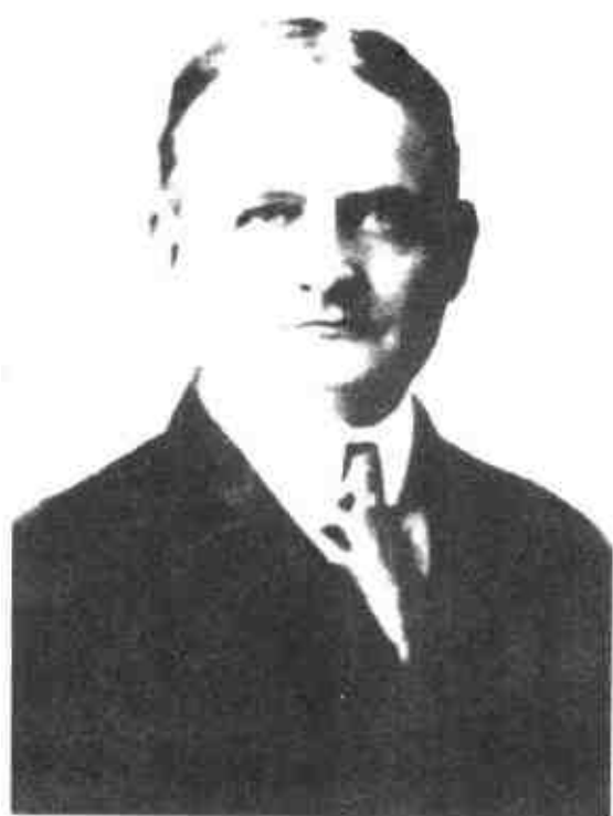
肯尼迪总统的外祖父约翰·F·菲茨杰拉德

年轻的爱尔兰箍桶匠。谁也不曾想到，正是他的远行，推动了一个伟大家族的诞生，他就是美国第35任总统约翰·肯尼迪的曾祖父帕特里克·肯尼迪。此后的百年间，肯尼迪家族凭着自己的才干与勤劳，在美国迅速创下了一份基业。到了约翰·肯尼迪的父亲约瑟夫·帕特里克·肯尼迪一代，财富迅速上升，他不满足于一个暴发户的角色，于是想在政治上有所突破。他凭借不可思议的嗅觉，敏锐地观察到当