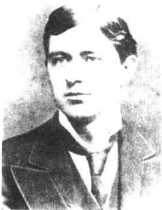
作为爱尔兰移民后代的约瑟夫大胆务实，是肯尼迪王朝的缔造者，肯尼迪总统的父亲