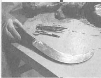
▲古代的解剖学家们用的是最原始的工具。