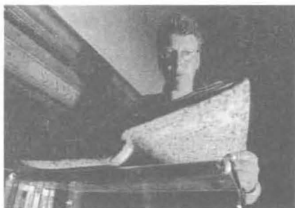
▲ 古罗马的盖伦在《医学集书》描述了解剖学在发展初期的情形。

历史上曾经有一段时间允许对人体进行解剖。据说，最早的机会出现在约公元前280年的古希腊帝国，尽管只持续了40年。一本非常