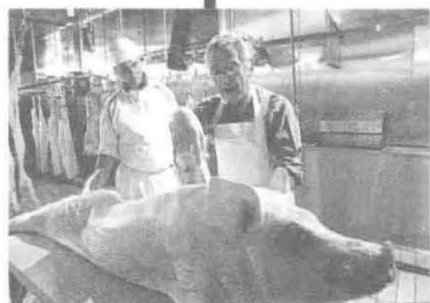
▲ 盖伦对动物进行活体解剖。