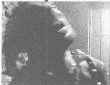
▲ 那些战死的角斗士们为盖伦提供了一个绝好机会。

他的贡献是首次记录了皮肤下面的完整构造。他还以自我吹捧的语气写了434卷有关人类解剖的著作。他的著作传遍了欧洲。但是，这些著作的局限性在于，那些解剖全都基于动物而非人体。在盖伦的著作里，他描述的子宫是狗的，他指出的肾脏的位置是猪的，他描述的拇指是猴子的。他很清楚，他并没有完全掌握人体的所有构造。但他还是告诉人们，他是完全正确的。除了列出身体的部位，盖伦还有