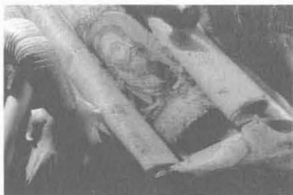
▲希腊帝国崩溃后，大多数解剖学发现被洗劫一空。解剖学史上出现了一段空白。直到450年后，解剖艺术才在盖伦的努力下开始复苏。

由古希腊的崩溃而被迫中断的古代解剖学被古罗马人继续了。这一次的带头人更像是一个艺术家，而不是解剖学家，他就是罗马的盖