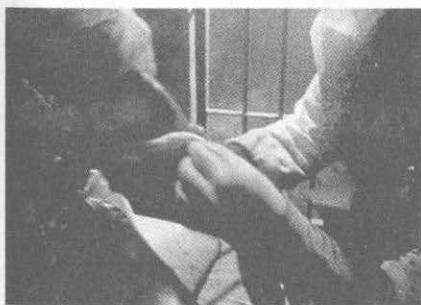
▲ 盖伦能够设身处地地查看人体内部构造。