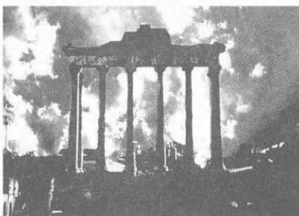
▲ 公元162年，在古罗马广场的台阶上，盖伦把恐怖动物活体解剖变成了一场艺术表演。