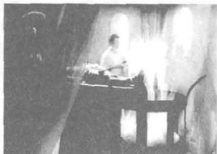
希腊人在40年里的发现远远超过了接下来的几个世纪。