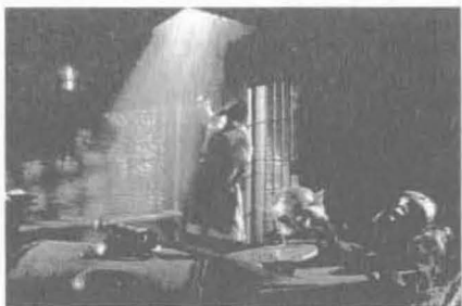
▲盖伦曾经公开表演了把一只猿猴的内脏放回肚子，然后缝合的手术。