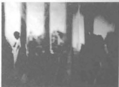
▲ 在古希腊，切开人体要受到道义的谴责。单在埃及，这种道德上的约束并不存在。