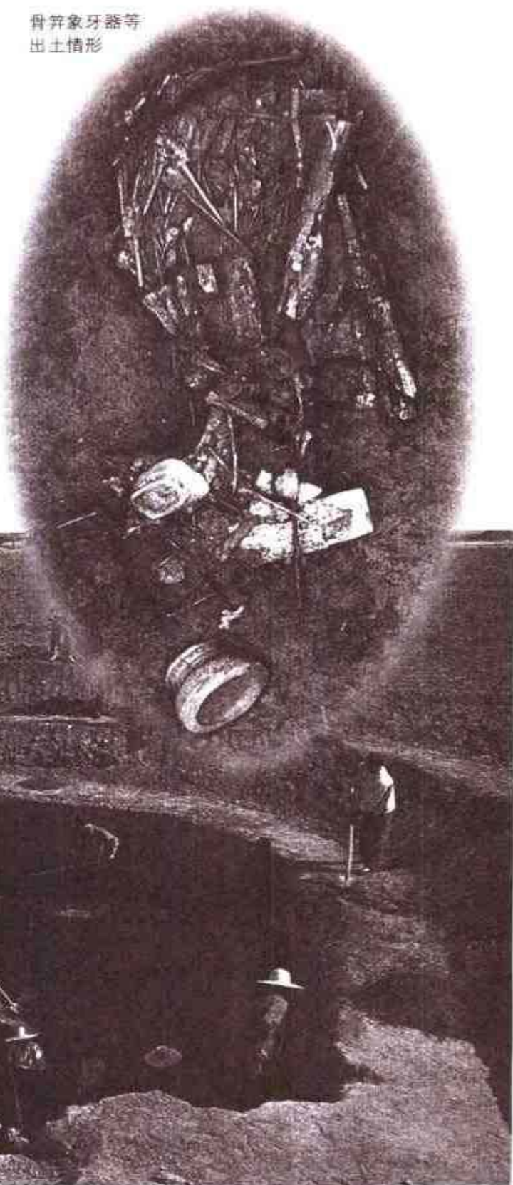
骨笄象牙器等 出土情形