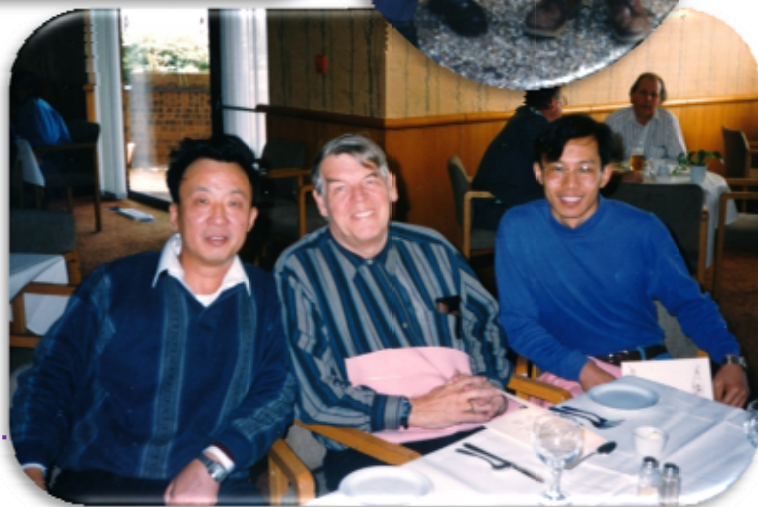
滑铁卢大学的送别宴