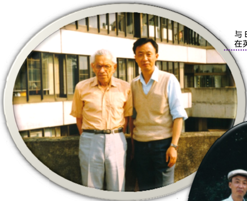
与 Erdos 大师 在英国 Norwich