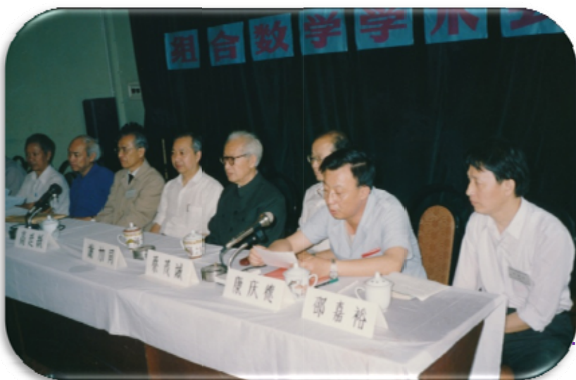
主持全国组合数学学术会议