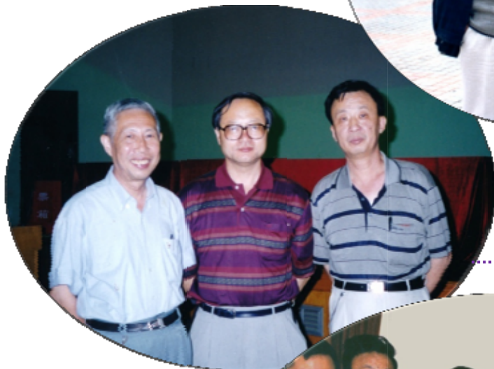
在中国数学会会议上 与马志明、张恭庆院士