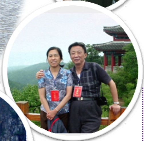
省管专家承德疗养