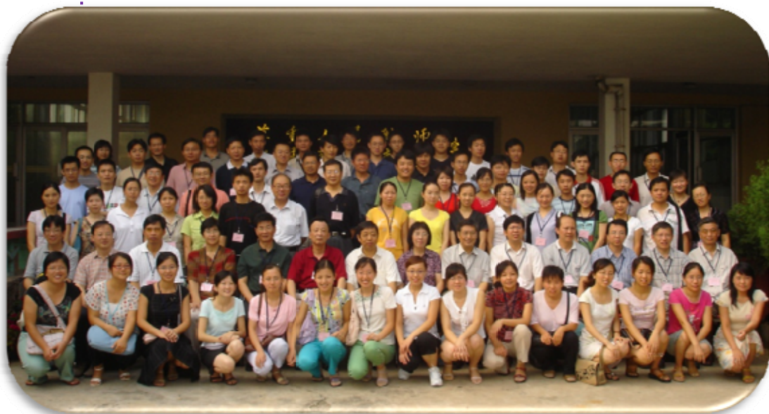
主持组合设计 国际论坛