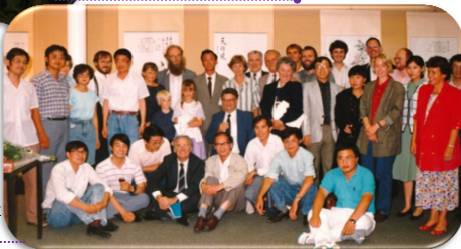
取得博士学位 后的招待会