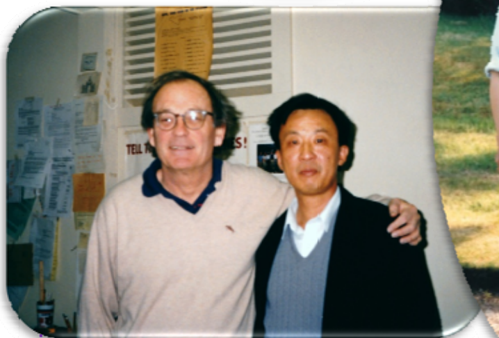
在 Lindner 办公室