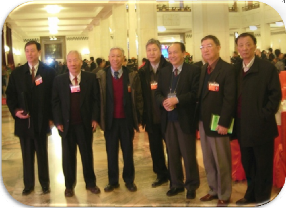
数学界部分全国人大代表