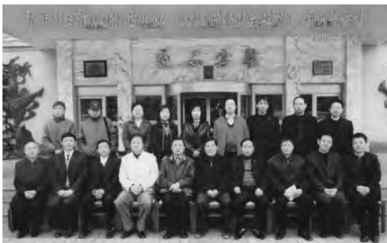
◆2007年11月15日,作者长篇小说《米脂的婆姨绥德汉》研讨会参会人员合影