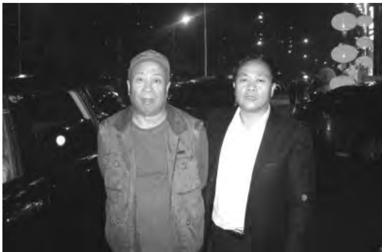
◆作者和著名导演吴天明合影