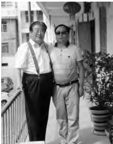
◆作者与著名 诗人曹谷溪合影