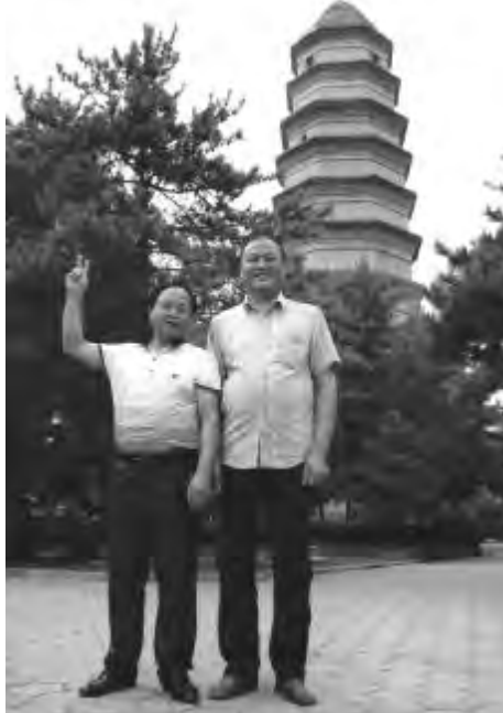
◆作者与作家 马志明合影