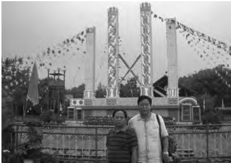
◆作者与著名散文家史小溪合影