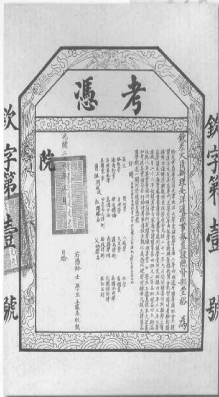
中国第一张大学毕业文凭 The first University diploma of China