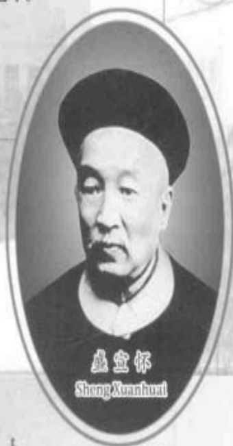
盛宣怀 Sheng Xuanhuai

Within the last 100 years, Peiyang has been responsible for providing a wealth of academic talent for the country.