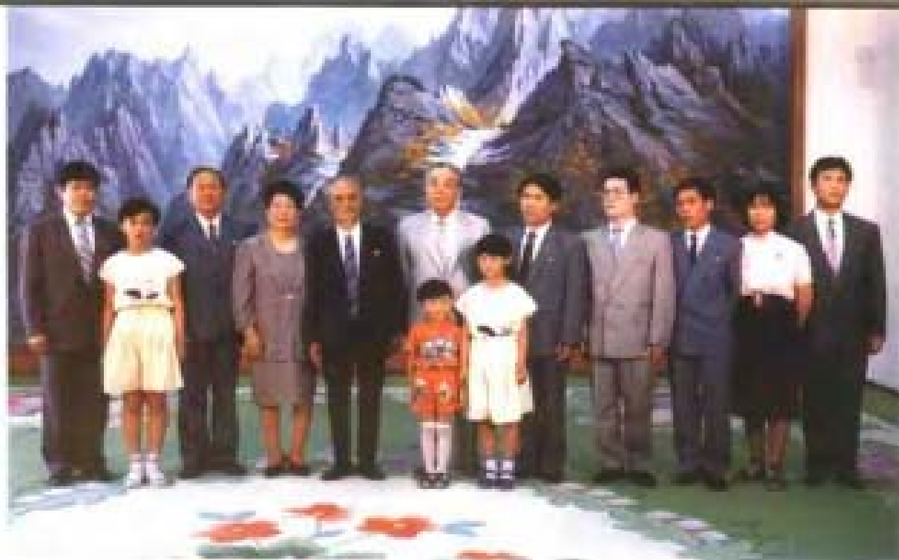
1993年金日成主席与张金泉一家五代人欢聚一堂。