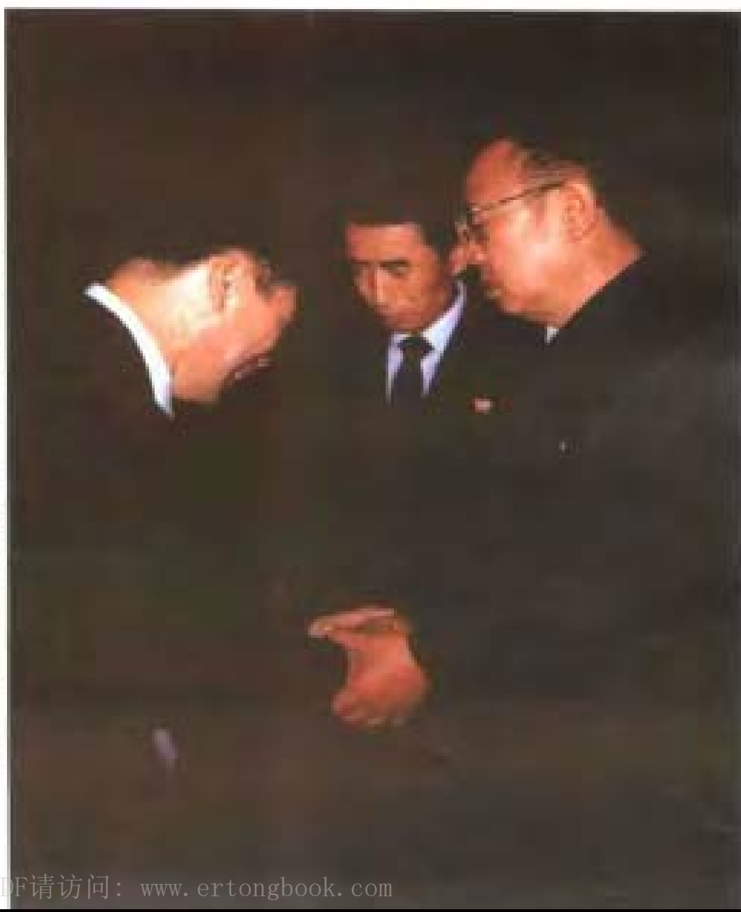
在金日成主席治丧期间，张金象向金正日（右一）致敬。