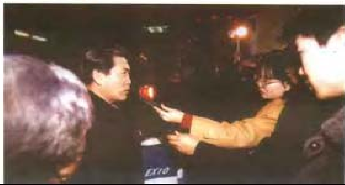
2001年张金泉在平壤答记者问。