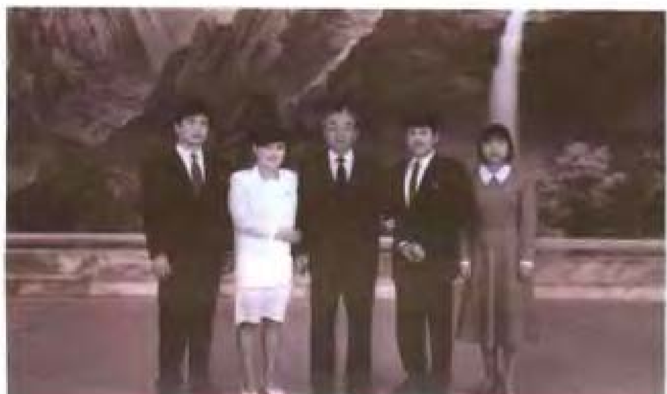
“1959年金日成主席與張家第四代人。左一 張瑛、左二張瑛、左四張瑛、左五岳志云”