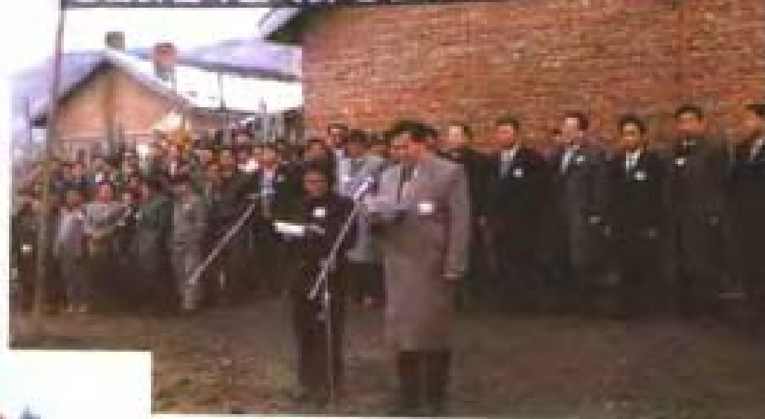
1992年金日成主席向张蔚华烈士送 纪念碑仪式。