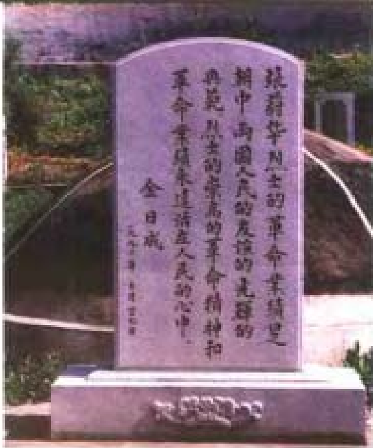
金日成主席为张蔚华送 来的亲笔书写的纪念铭文。