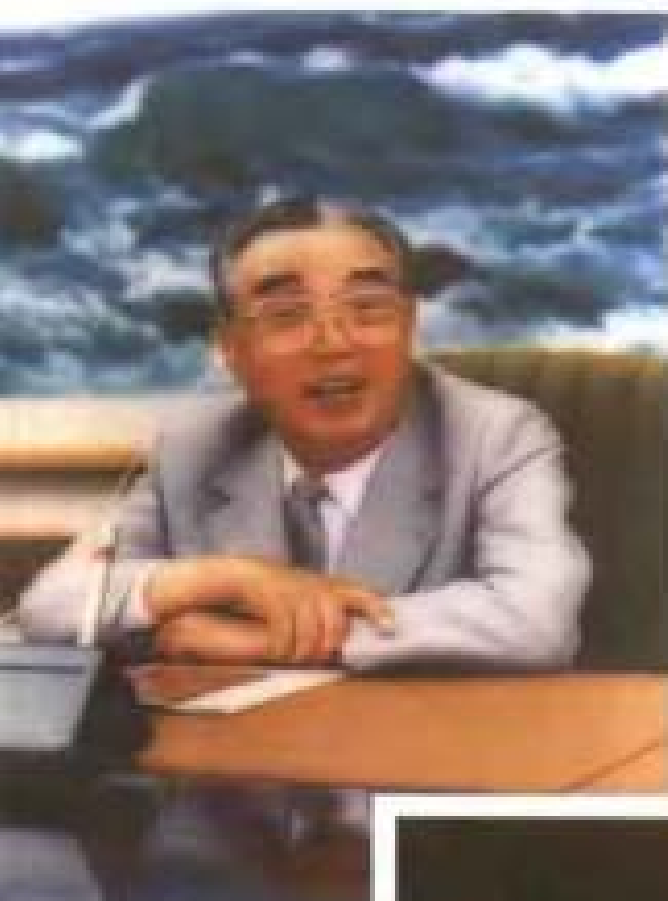
1993年张金泉为金日成主席拍摄的像片。