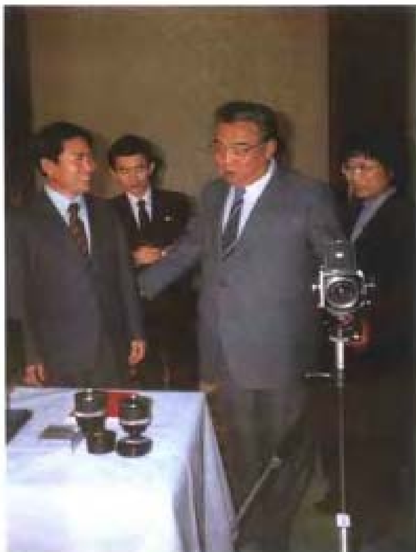
1985年金日成主席向张金泉赠送照相器材。