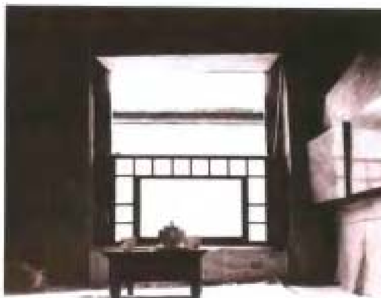
当年金日成和张蔚华开搞革命活动的房间。