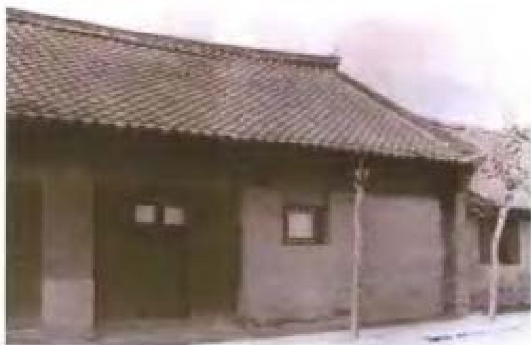
金日成主席在抚松县小南门的故居。