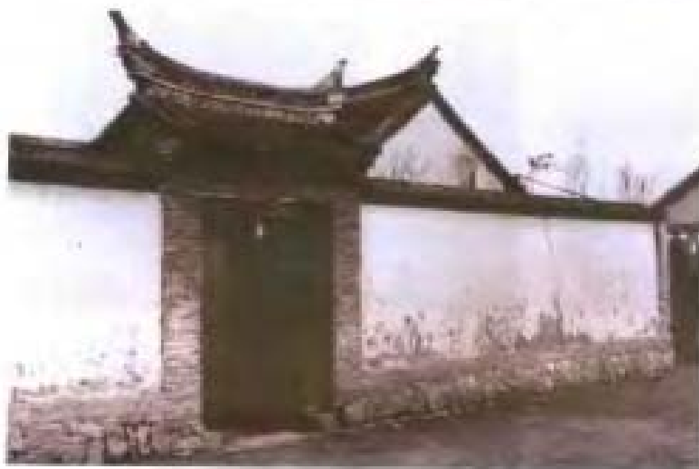
张家在抚松的老子大门。