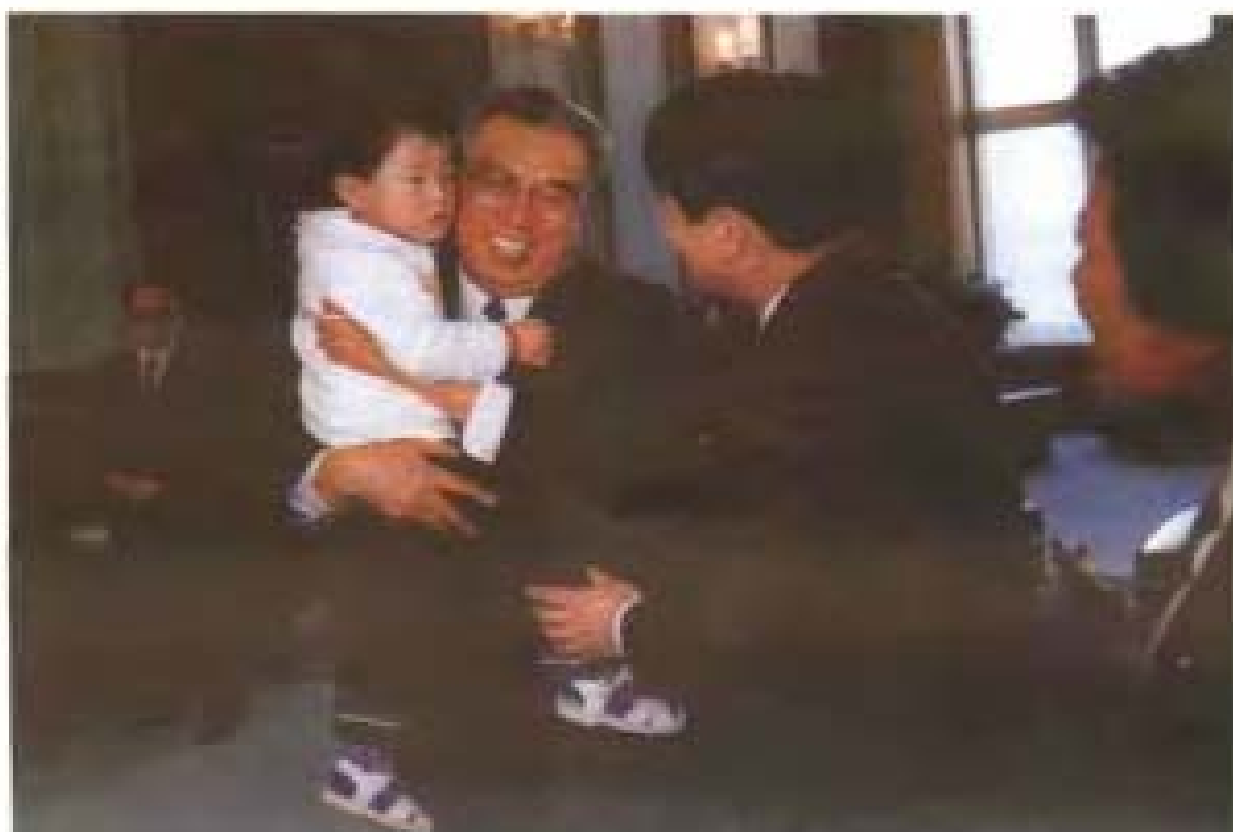
金日成主席抱起张金泉第五代小孙女。