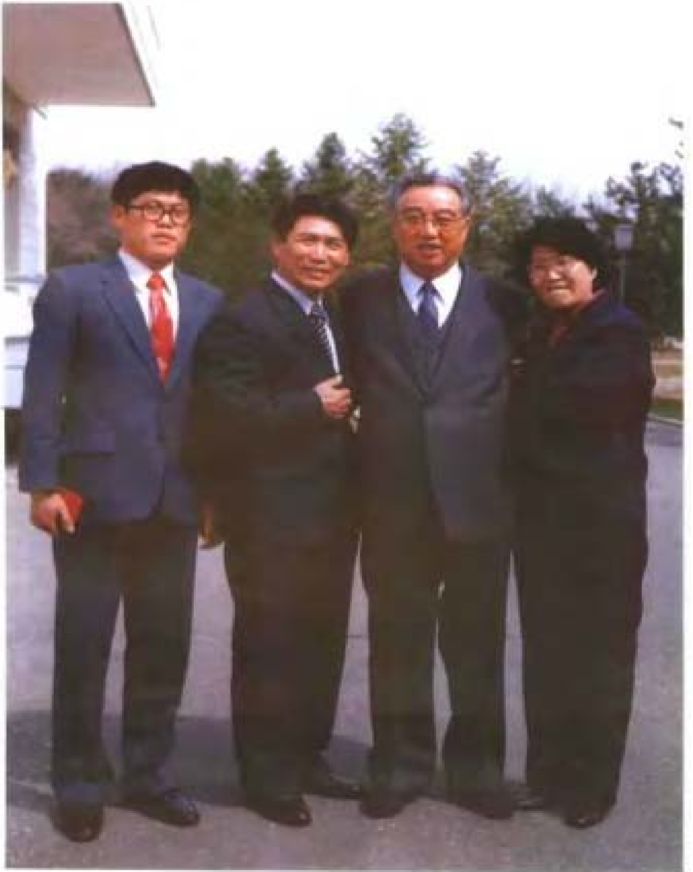
金日成主席与张蔚华烈士的后代（左二 儿子张金家，左四 女儿张金禄，左一 孙子张琪）。