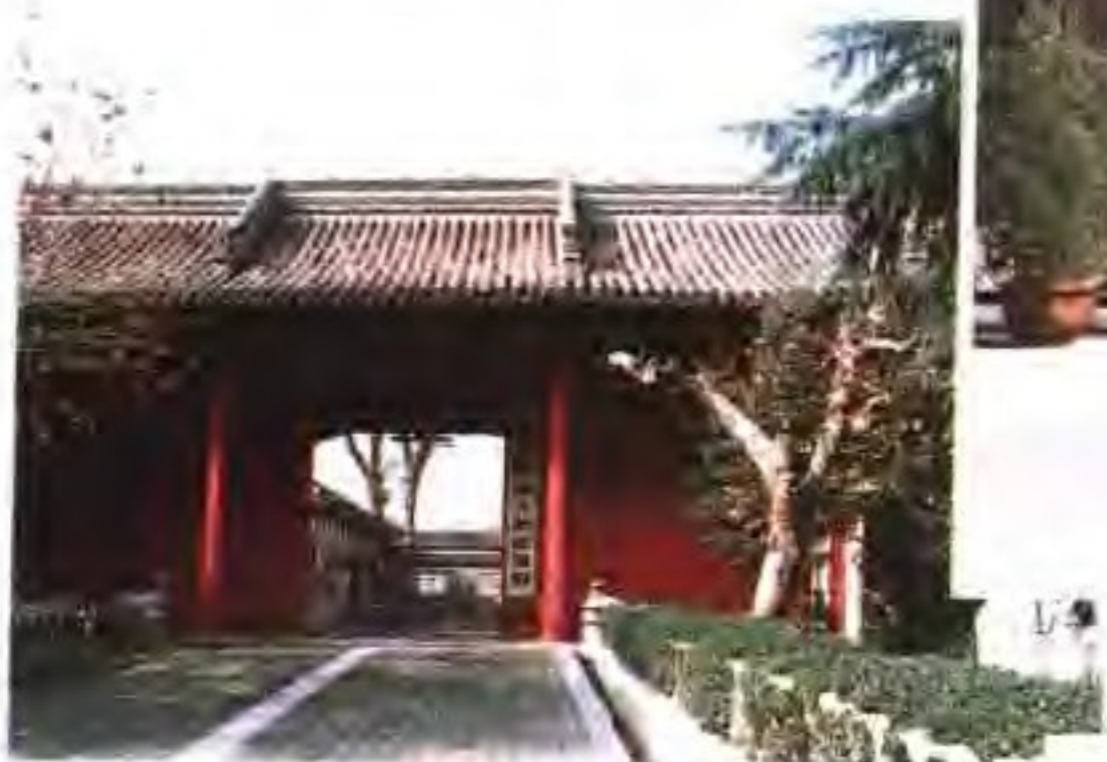
清代两淮盐运使署(今扬州市检察院驻地)