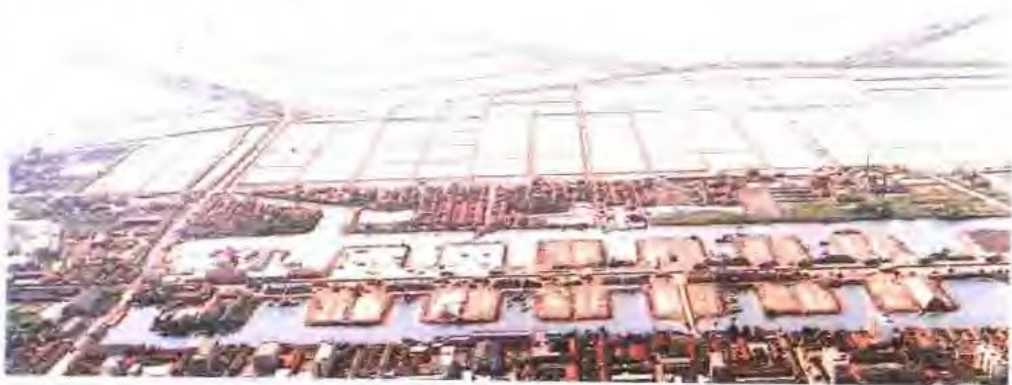
台北盐场集中结晶式盐田一角