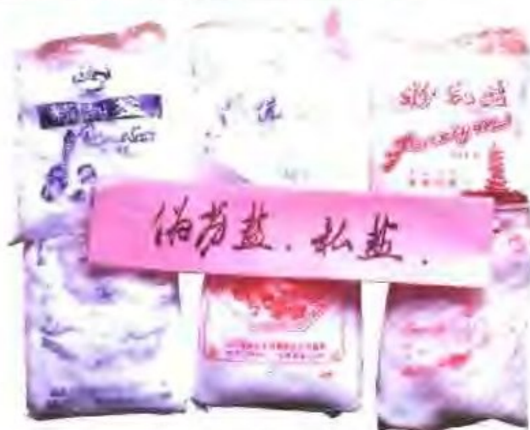
盐政部门缉获的私盐