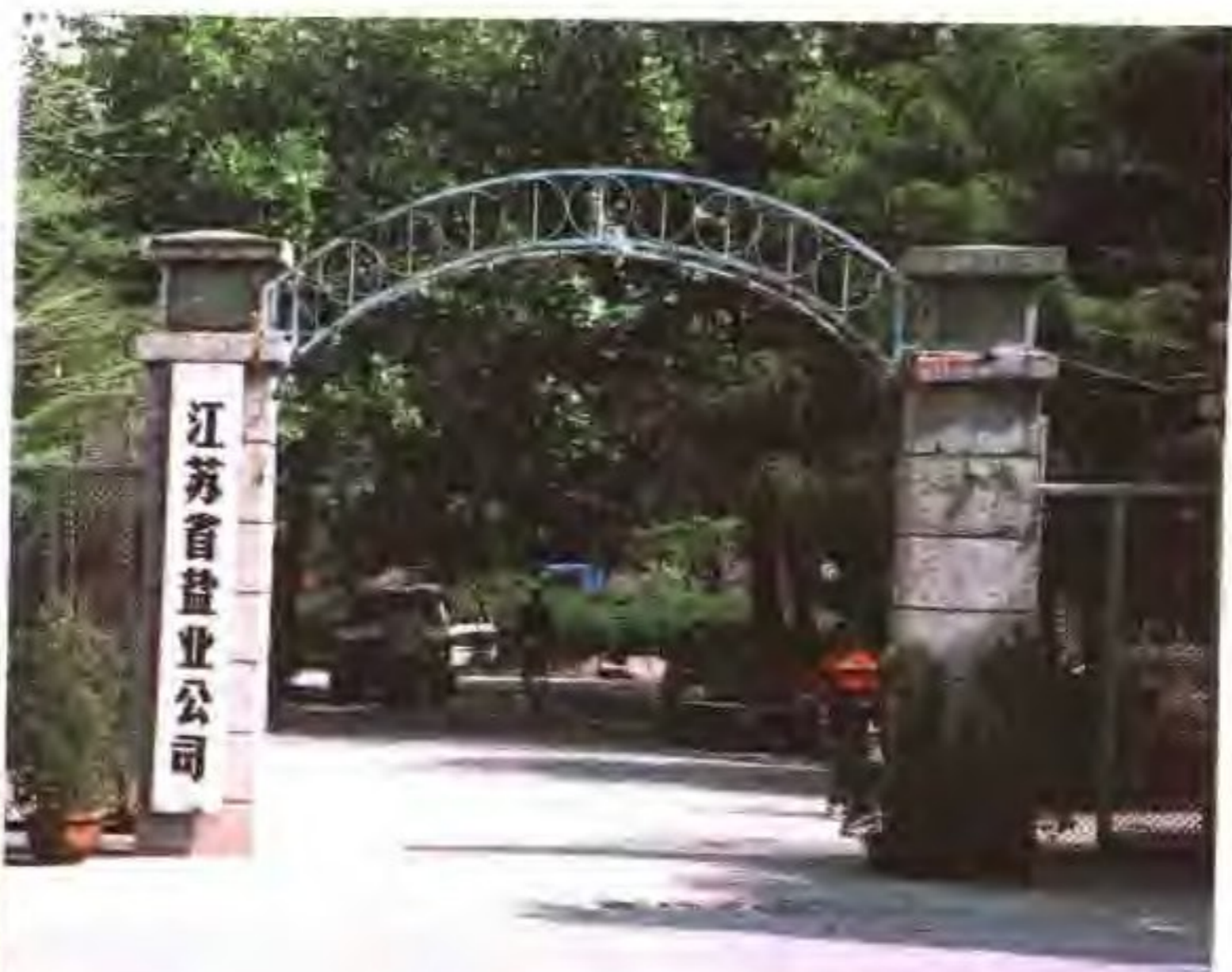
江苏省盐业公司驻地(连云港市)