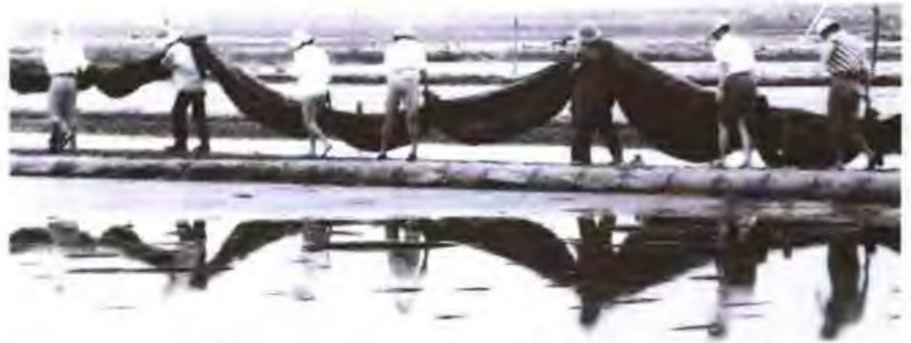
盐工在塑苫结晶池上装塑料薄膜