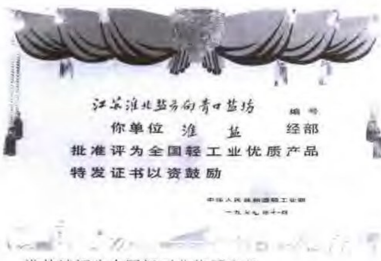
淮盐被评为全国轻工业优质产品