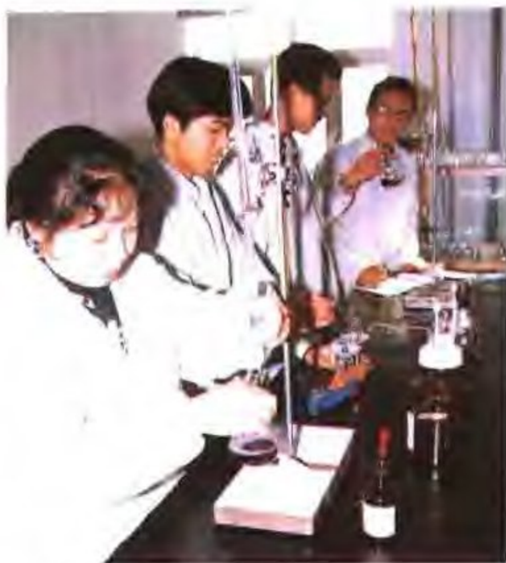
检测人员在分析盐的质量