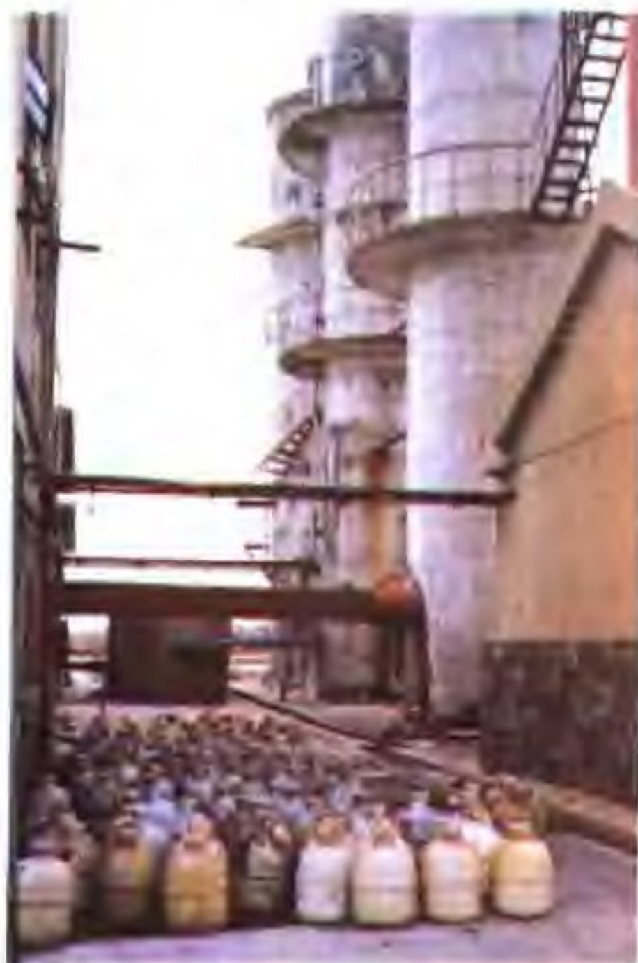
溴素生产车间及产品堆场