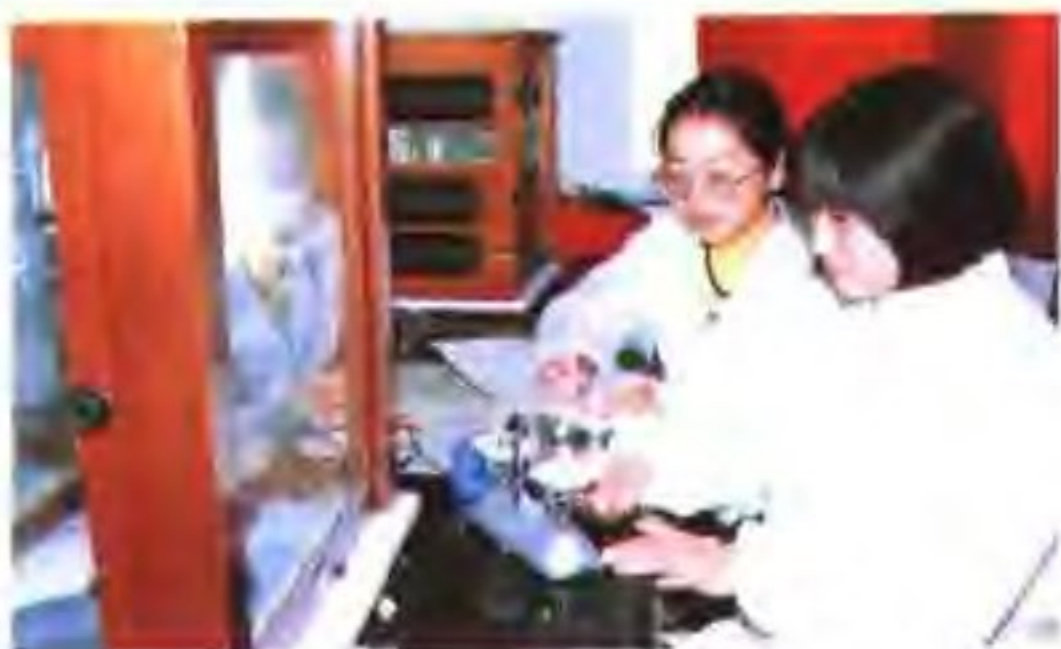
检测人员称量盐样品