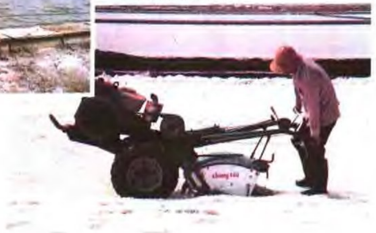
收盐前的机械活碴