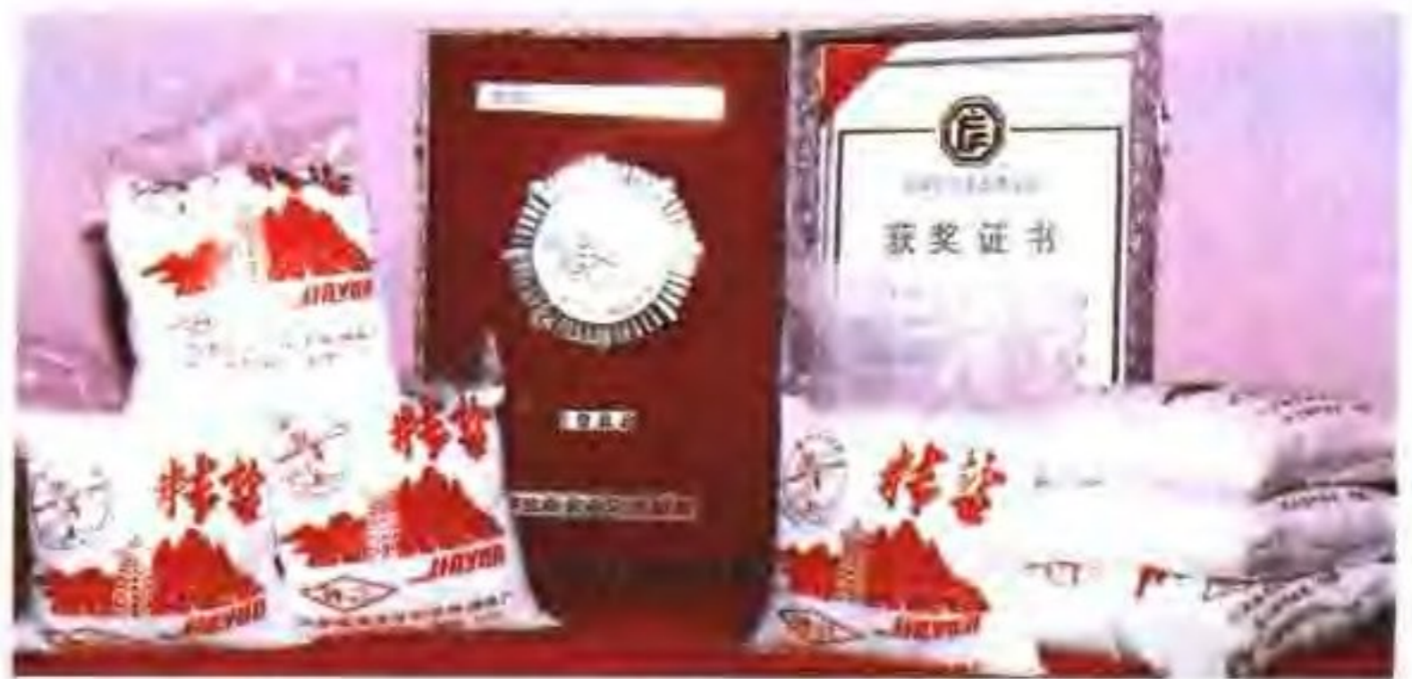
江苏首创的粉精盐 1988 年在首届中国食品博览会上获奖