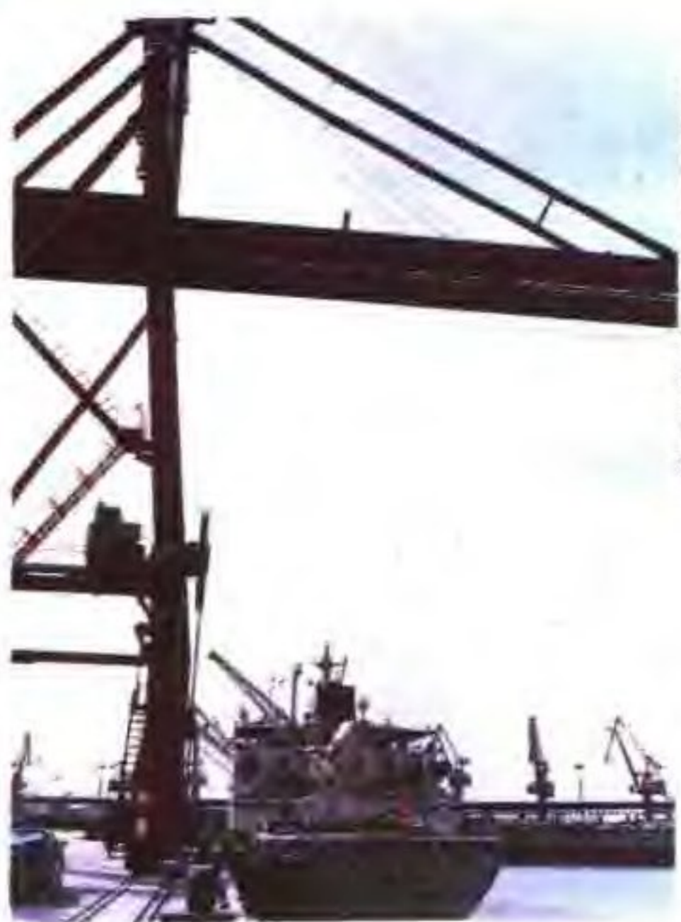
陈港码头轮船装运原盐