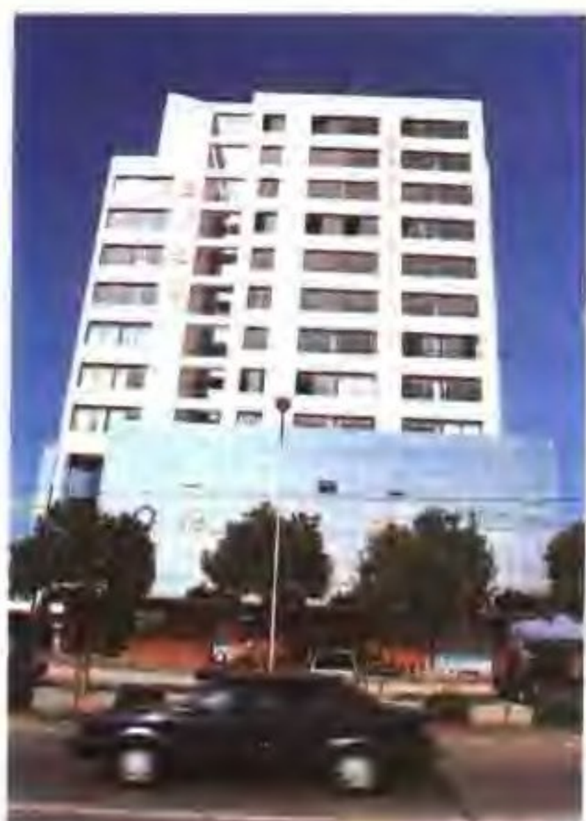
苏州市盐务管理局机关及营业大楼