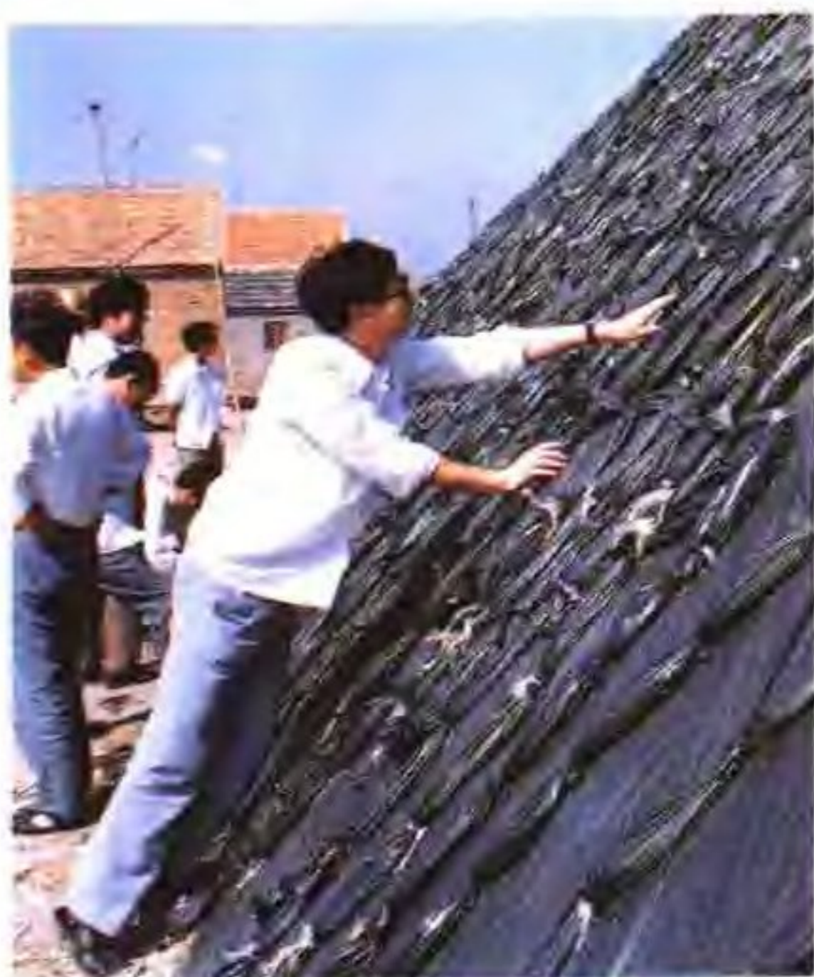
试用塑料薄膜苫盐廩