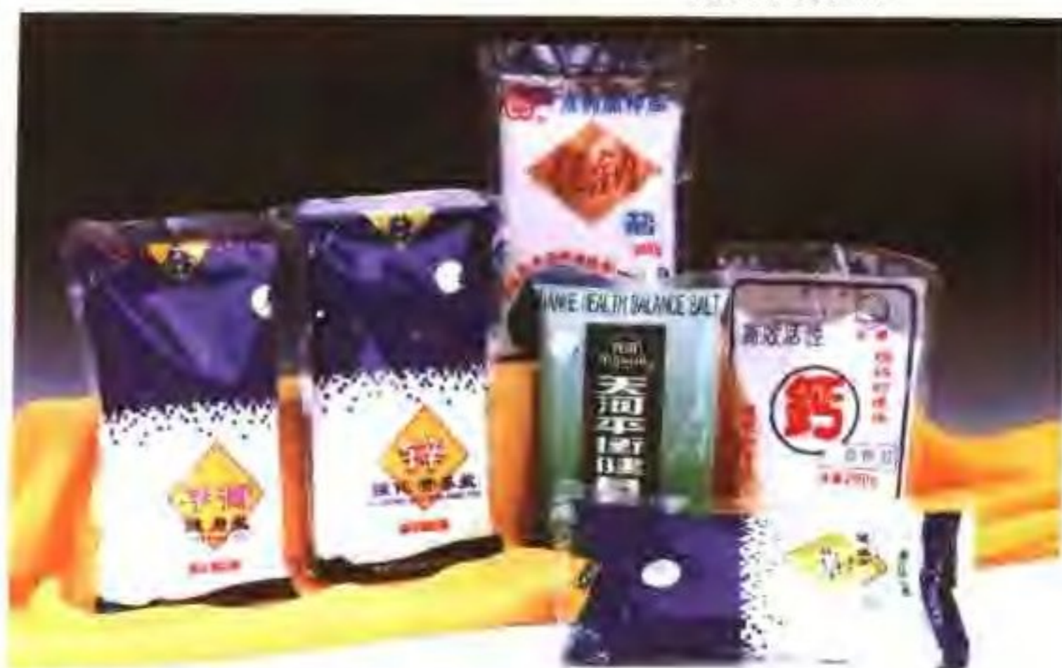
强化锌营养盐、低钠盐、钙营养盐