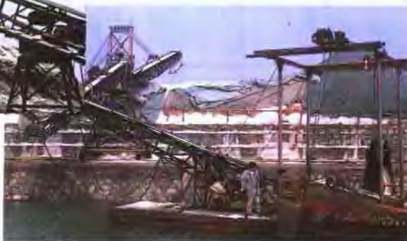
陈港坨地机械扒盐上廩