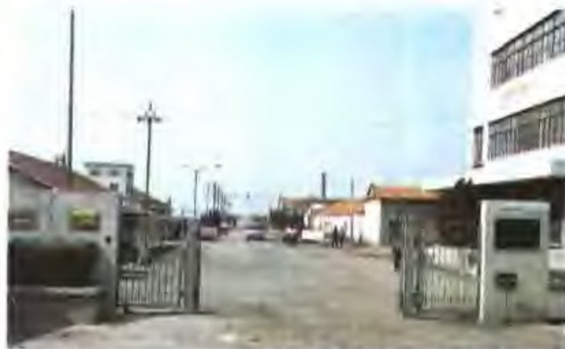
苦卤综合利用企业——黄海化工厂