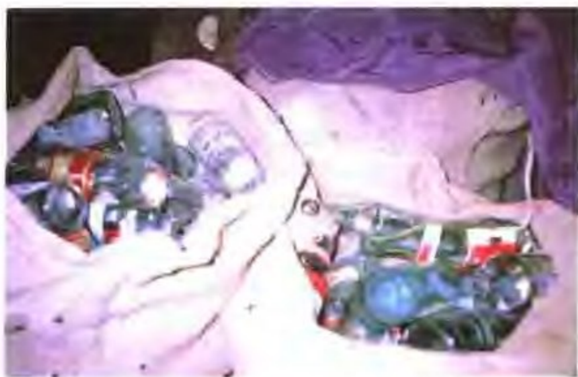
缉获的劣质盐及用劣质盐制作的酱油等