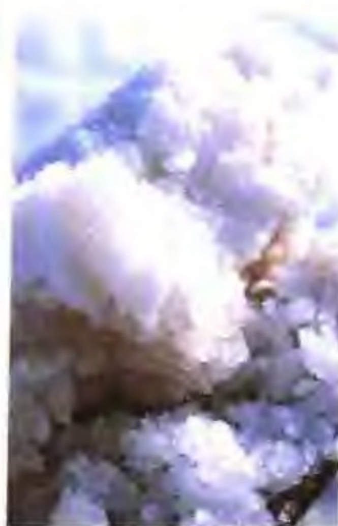
驰名中外的淮盐结晶体