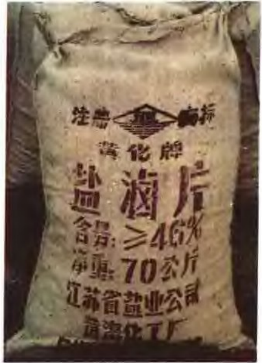
盐涵片(氯化镁成品)