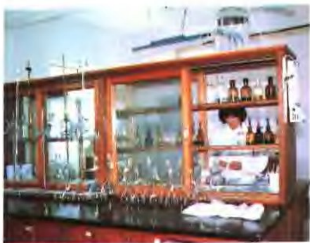
盐业产品质量检验站化验室