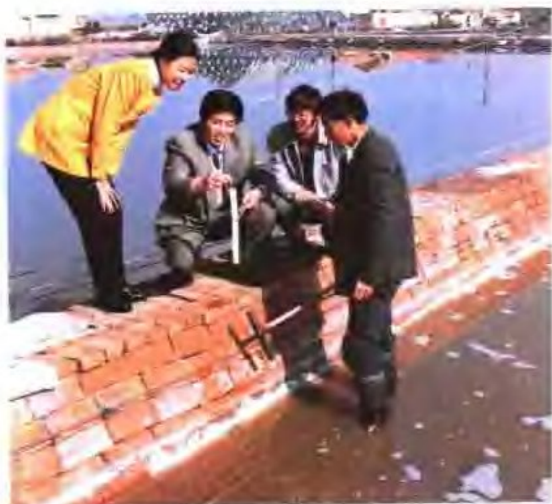
省盐业研究所科研人员深入滩头调查卤水质量