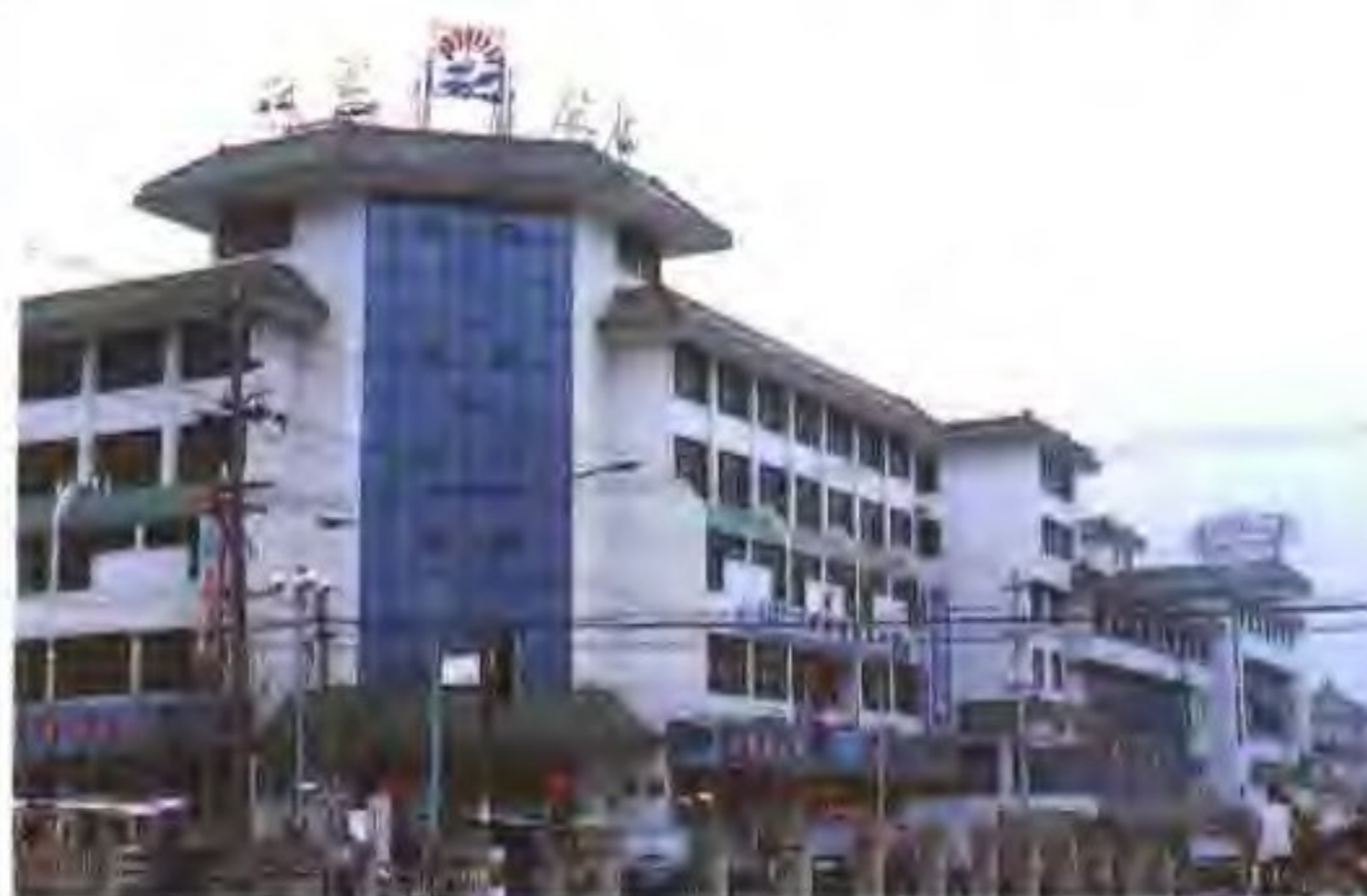
江阴市盐务管理局、盐业支公司机关及营业大楼