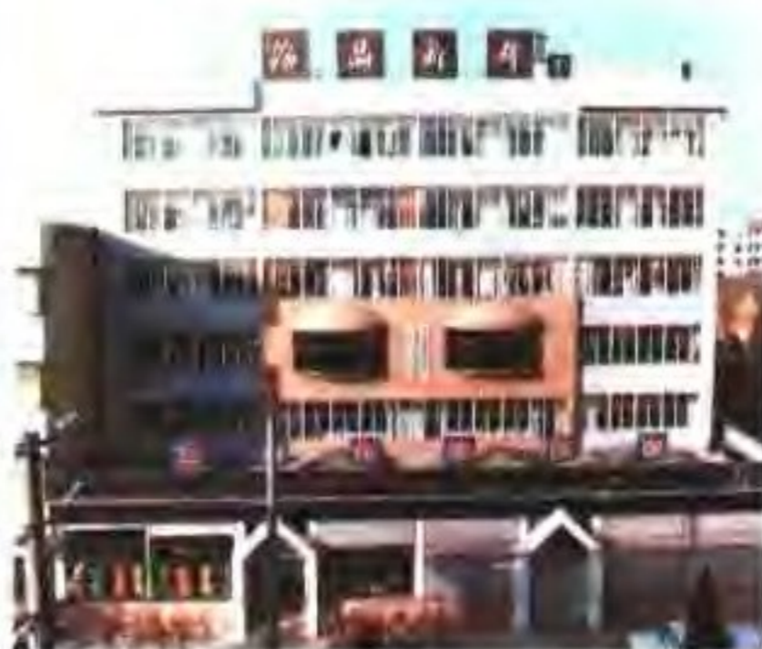
大丰县盐务管理局