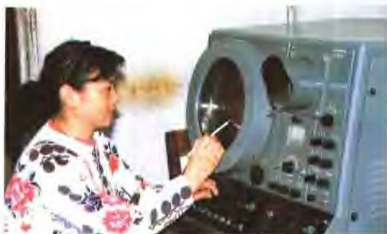
盐业气象台工作人员在操作雷达观测天气