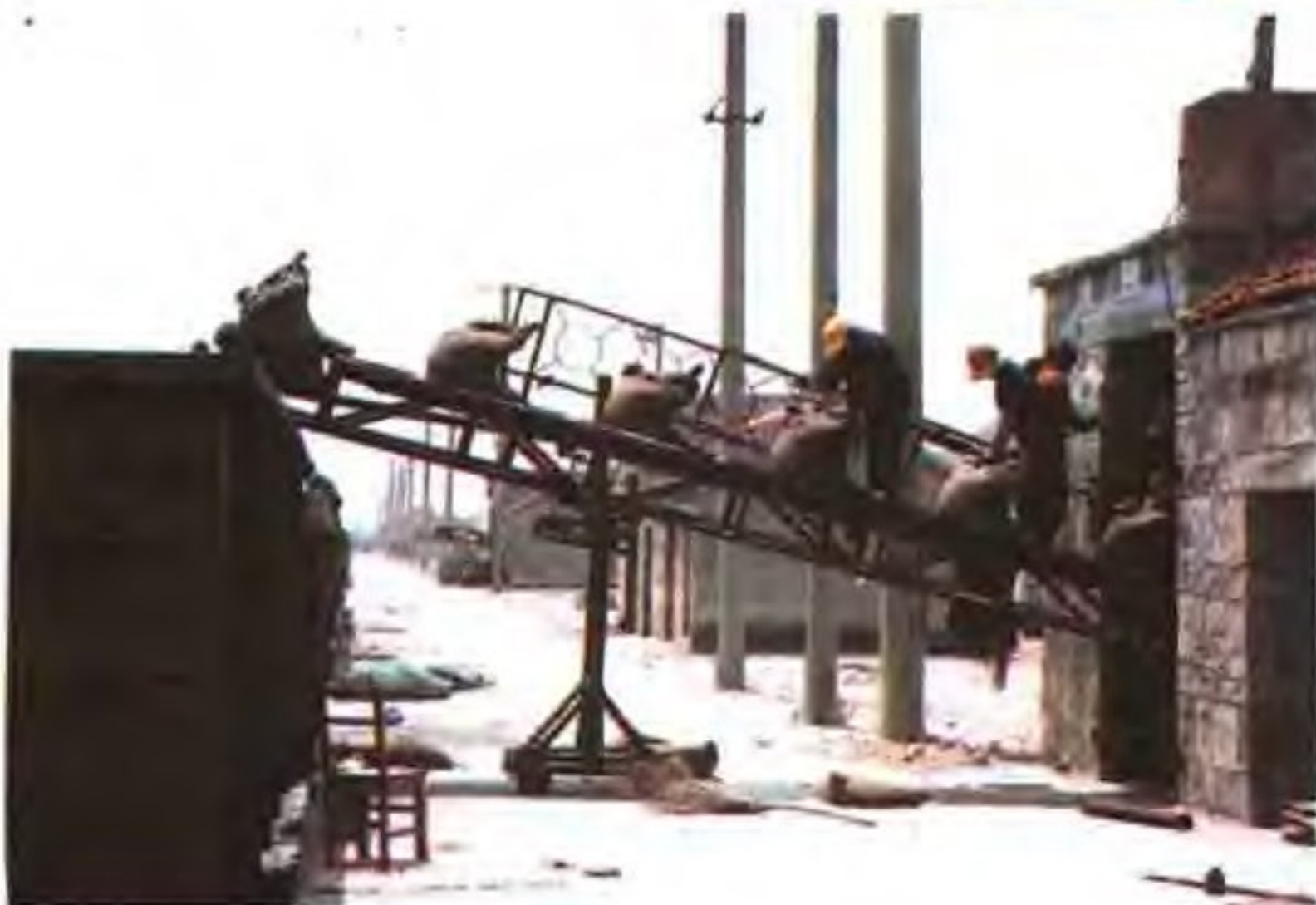
云台坨机械筑包装车