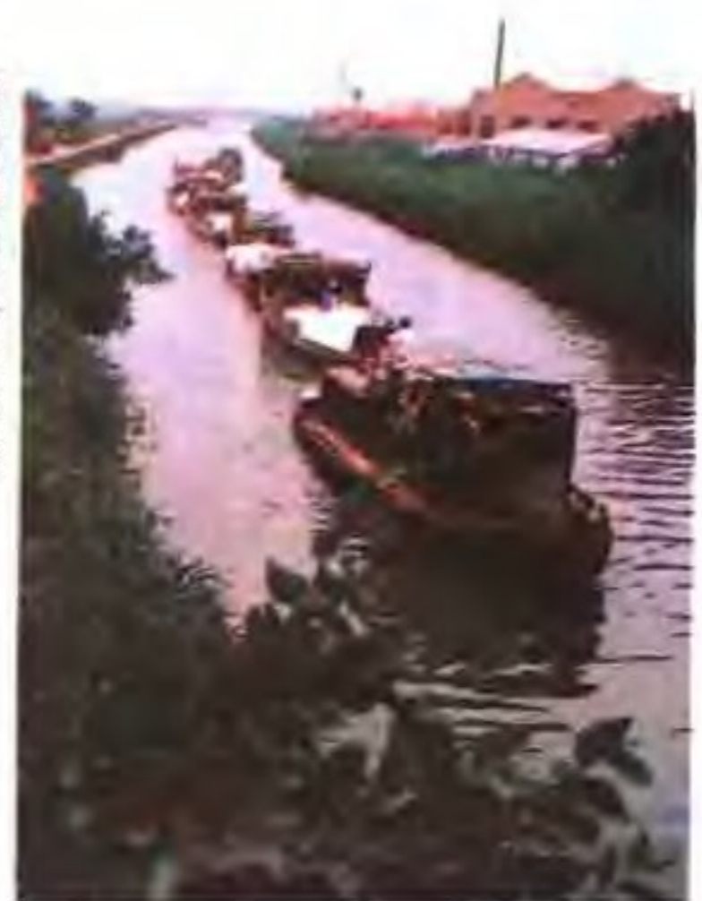
拖轮运输队在运盐