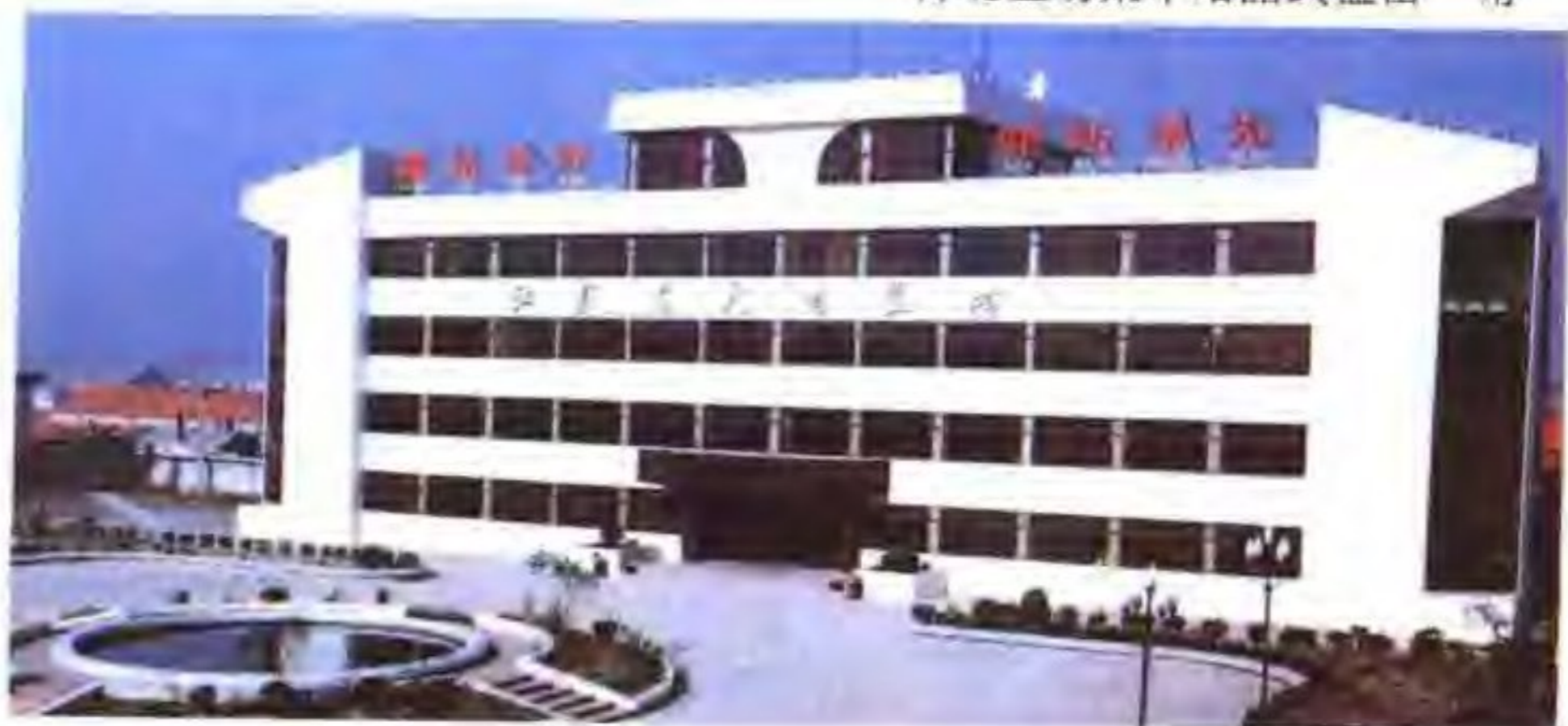
射阳盐场场部大楼