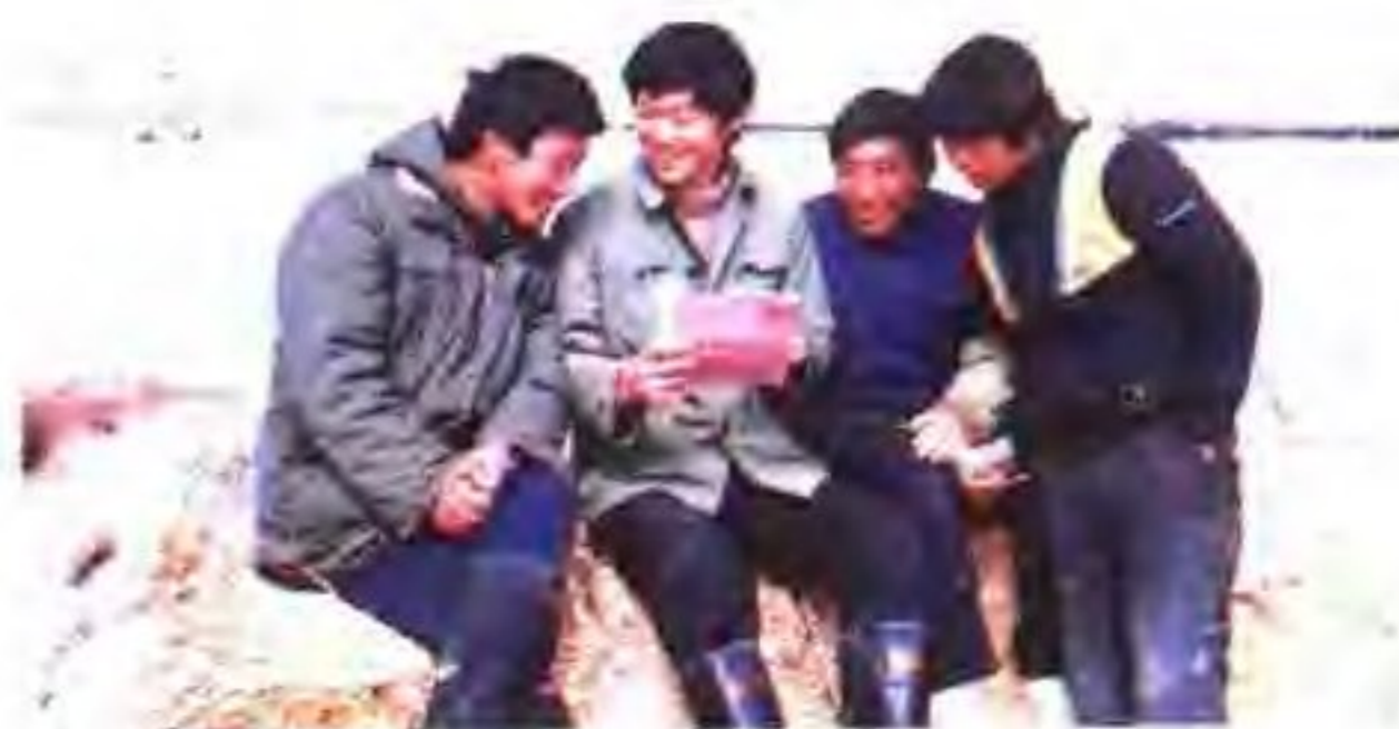
盐场工人在滩头学习