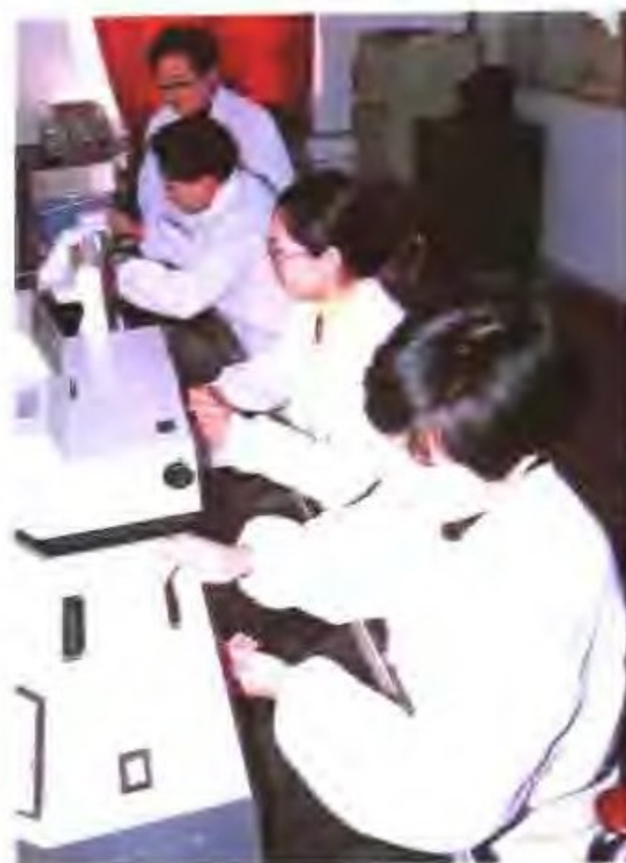
省盐业质量检测中心电子仪器设备