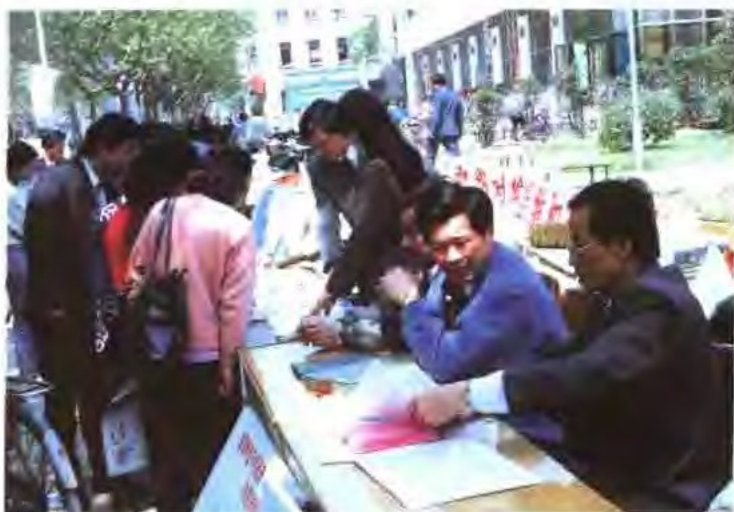
无锡市盐务局宣传推广食用加碘盐