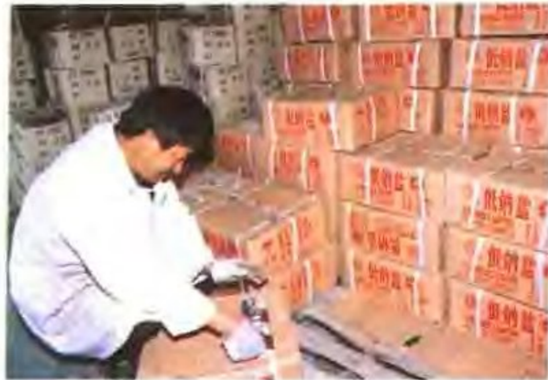
等待外销的低钠盐