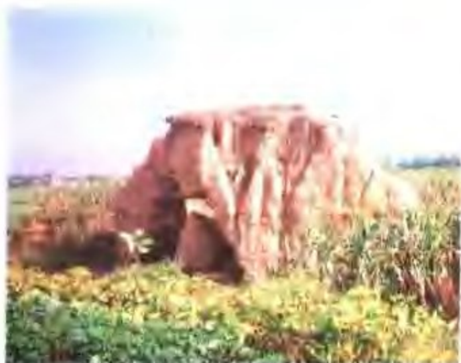
汉代盐仓城遗址(赣榆县龙河乡)