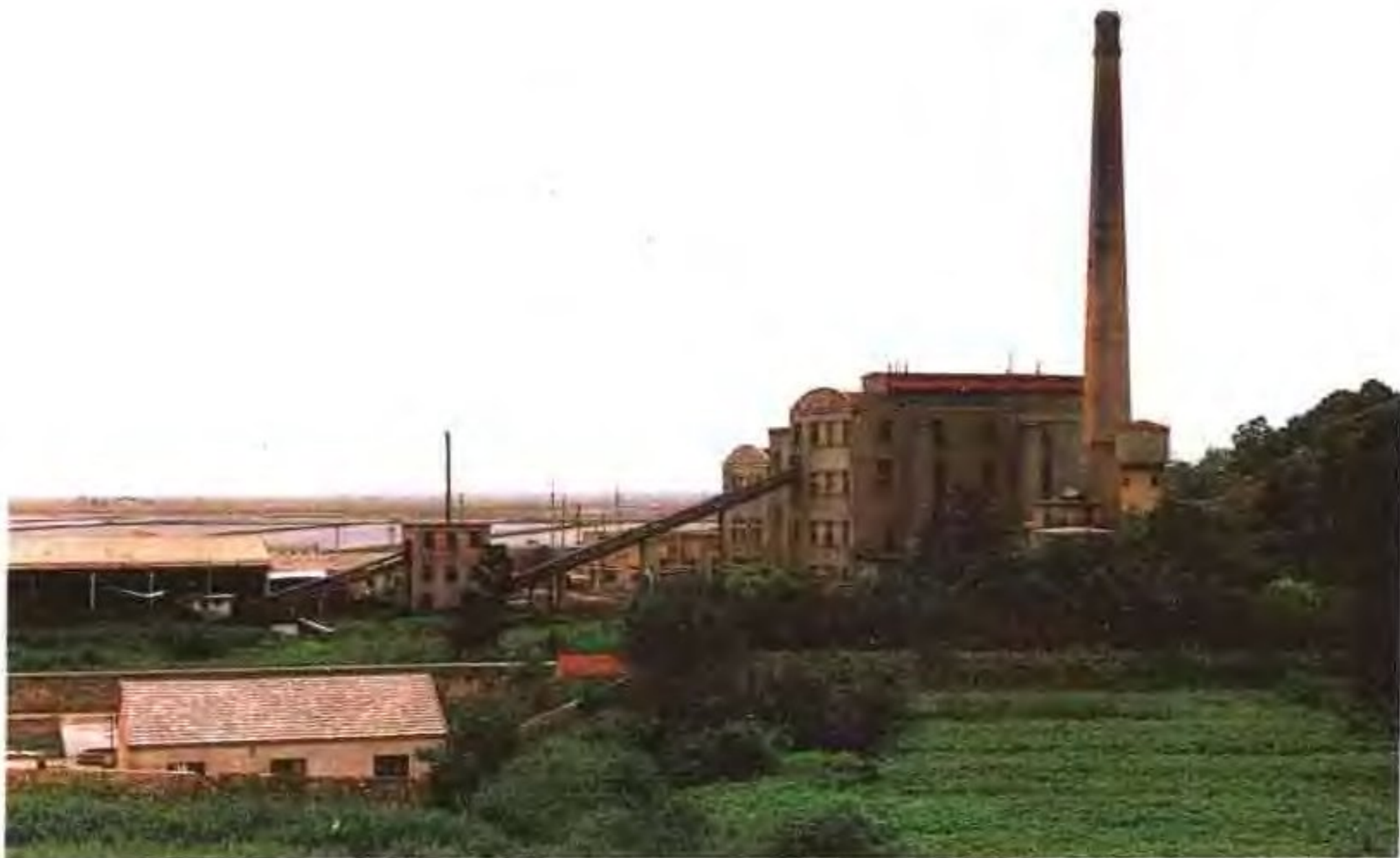
盐业自备电厂——东山电厂