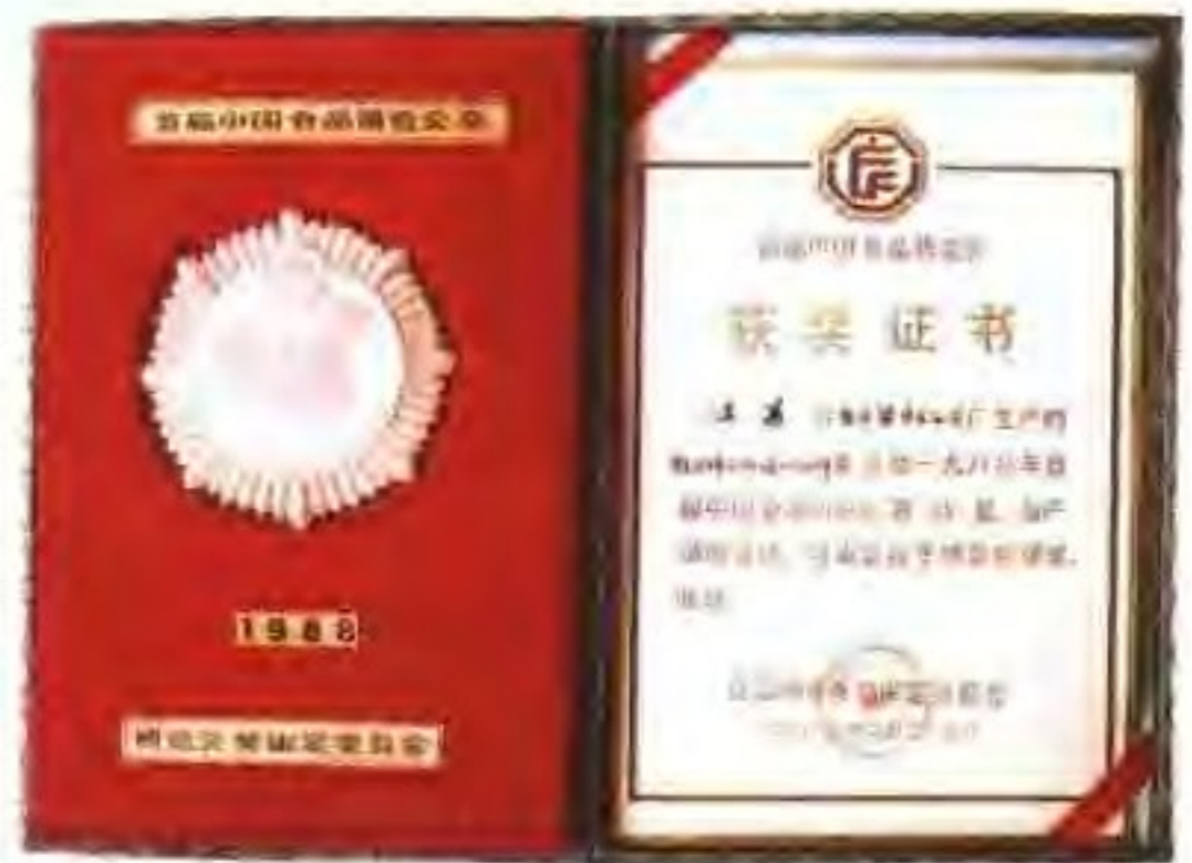
魁星牌强化加锌盐获奖证书