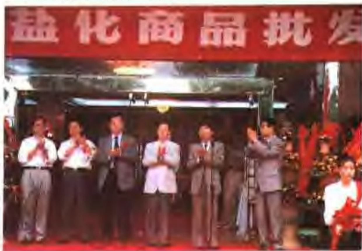
苏州市盐化商品批发交易市场开业