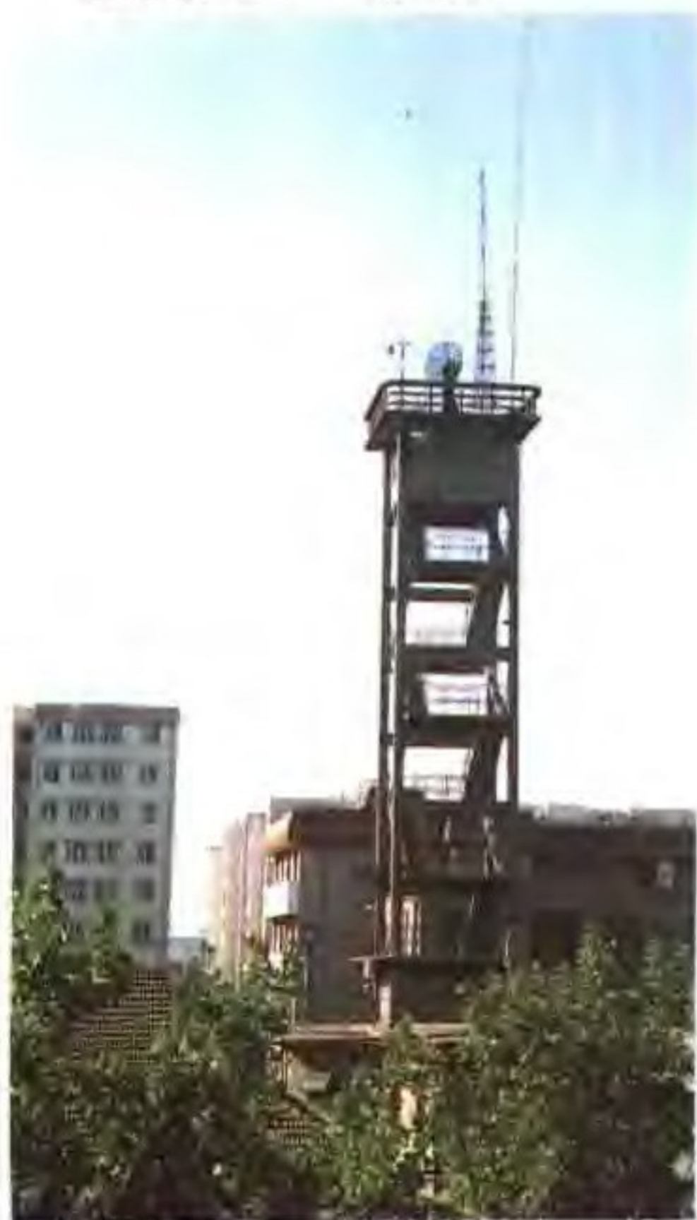
盐业气象台雷达塔