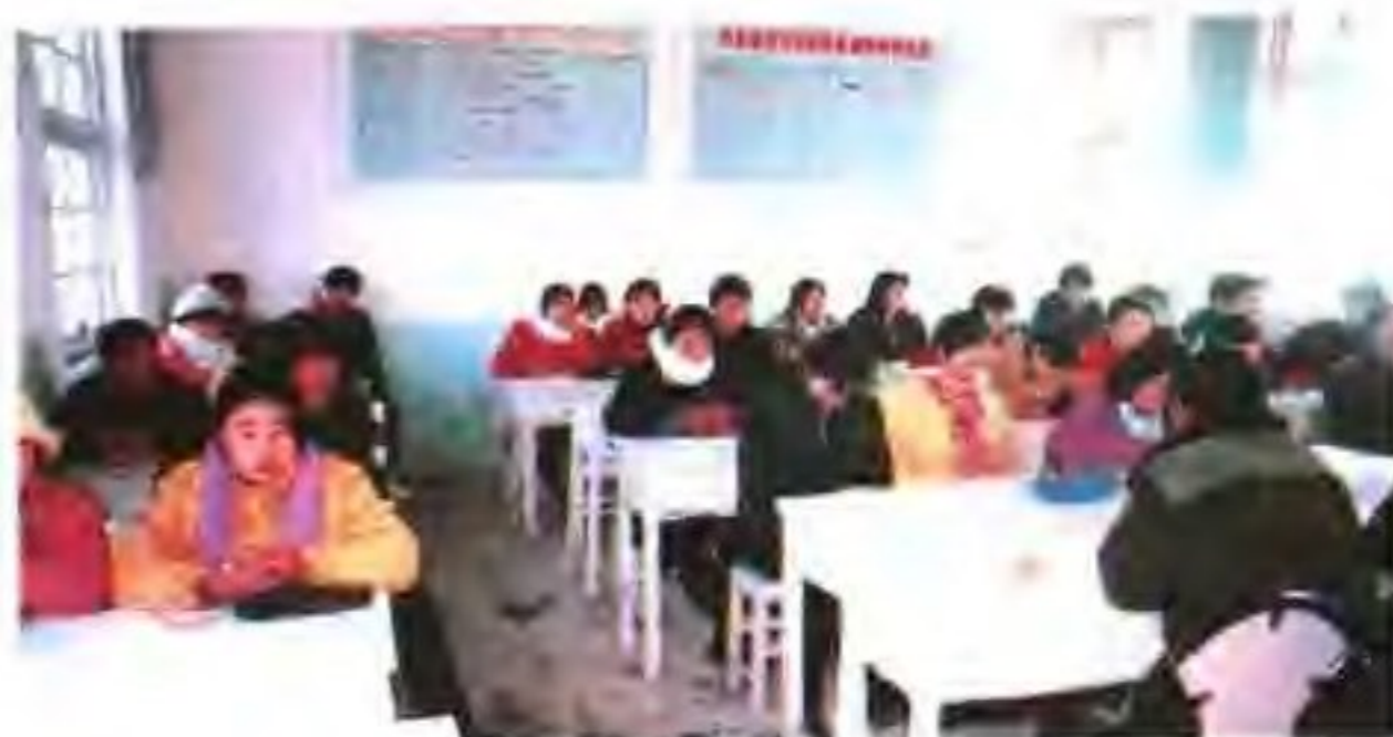
青年工人上技术课