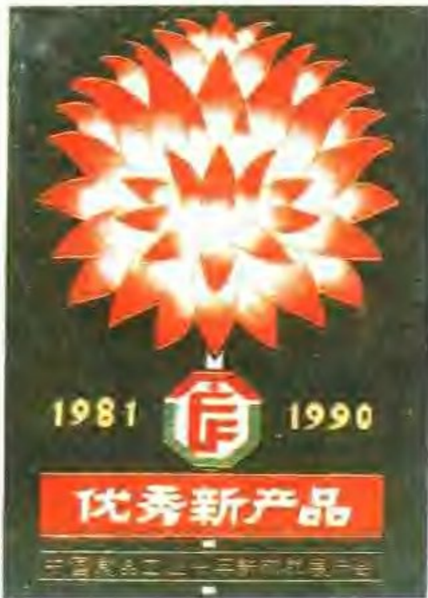
云台粉精盐获优秀新产品奖