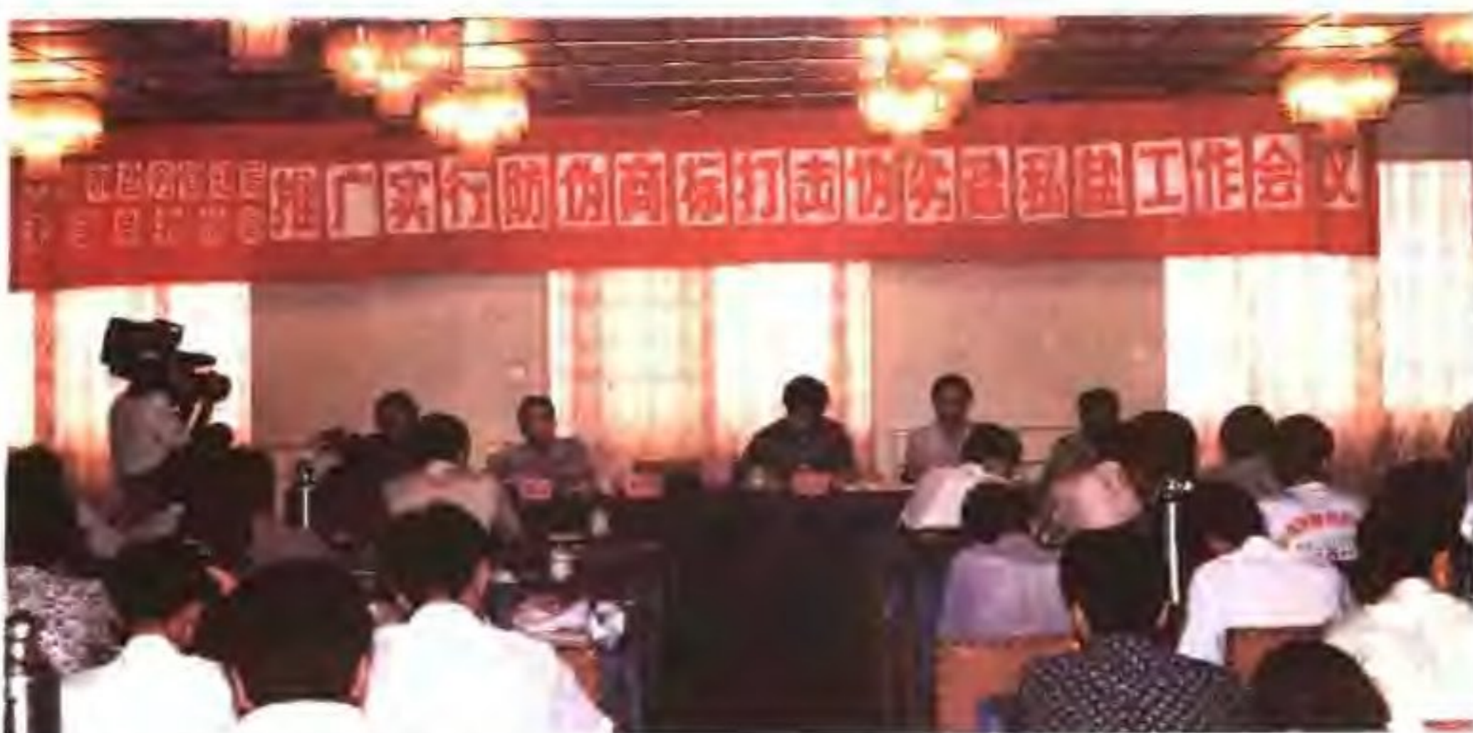
无锡市推广防伪商标打击伪劣私盐