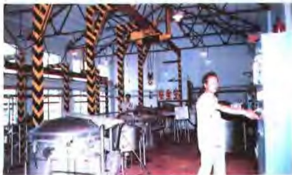
出口低钠盐生产车间