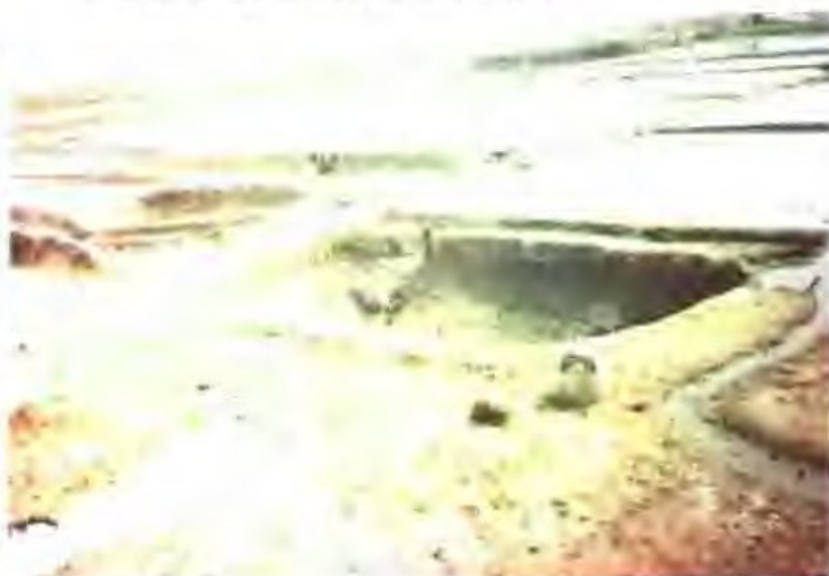
明代盐田遗址(保留在赣榆县)