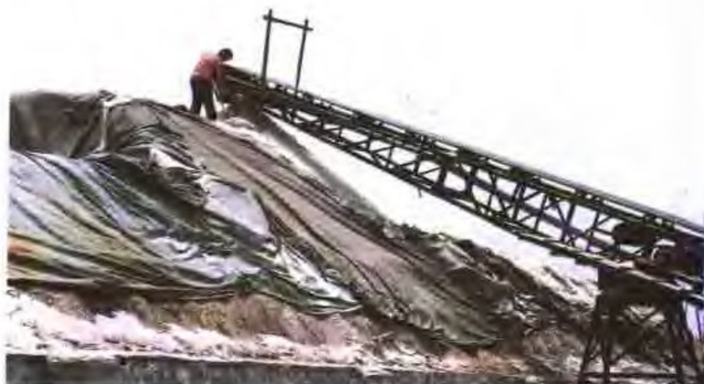
皮带运输机运盐上大廩