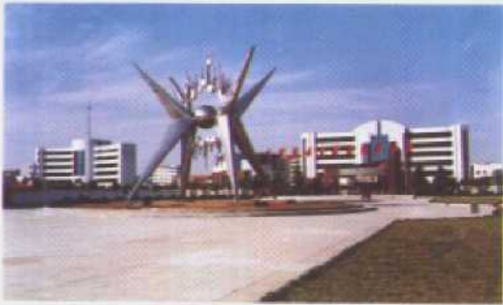
飞向未来——仙桃市政府广场雕塑