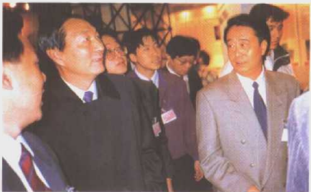
国务院副总理朱镕基参观仙桃工业品展览馆