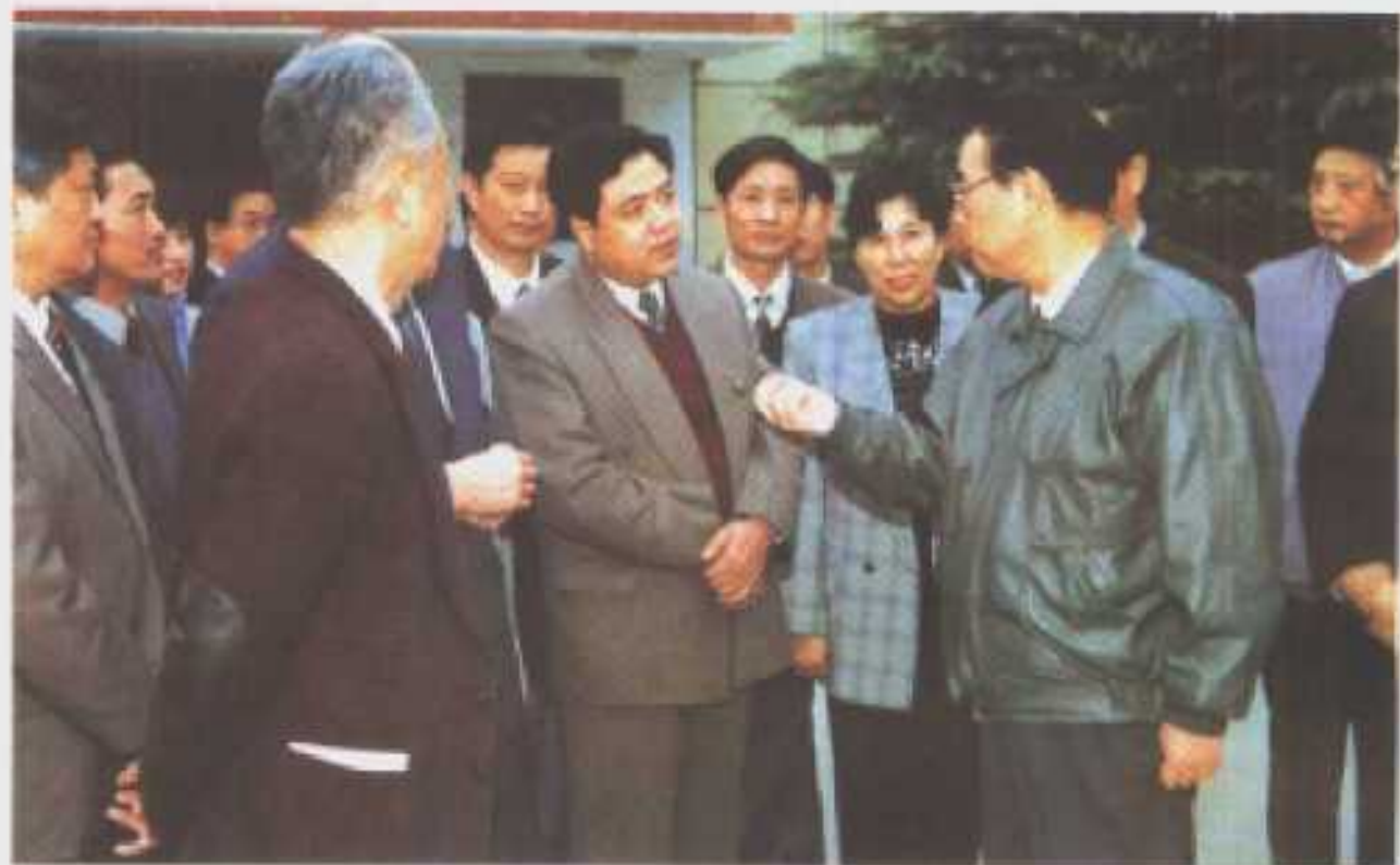
1995年11月11日，李鹏总理视察仙桃排湖茶站