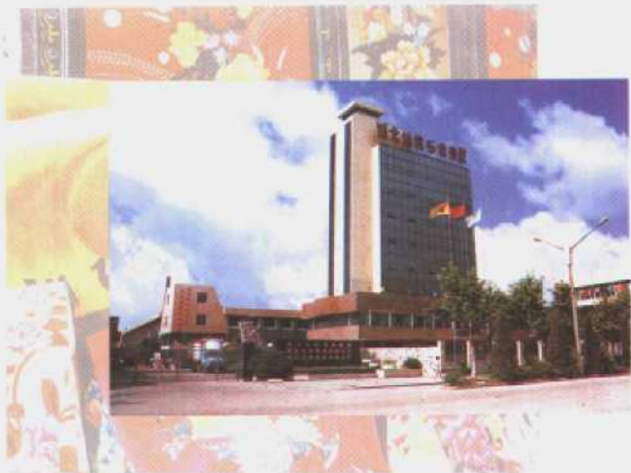
在全国同行业中综合效益名列第一的仙桃毛毯集团公司