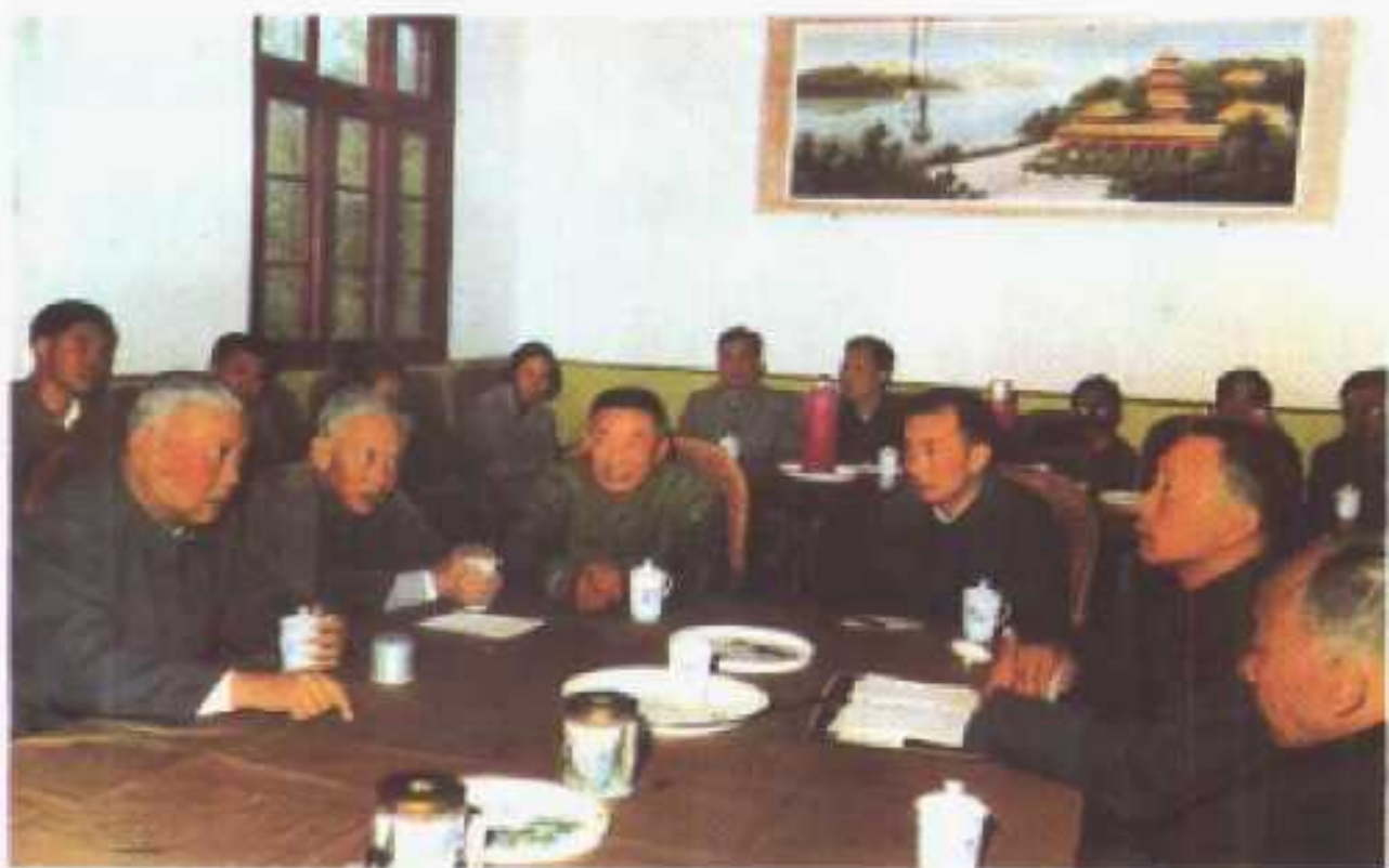
1982年10月8日，中共中央副主席李先念与汤阳县委书记交谈