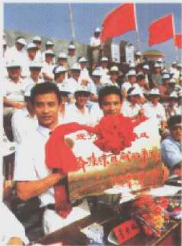
仙桃市委、市政府授予奥运英雄李小双、李大双兄弟“有特殊贡献市民”称号