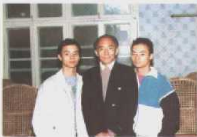
体操世界冠军李小双（右），李大双（左）与启蒙教练丁霞鹤合影