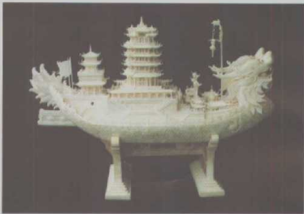
仙桃贝雕“玉龙青鹤舟”被北京人民大会堂收藏（仙桃市贝雕工艺厂）