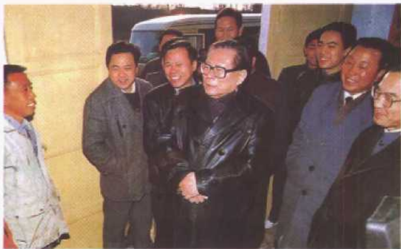
1992年12月23日，江泽民总书记视察仙桃农村