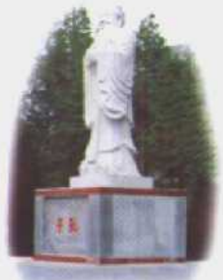
孔子塑像——沔城文圣公园