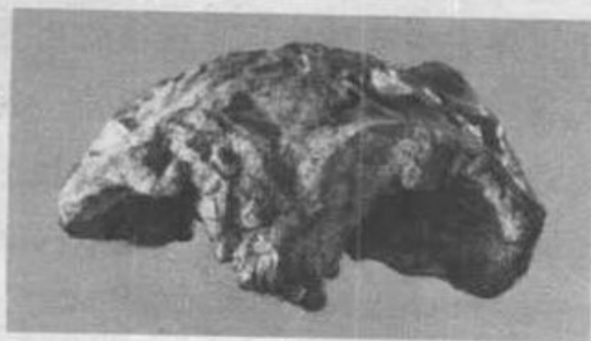
蓝田县公王岭人 头盖骨化石 一九六四年陕西 蓝田县公王岭出土