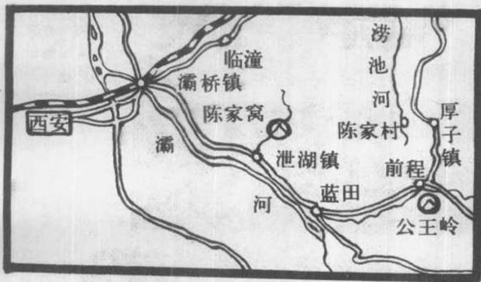
蓝田县公王岭和陈家窝位置图