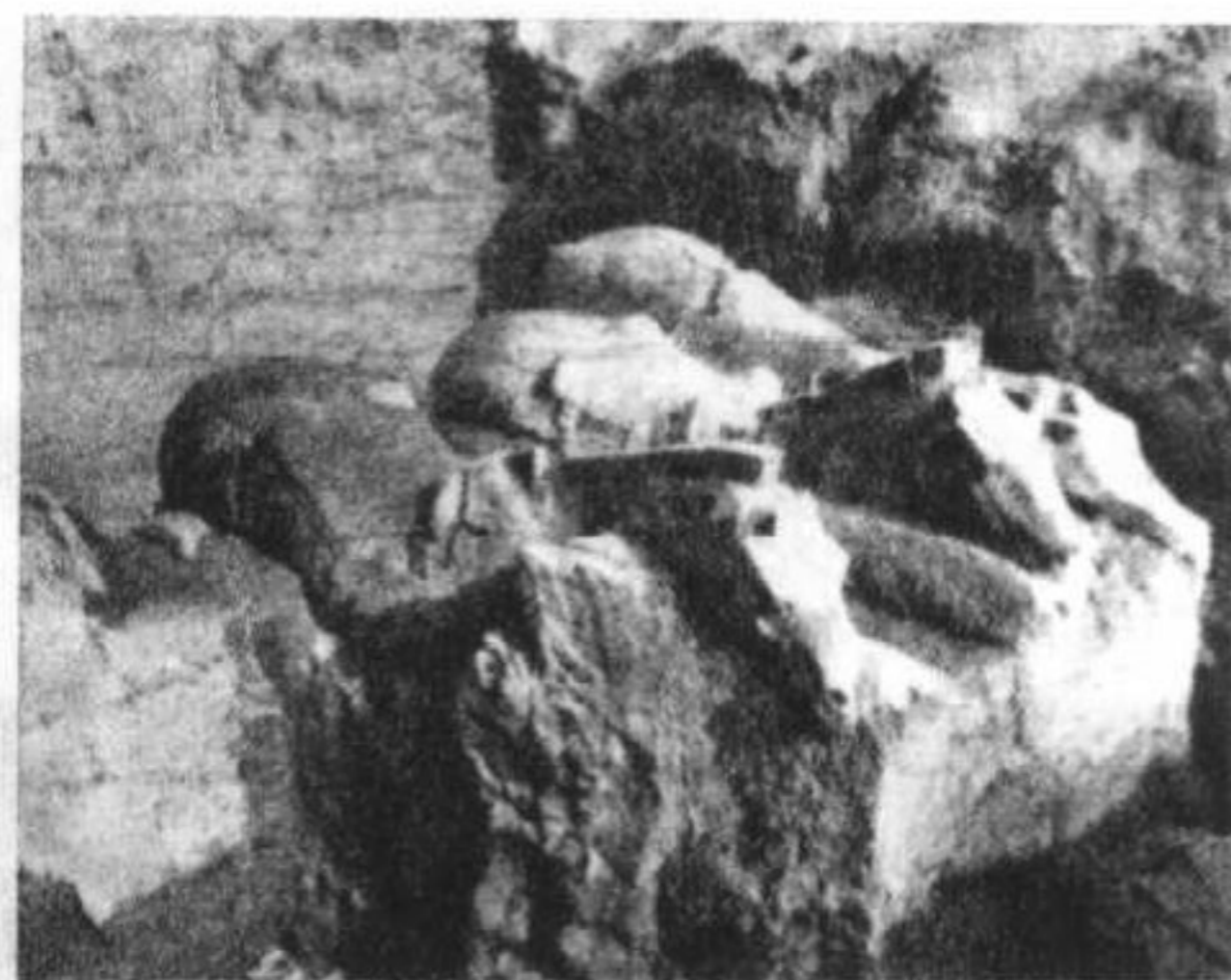
1977年2号坑鞍马出土情况