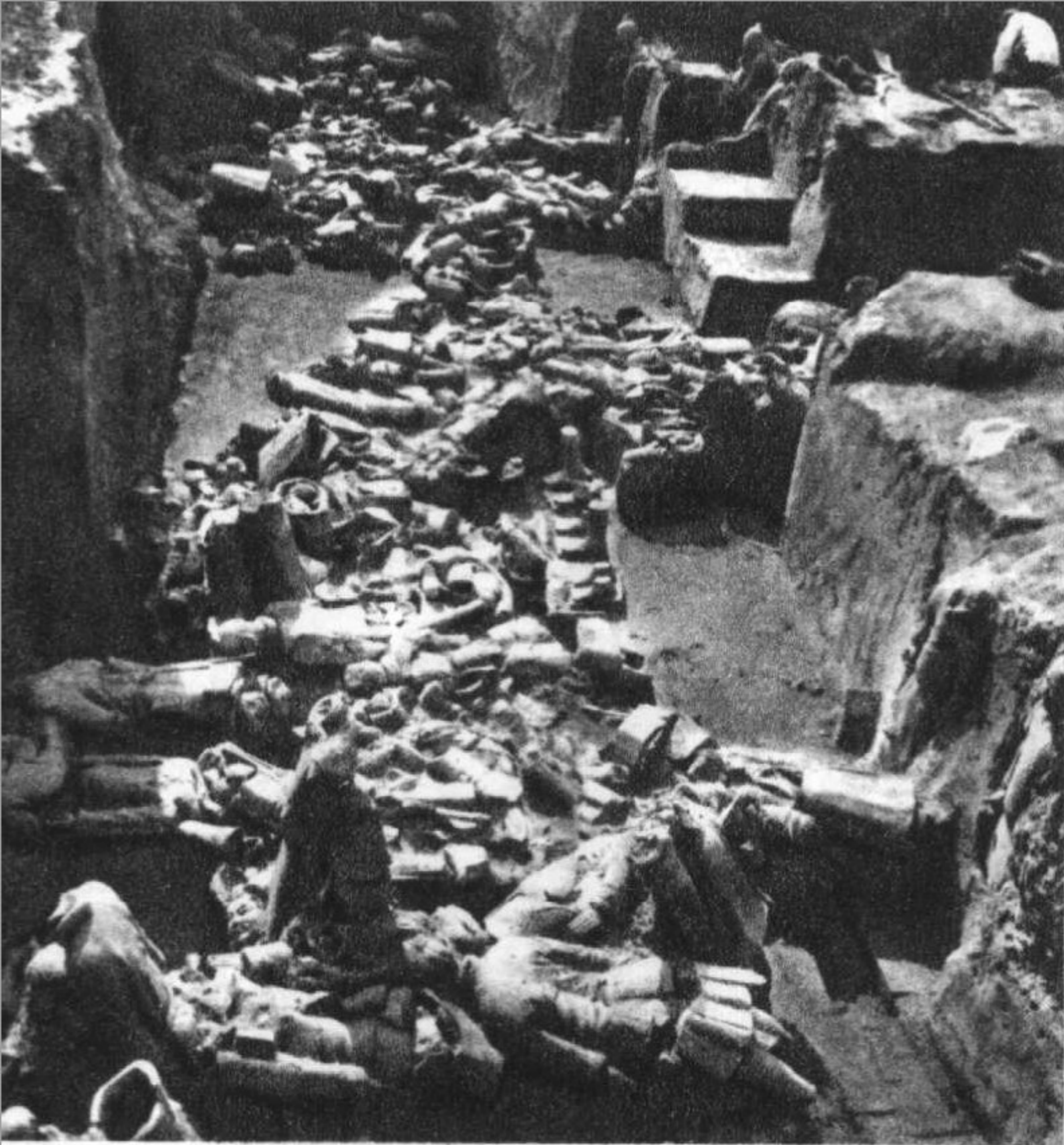
1974年1号坑陶俑出土情况