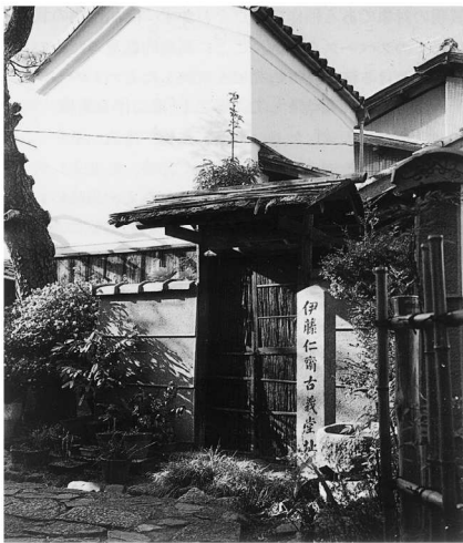
图6 伊藤仁斋的古义堂

到了江户时代,日本学术界出现了复古思潮。世称“古学先生”的伊藤仁斋(1627~1705),指责“体用理气”等皆为佛老之浮辞,非圣人之教,竭力推崇《论语》、《孟子》等儒学典籍;而且在医学上也积极主张复古。其后荻生徂徕(1666~1728)亦以修古文辞为阶梯,锐意复兴圣人之学。从而使得复古之学成为德川时代一大学派,其最盛期为18世纪上半叶。此间,一些医家也认为,金元李朱医学与朱子儒学有着千丝万缕的联系,唯重思辨而无实证;古朴的张仲景医学是从纯粹的观察和实践中总结出来的,是以方、证对应的形式写成的,而且可以实证于临床。持这种观念的医家,逐渐形成了汉方医学的“古方派”。