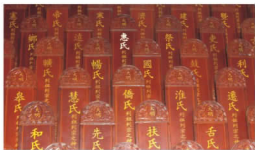
山西省洪洞县大槐树祭祖堂内姓氏神位