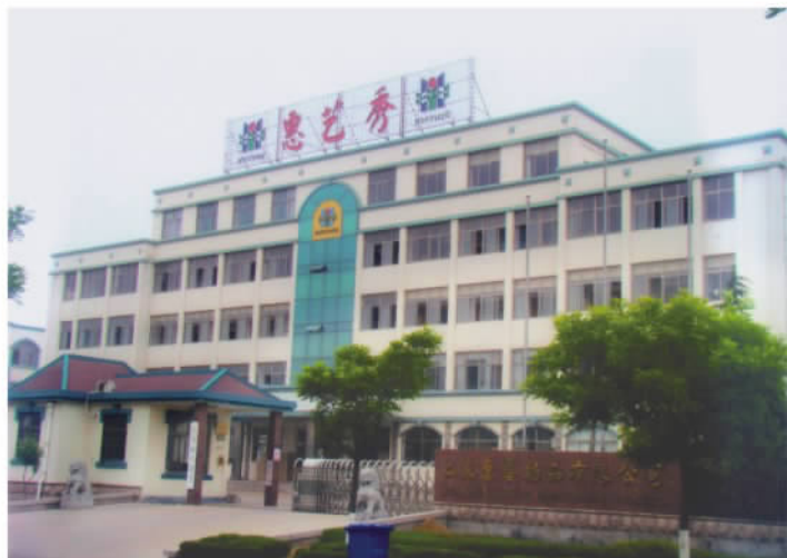
山东日照惠艺绣品有限公司