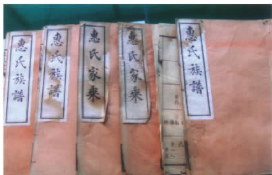
江苏宜兴惠氏宗谱