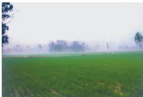
河南洛阳金村周惠王墓地遗址