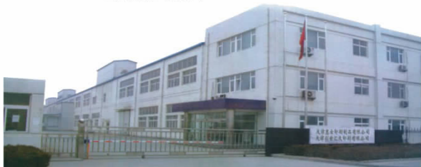
天津惠士印刷制品有限公司