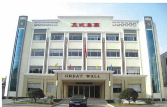
山东临沂长城集团