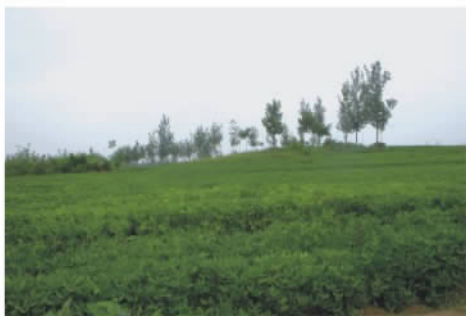
河南中牟县魏惠王墓遗址