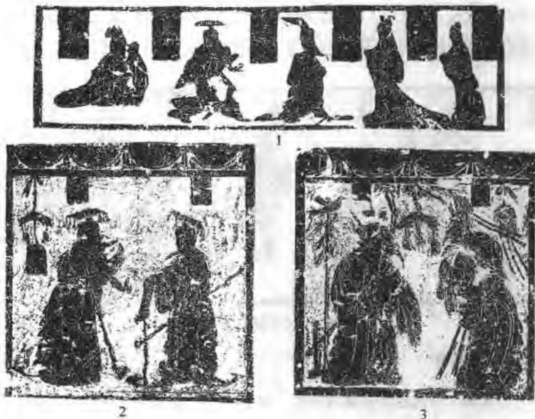
1. 莒县石阙“禹妻”、“夏禹”、“汤王”、“汤妃” 2、3. 沂南汉墓中室帝王、孔子见老子

所表现的空间和时间也进一步扩展。其主要成分包括辟邪、祥瑞、历史人物和故事、升仙和地下生活场景等等。