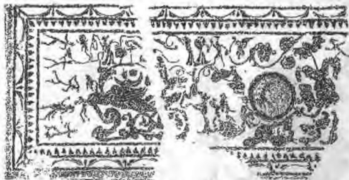
安丘董家庄汉墓前室封顶石中段