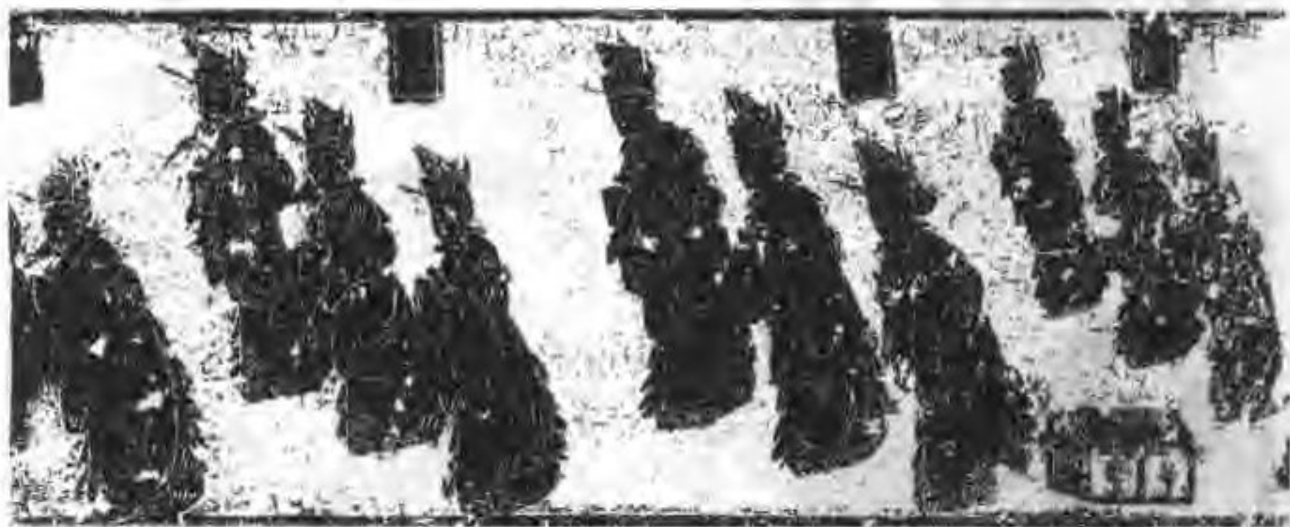
沂南汉墓前室东壁横额局部画像

也安排了门吏迎归、武库辟邪等图像，但这里的辟邪较之墓门辟邪更有人间气息，因为这里是人活动的场所。像沂南汉墓这样前中后室的墓葬形制，其实就是在前堂后室墓葬形制之前又套加了一个前室而已。有的墓葬在前室西侧放置一个祭台，则清楚地表明了前室的祭祀场所性质。安丘董家庄汉墓前室车马送行和迎归图像的设置，是墓门迎归的重复或者加强。(图 65)