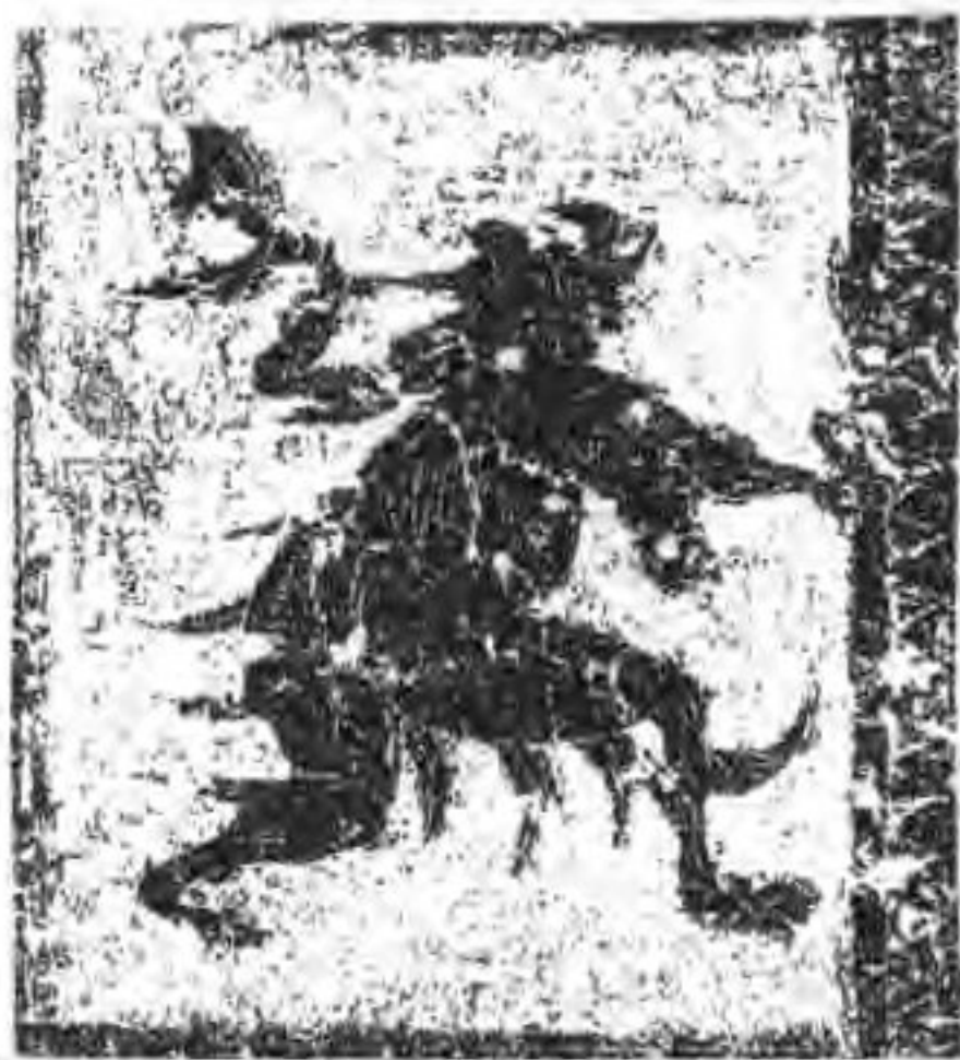
沂南汉墓后室北侧隔墙西面画像

墓底是墓室的最后部位，一般都是墓室后室的后壁，这里和墓门一样，虽然位于墓室的最后端，但也是与外界接触最近的地方，最容易遭受侵害的地方。而且，后室是墓主棺椁停放处，也是最需要安全防护的所在。因此，辟邪题材自然而然成为最重要的内容。安丘董家庄后室不但专门安排了一根辟邪的立柱，而且在东西两后室的北壁分别安排了铺首衔环、食蛇神怪、虎食鬼魅等图像。沂南汉墓则安排了手执斧钺凶猛砍杀的“方相”类神怪，以此来完成辟邪的职责。(图 64)