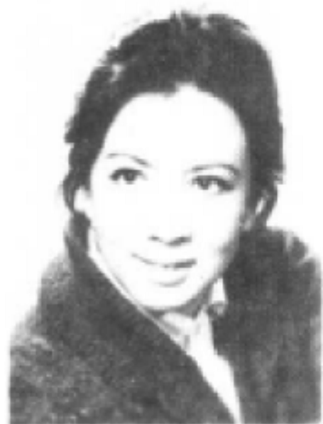
▼《青春之歌》中林道静 (谢芳饰)