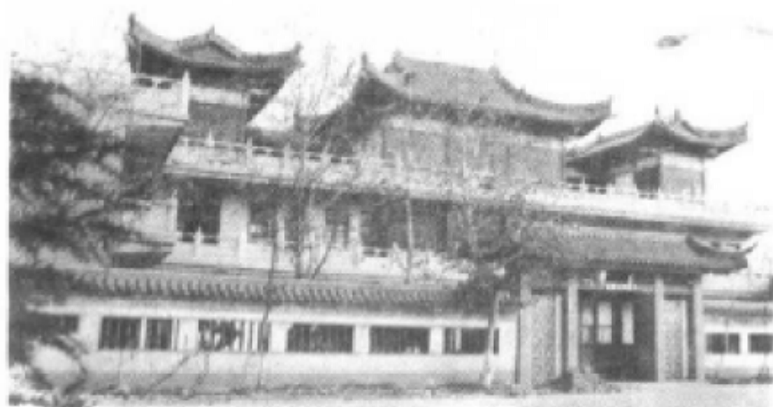
黄陂县园林建筑公司办公楼