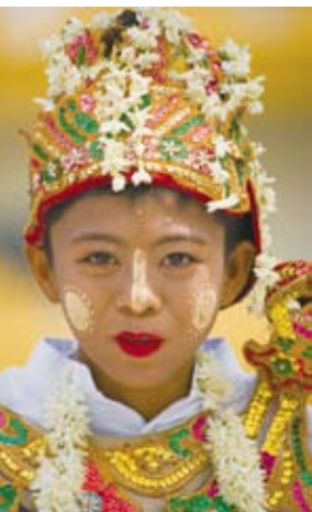
LOOK 身着盛装的缅甸少女（上）