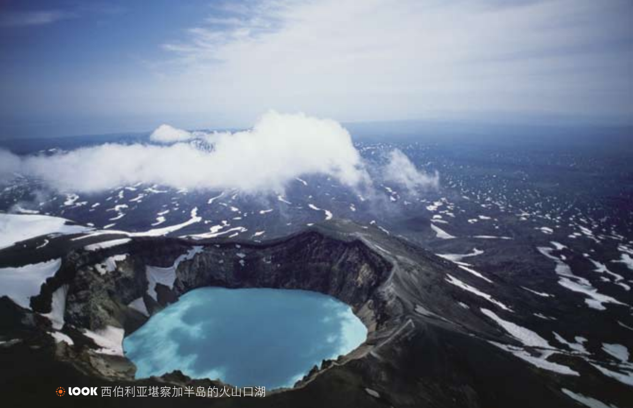
LOOK 西伯利亚堪察加半岛的火山口湖