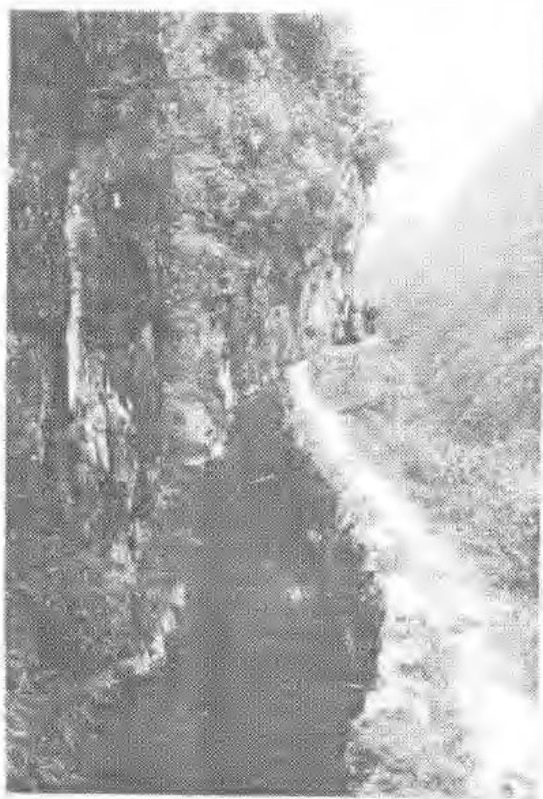
五龙冲引水工程于一九五九年竣工通水，渠道全长10598米。