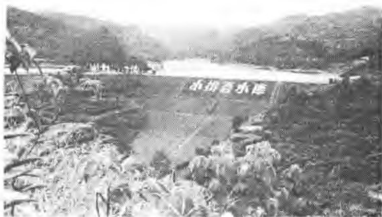
小排吾水库于1969年冬修成，坝高38米，蓄水1231万立方米。