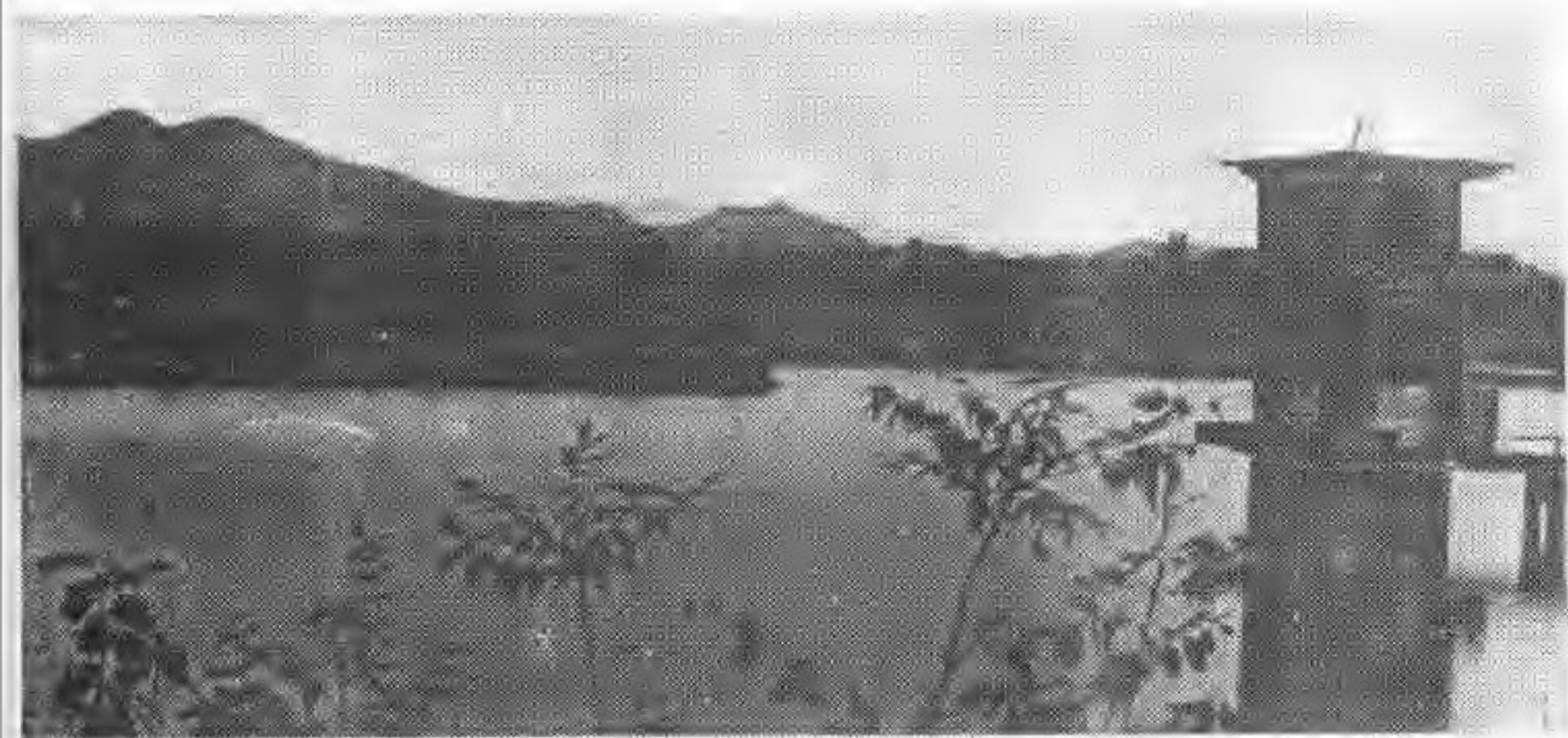
兄弟河水库于 1988 年 12 月竣工,坝高 70 米,蓄水 7880 万立方米。