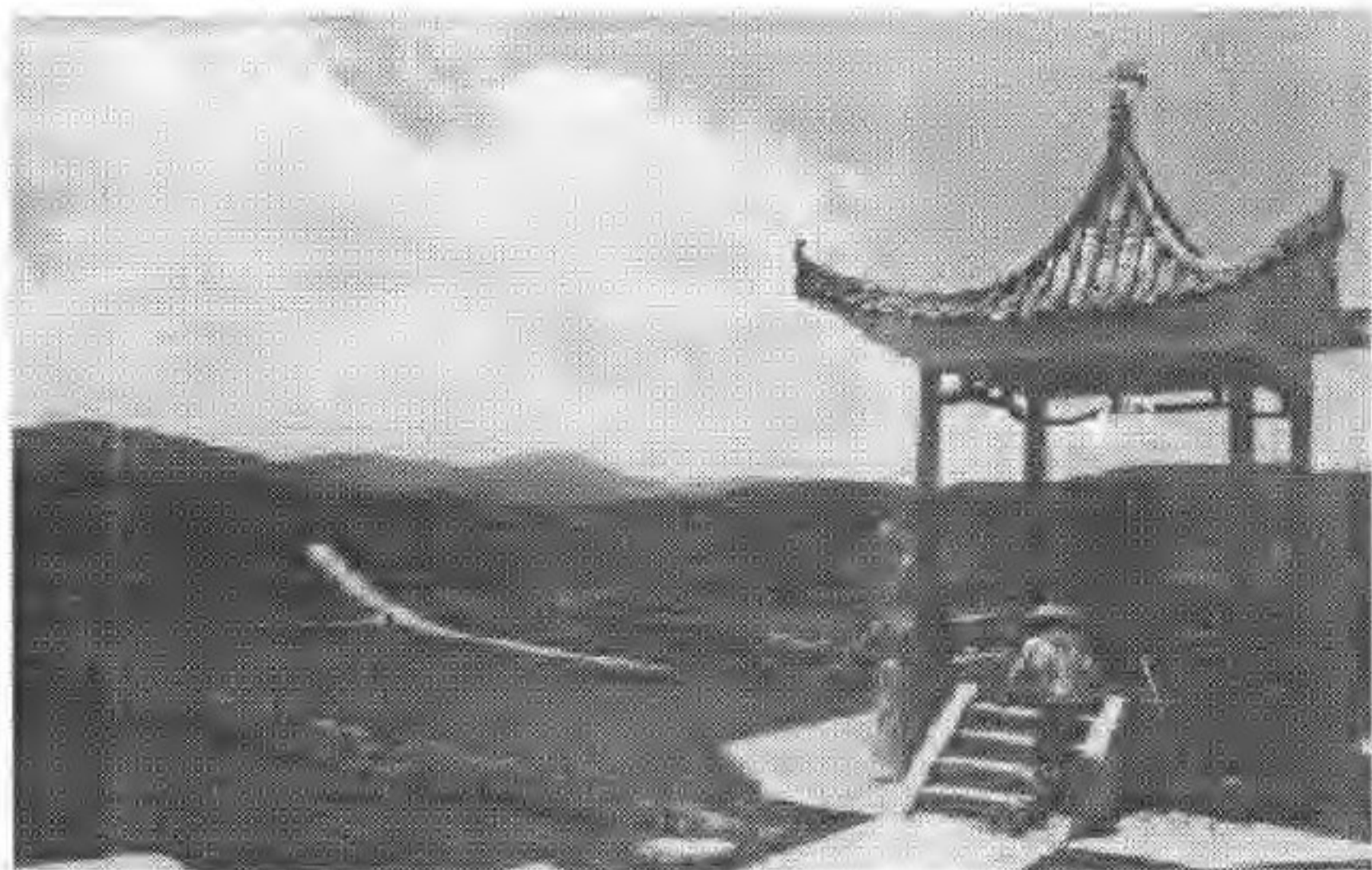
国际粮援工程于 1996 年 11 月竣工,项目区范围为:道二、龙潭、雅桥、排吾和猫儿等五个乡镇。