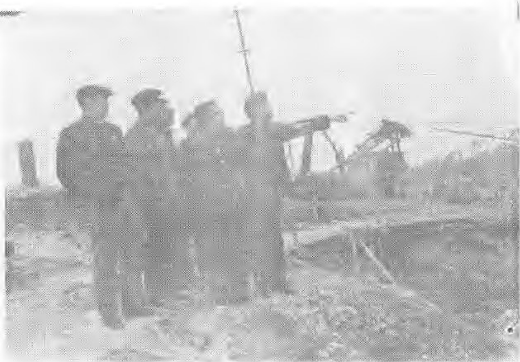
1985年12月28日原中共湖南省委书记，现任中共湖南省委 书记杨正午同志视察兄弟河水电站工程。