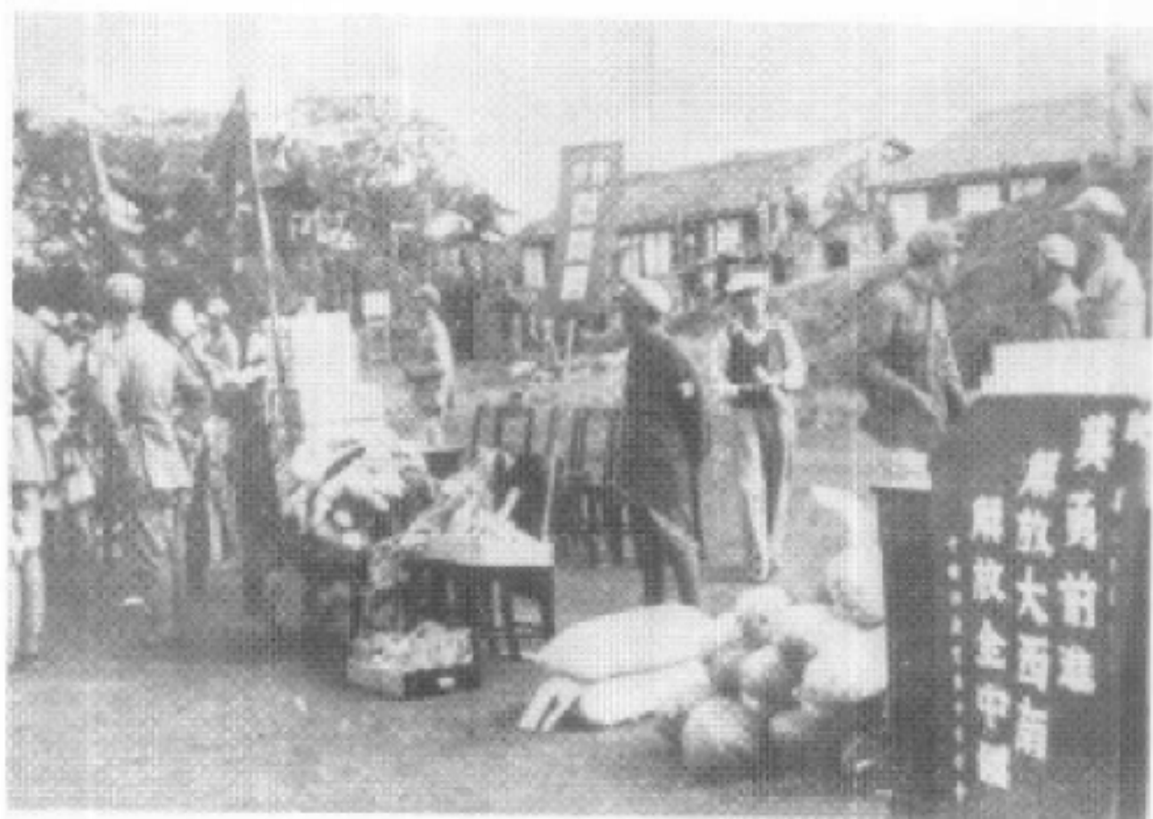
长沙市各界慰问第二野战军过湘进军大西南。图右为中共长沙市委所献锦旗。