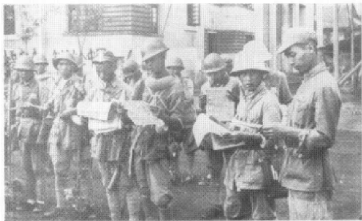
入城解放军指战员阅读各界慰问信。