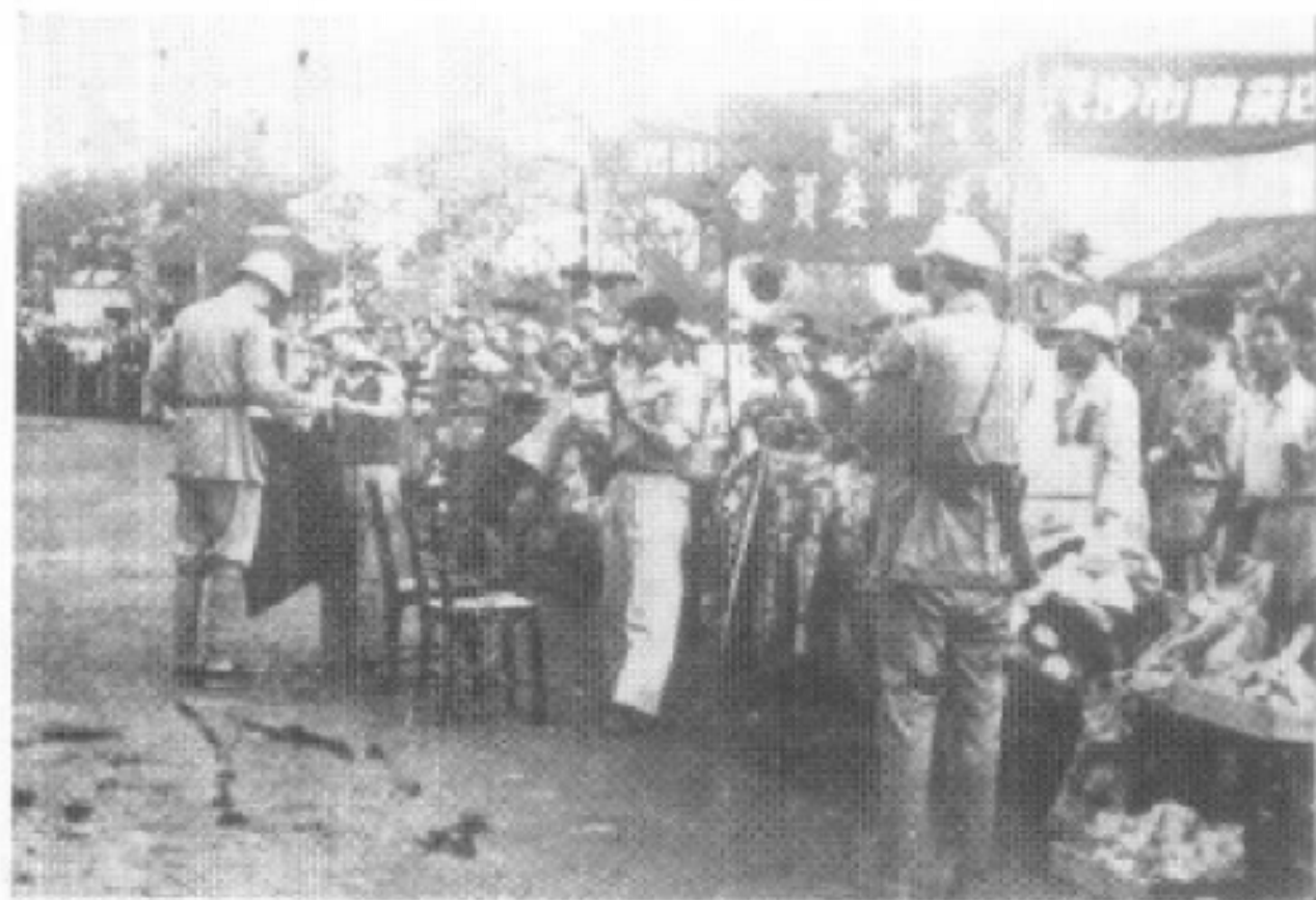
长沙市各界慰问二野过湘委员会代表向指战员献旗和赠送慰问品。