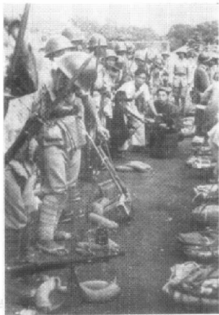
长沙解放时，群众热烈欢迎解放军第四野战军十二兵团先头部队入城。这是沿途所设茶水站。