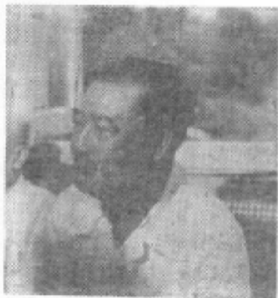
湖南省政协主席程星龄同志在李维汉同志诞辰九十周年座谈会上发言。