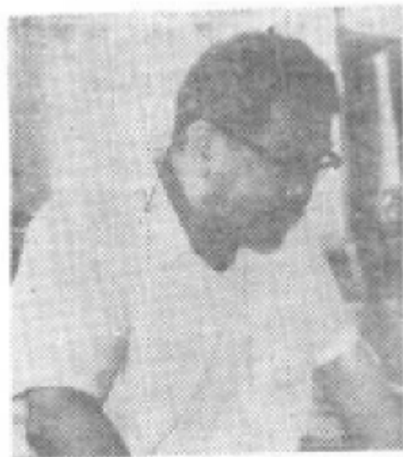
中共湖南省委书记毛致用同志在李维汉同志诞辰九十周年座谈会上发言。