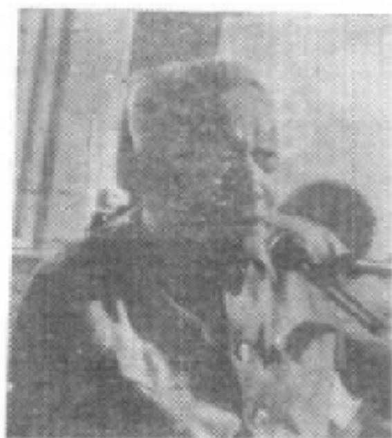
座谈会由湖南省政协副主席、中共湖南省委统战部部长佟英主持。