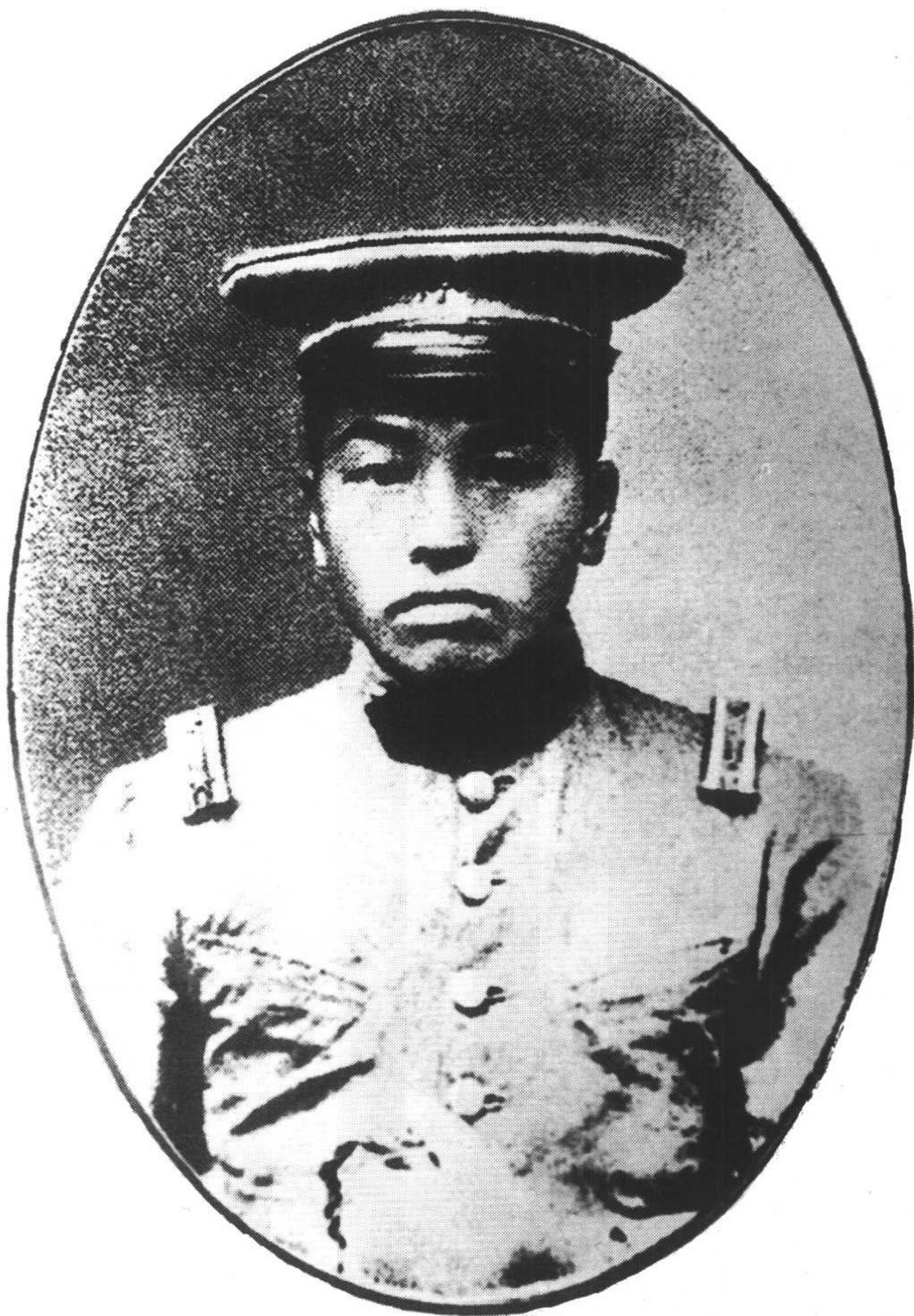
1 1923年，彭德怀在湖南陆军讲武堂学习，时年25岁