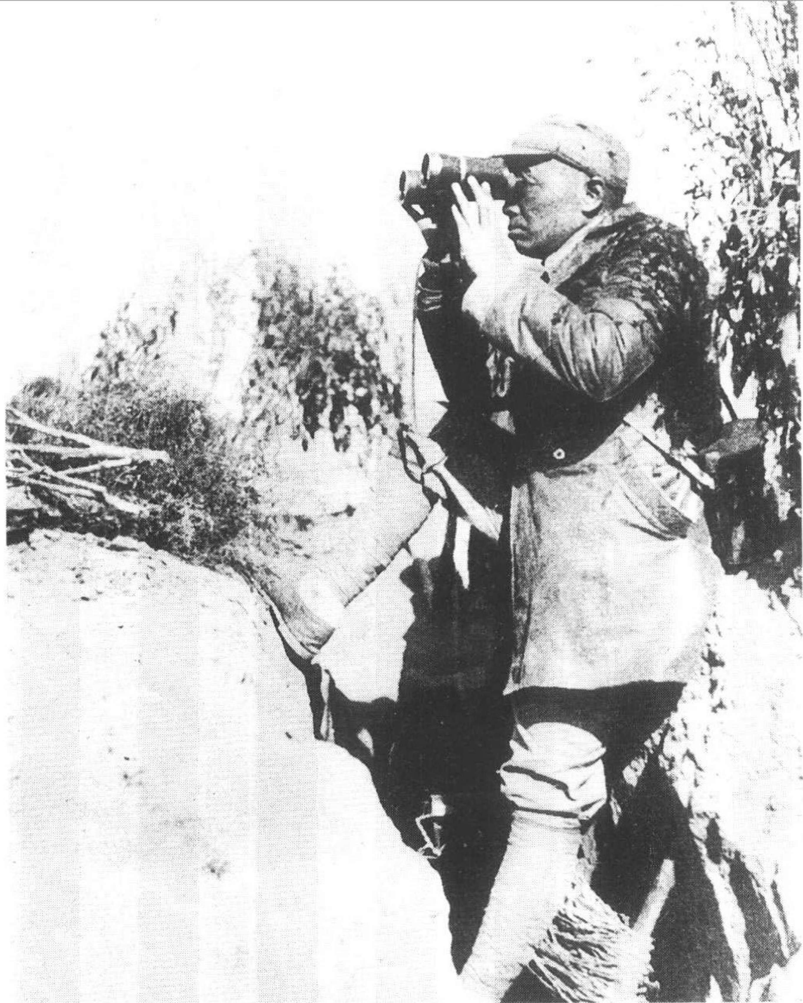
8 1940年“百团大战”时，彭德怀在山西武乡县关家垴前线哨所，此处距日军阵地500米