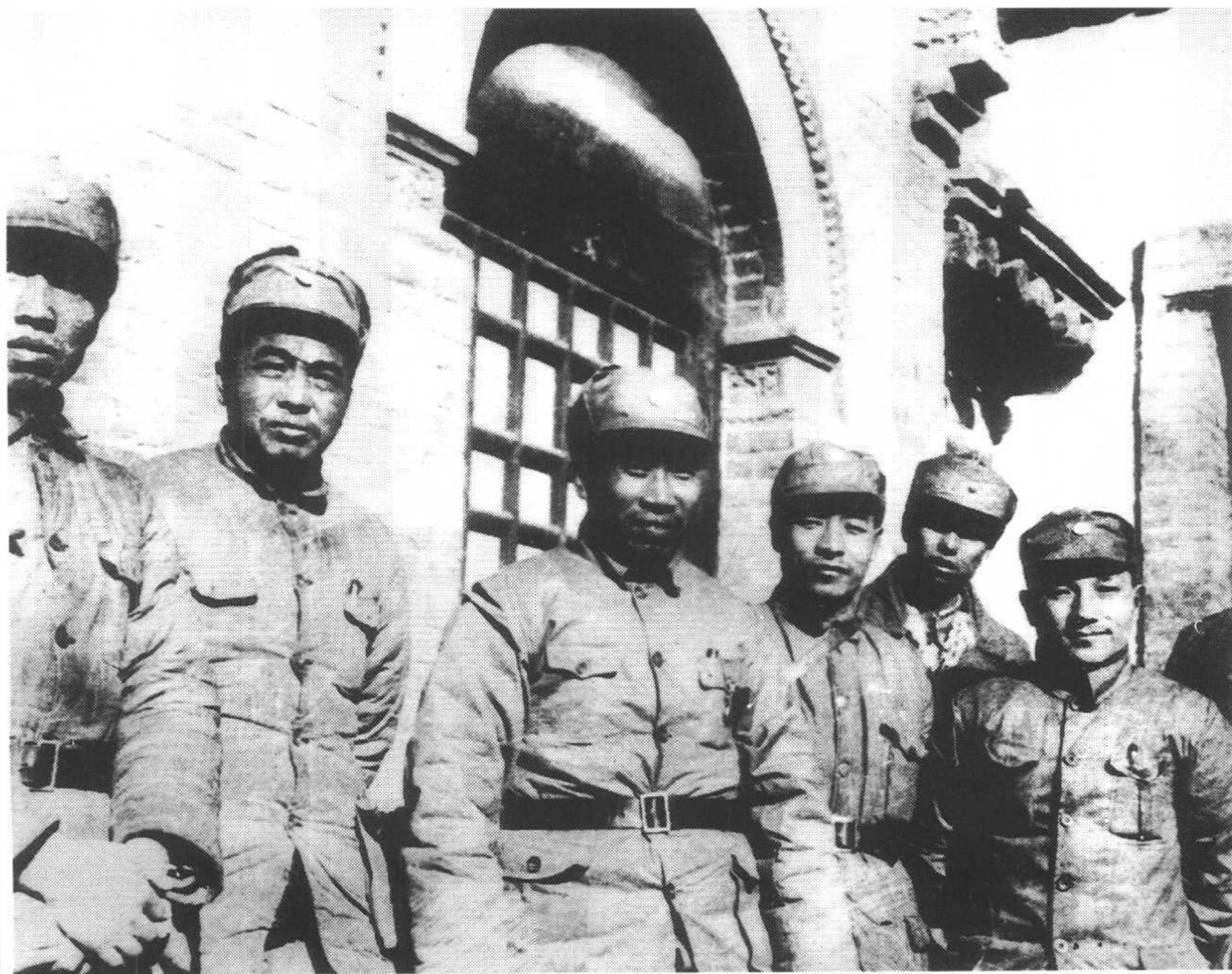
5 彭德怀与朱德、邓小平、彭雪枫、肖克等在山西武乡县王家峪八路军总部