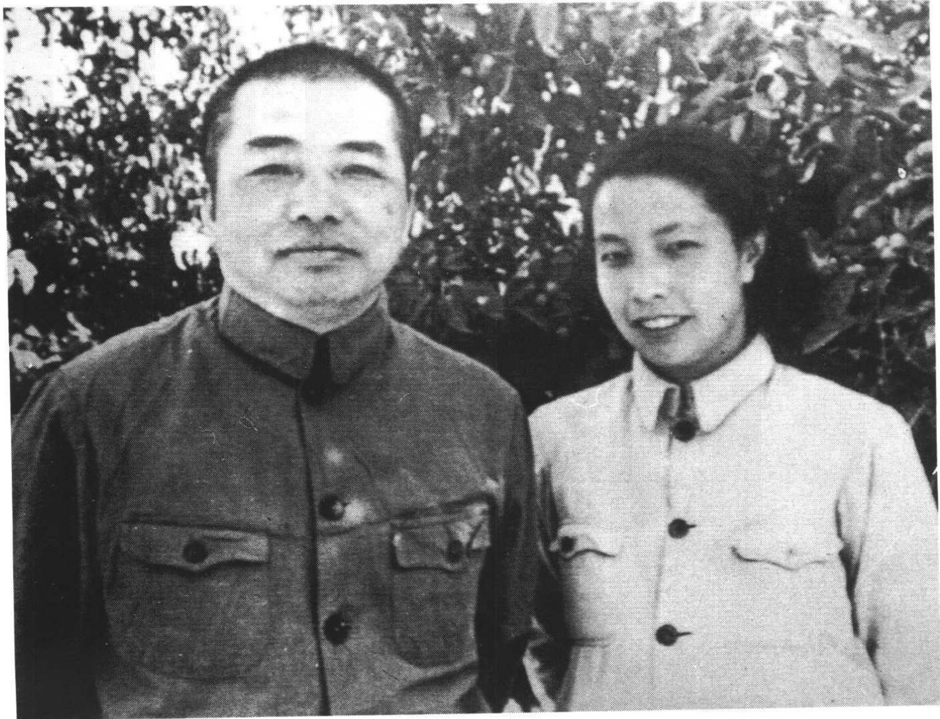
10 1946年夏，彭德怀和夫人浦安修在延安枣园