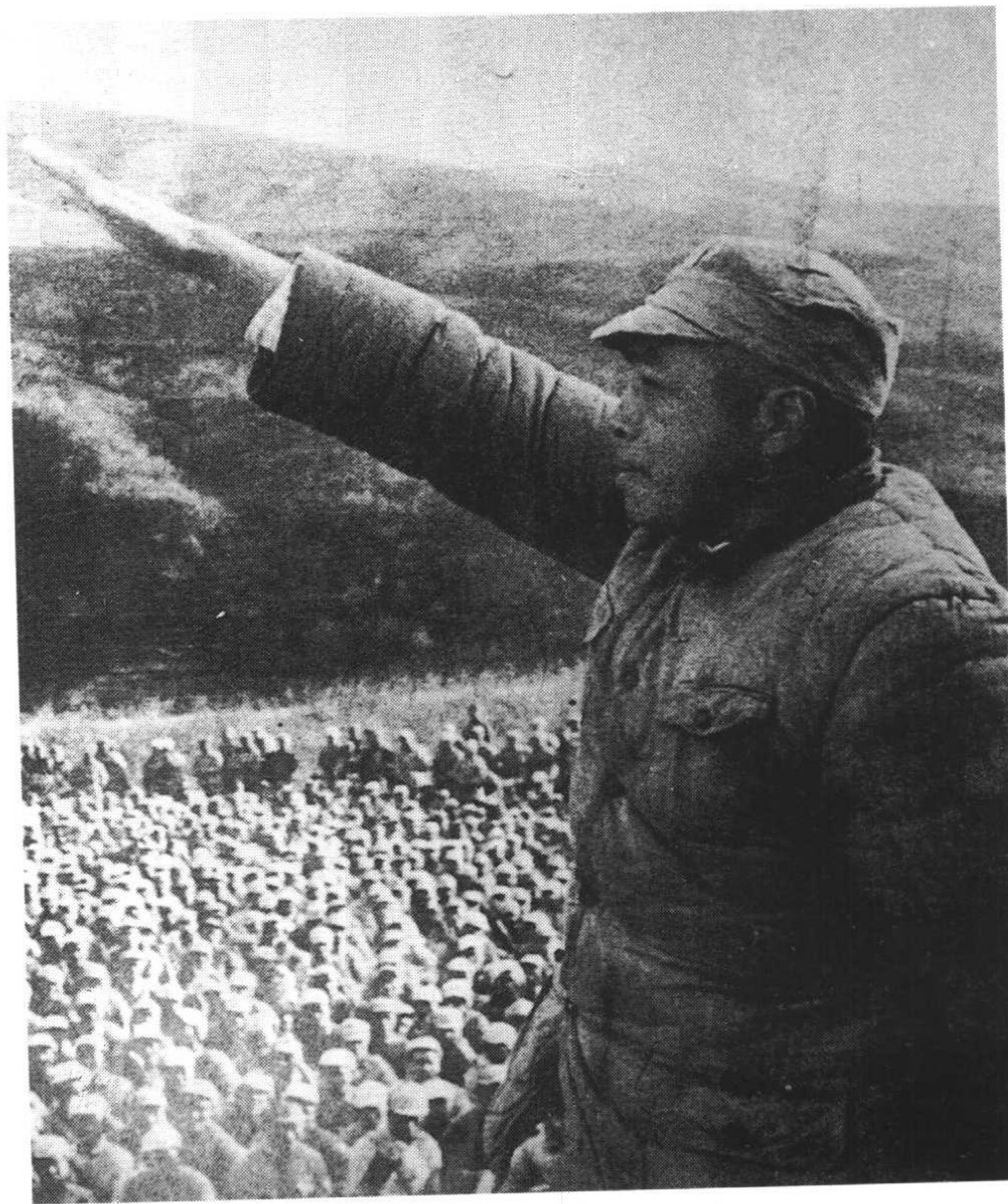
11 1947年3月，彭德怀在延安各界保卫延安群众大会上