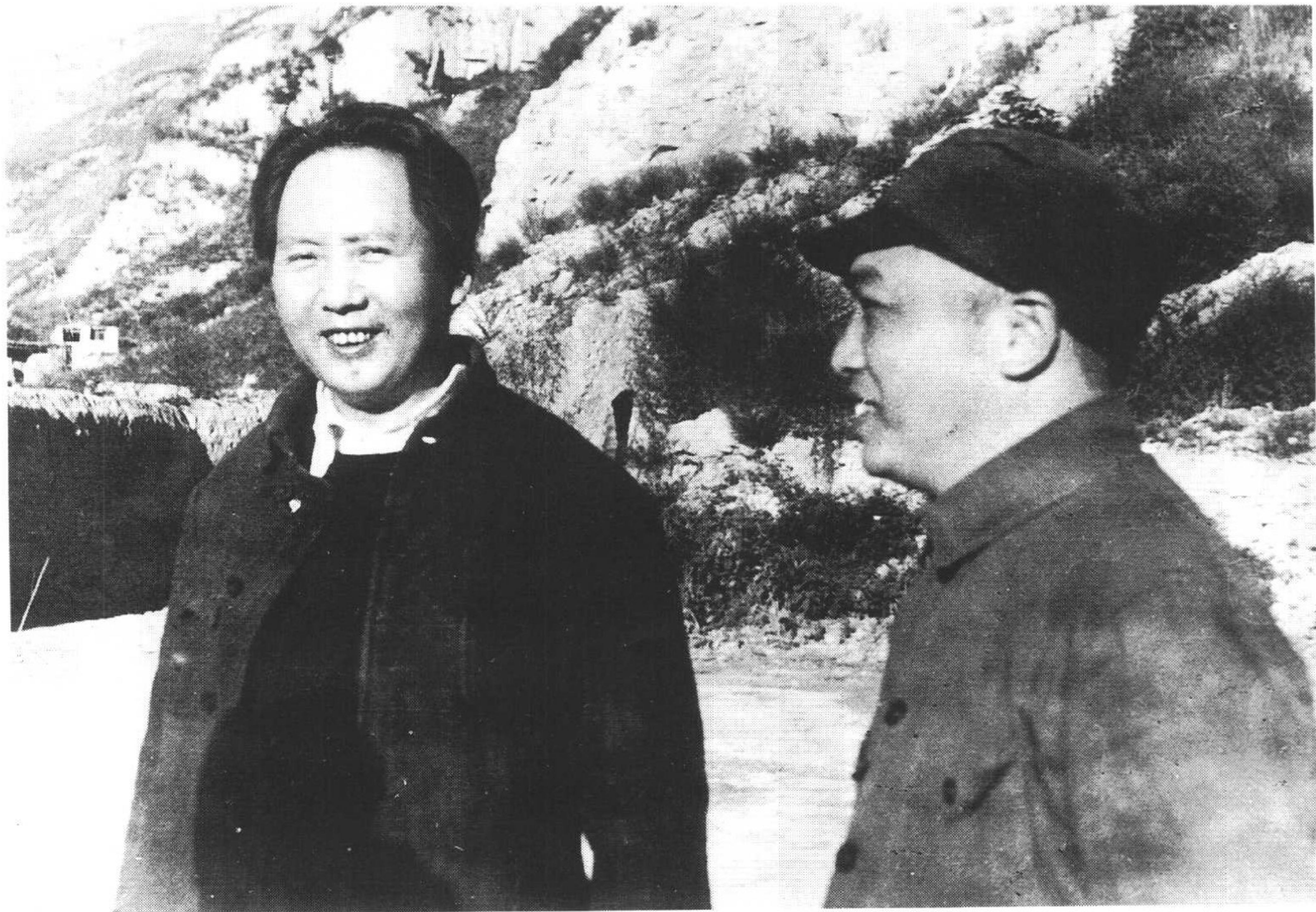
6 彭德怀与毛泽东在延安