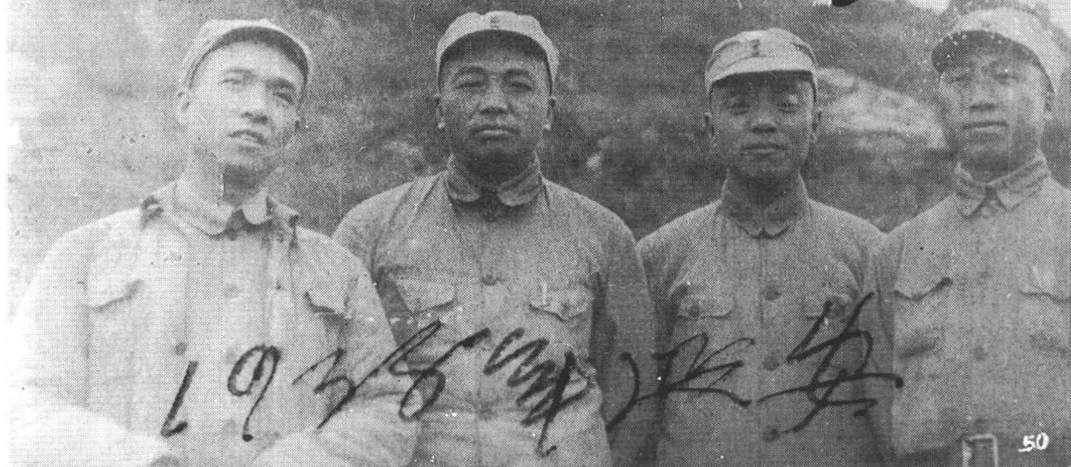
4 红三军团总指挥和三位政治委员(从左至右: 李富春、彭德怀、杨尚昆、滕代远)