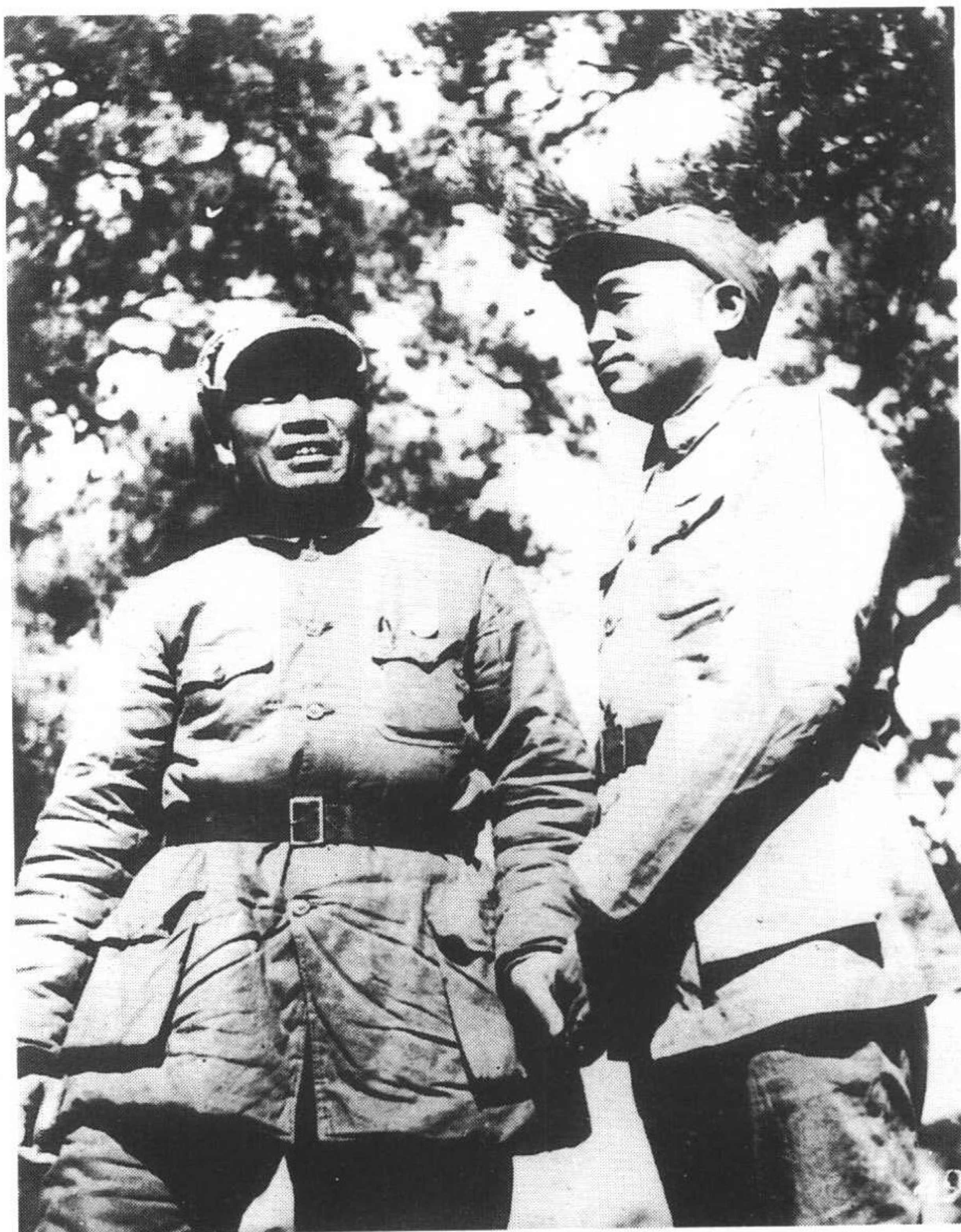
7 1939年，彭德怀和朱德在山西武乡县