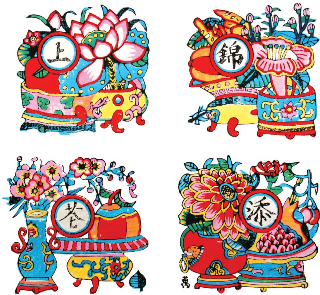
锦上添花 窗花年画

武强年画是一种在田野里诞生、在乡土中成长起来的艺术，是一种纯粹的农民艺术。它凝聚着武强劳动人民特有的思想情感和审美观念，体现的是武强当地的地域文化及风土民情，因此有着独特的艺术魅力。具体表现为：乡土风情、构图饱满、造型夸张、色彩鲜艳、寓意吉祥五个方面。