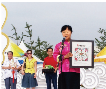
奥运祥云小屋照片