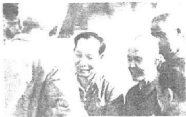
△ 一九八六年五月，与河源县有关同志一起到新丰江库区视察。