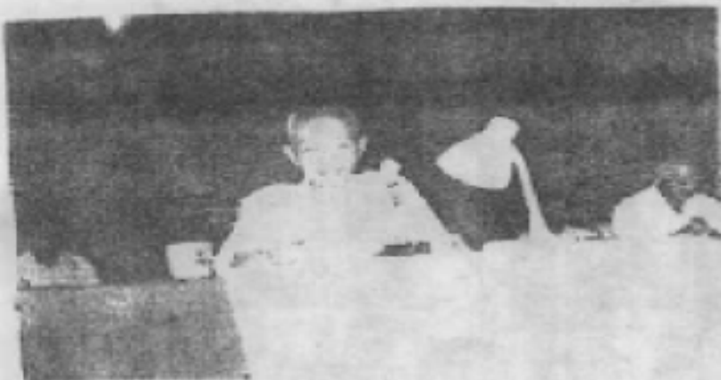
△ 一九八九年九月十九日，华基在“两纵”（广东人民抗日游击队东江纵队和中国人民解放军粤赣湘边纵队）河源市区老战士联谊会成立会上发表讲话。