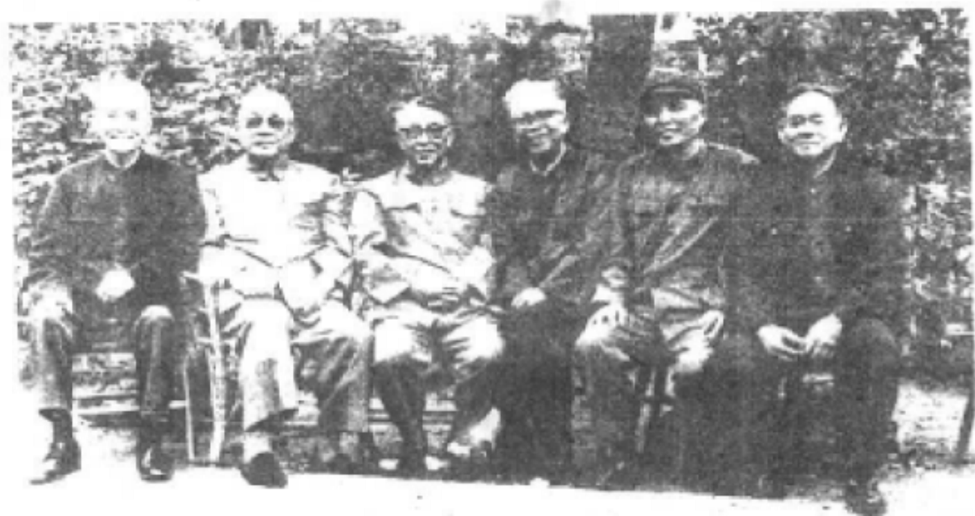
△ 一九八六年夏天摄于省农科院。