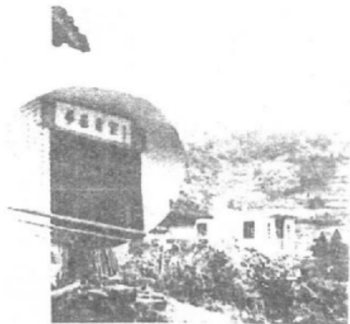
△ 座落在南客寮村中的书室二楼，门楣挂着中顾委委员，原东纵司令员、中央交通部部长曾生写的“华基书室”四个大字。