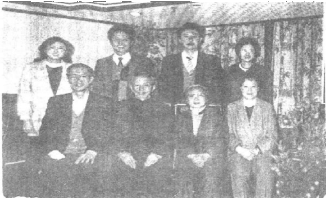
△ 华基与在广州的儿女合影。