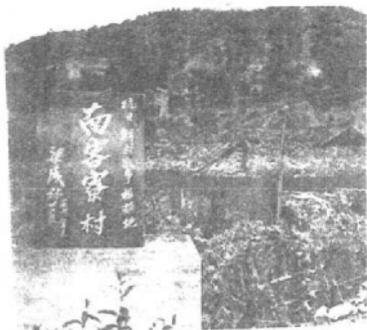
△ 由原东江特委书记、广东省政协主席梁威林亲笔题写的“抗日、解放战争根据地南客寮村”石碑，高高立在村中。