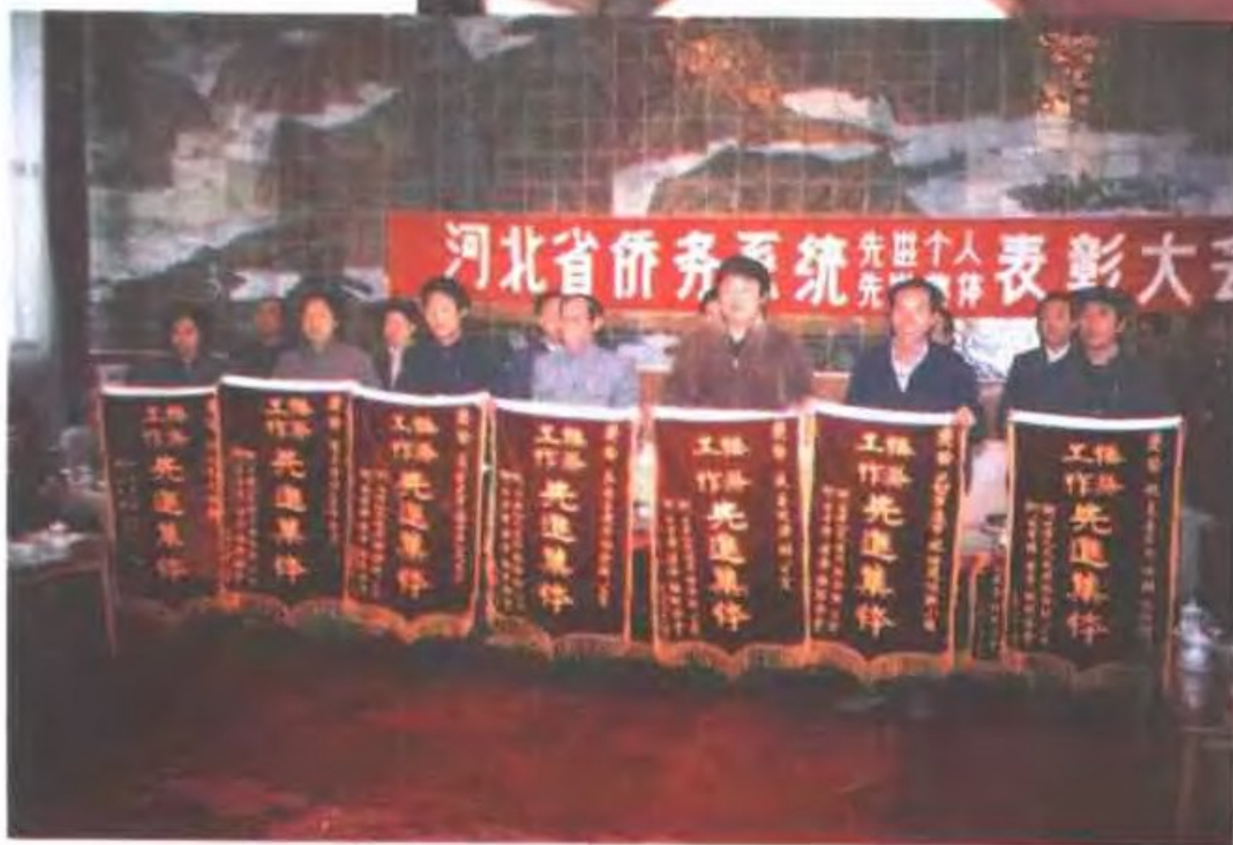
河北省召 开全省侨务工 作系统先进个 人先进集体表 彰大会