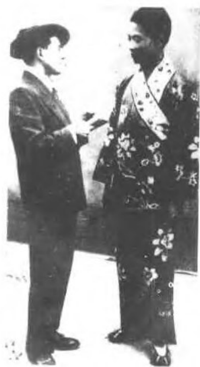
史俊德在国外演出后接受记者采访