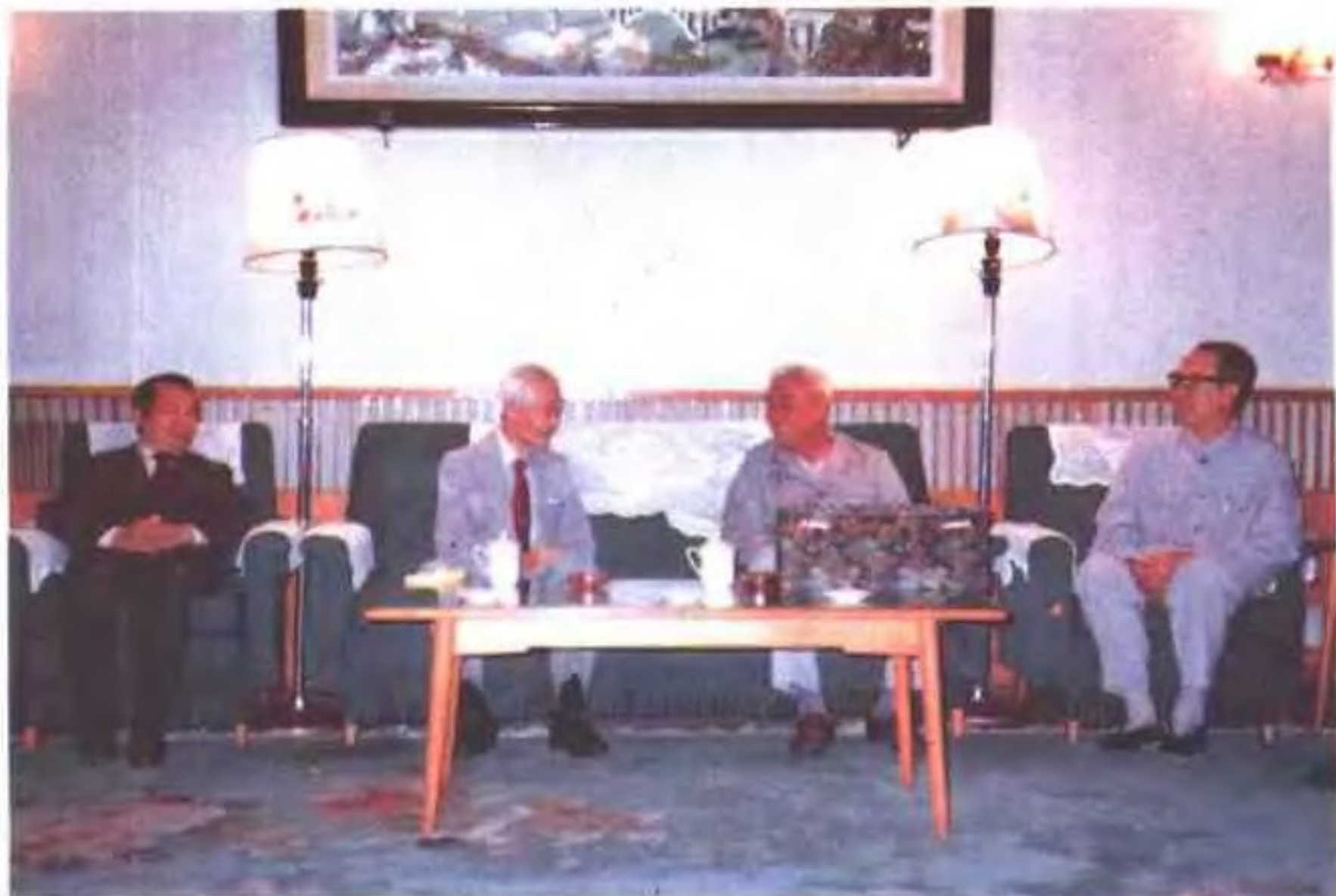
省长张曙光(右二)会见美籍华人宴阳初博士