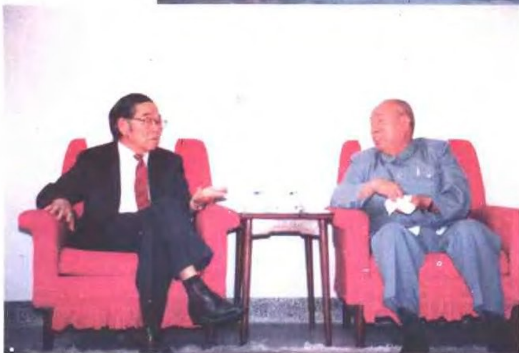
省长解峰(右一)会见美籍华人牛满江教授