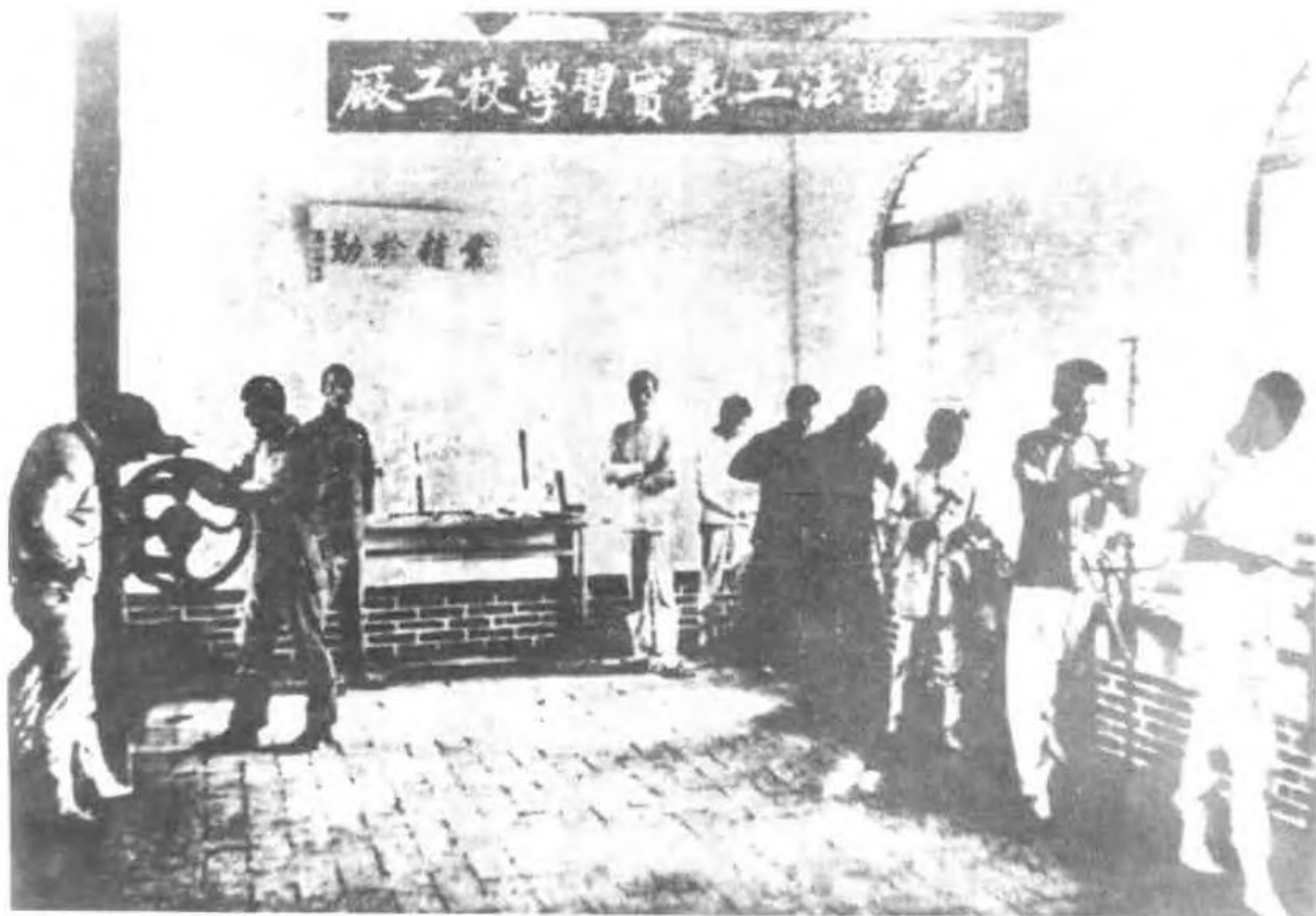
留法勤工俭学人员行前在高阳县布里留法工艺学校实习