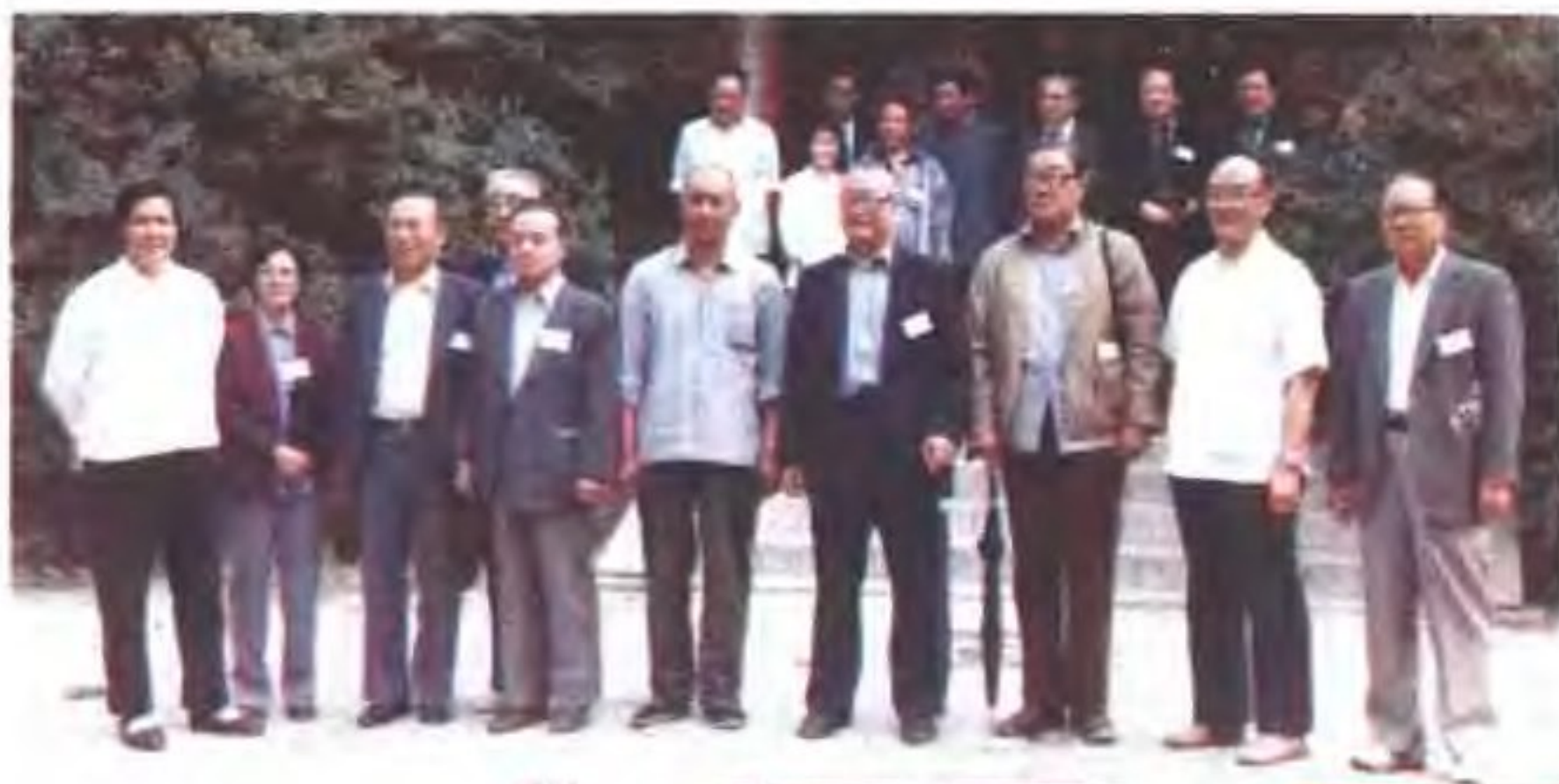
香港冀鲁 旅港同乡会赴 河北旅游观光 团在河北省访 问