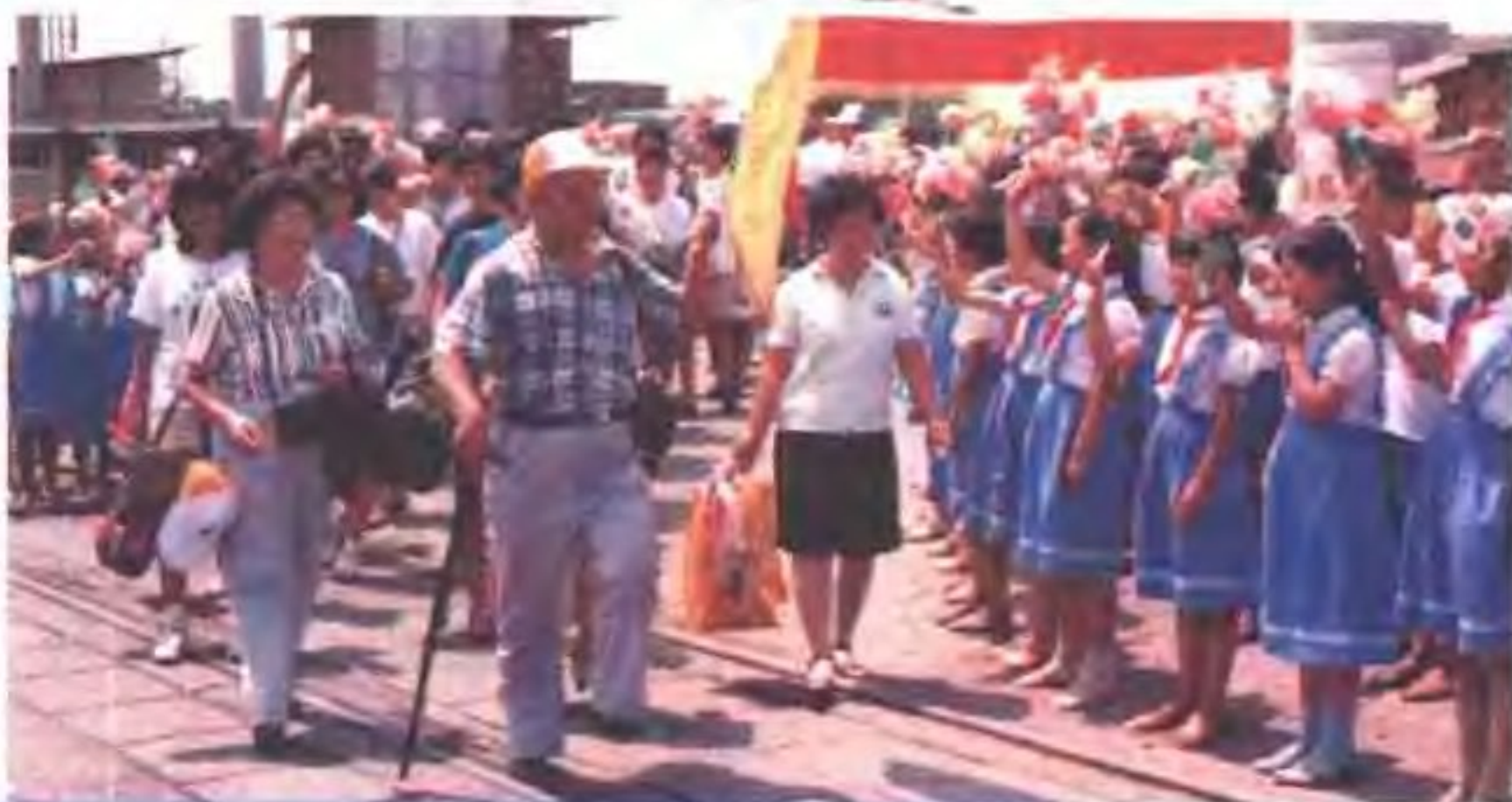
美国、加 拿大、日本 侨华裔青年 夏令营营员抵 达石家庄