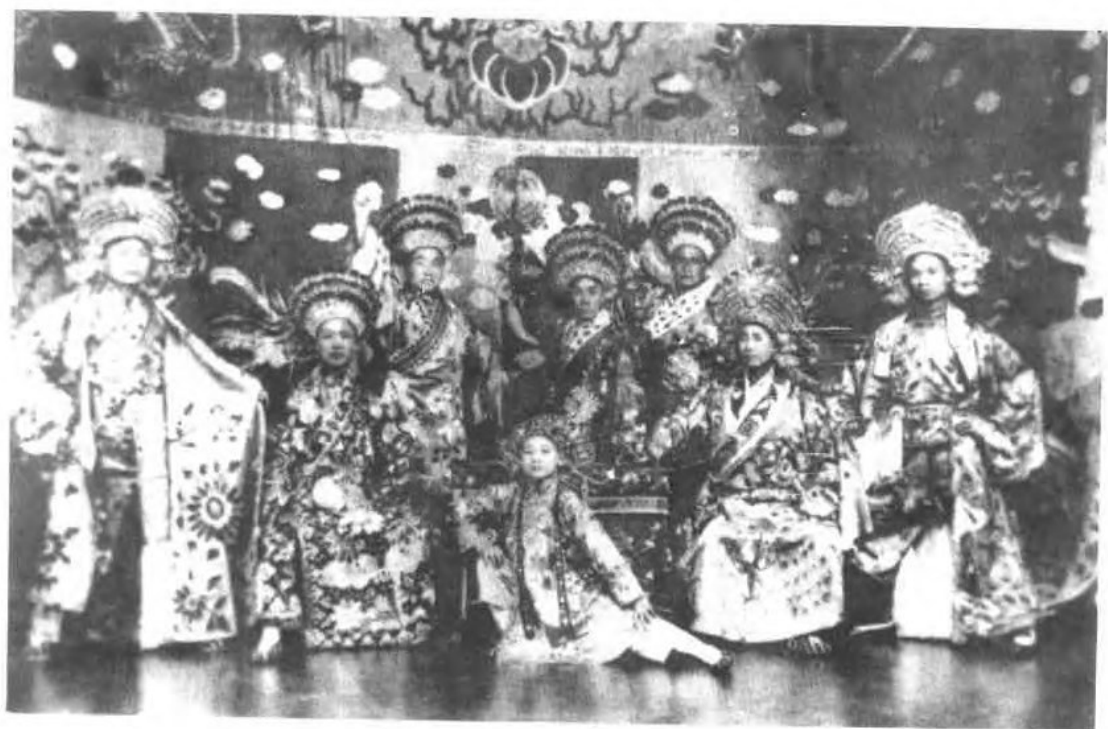
北京班全体成员在国外演出合影