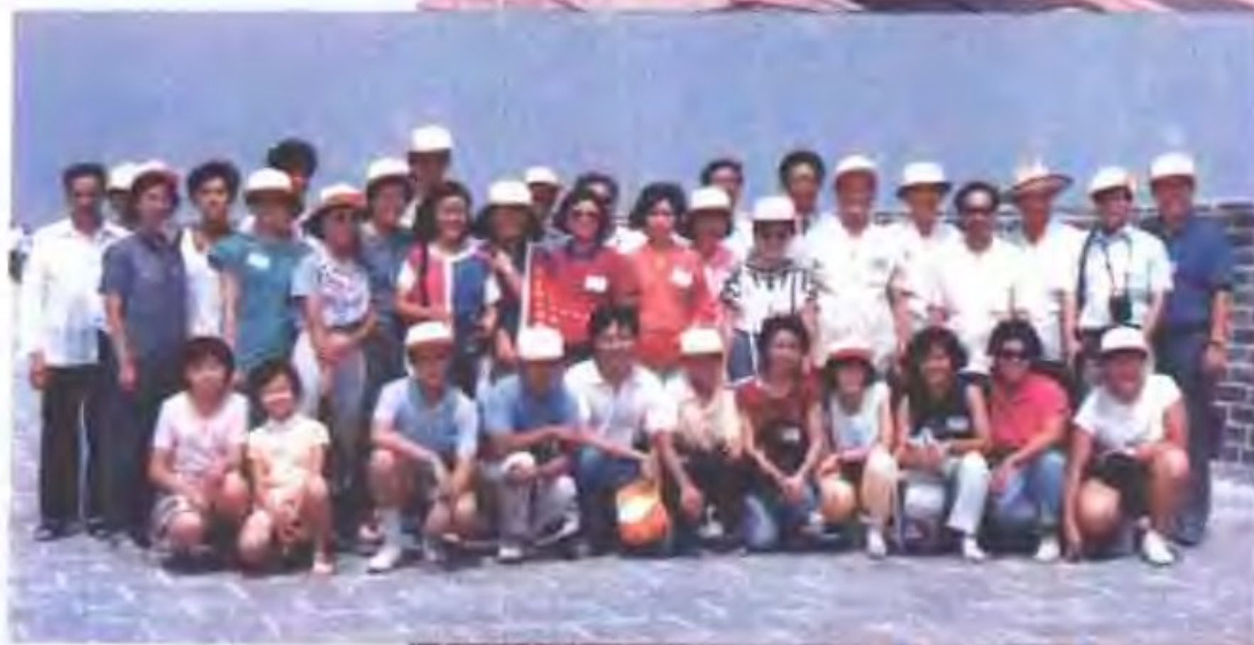
香港青少 年夏令营在山 海关合影