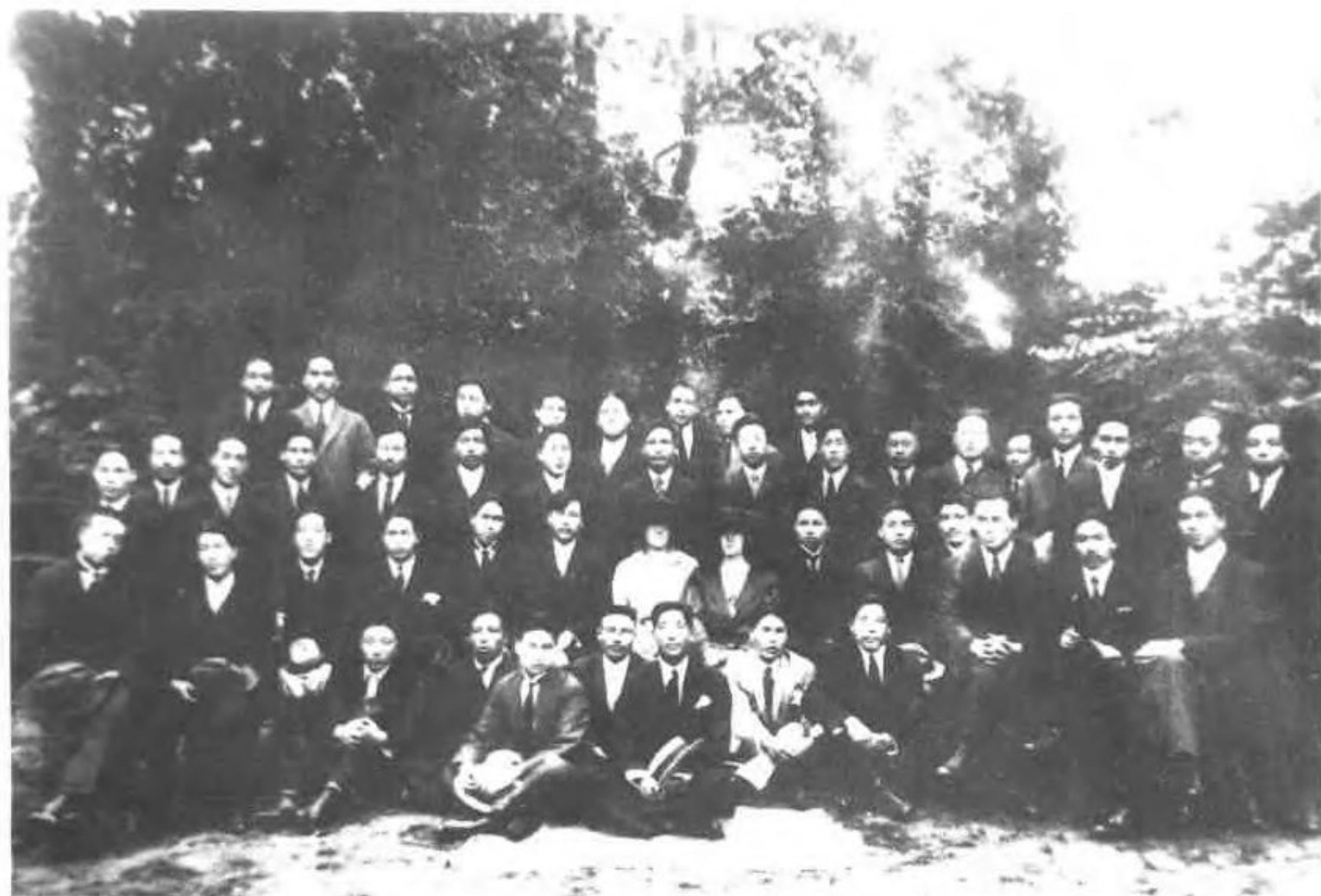
高阳县赴法中国豆腐公司员工在法国巴黎合影