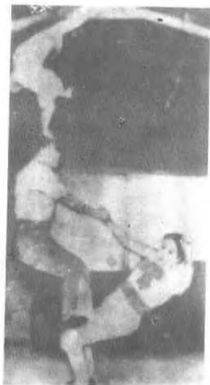
田仕合和妻子(下)在日本演出