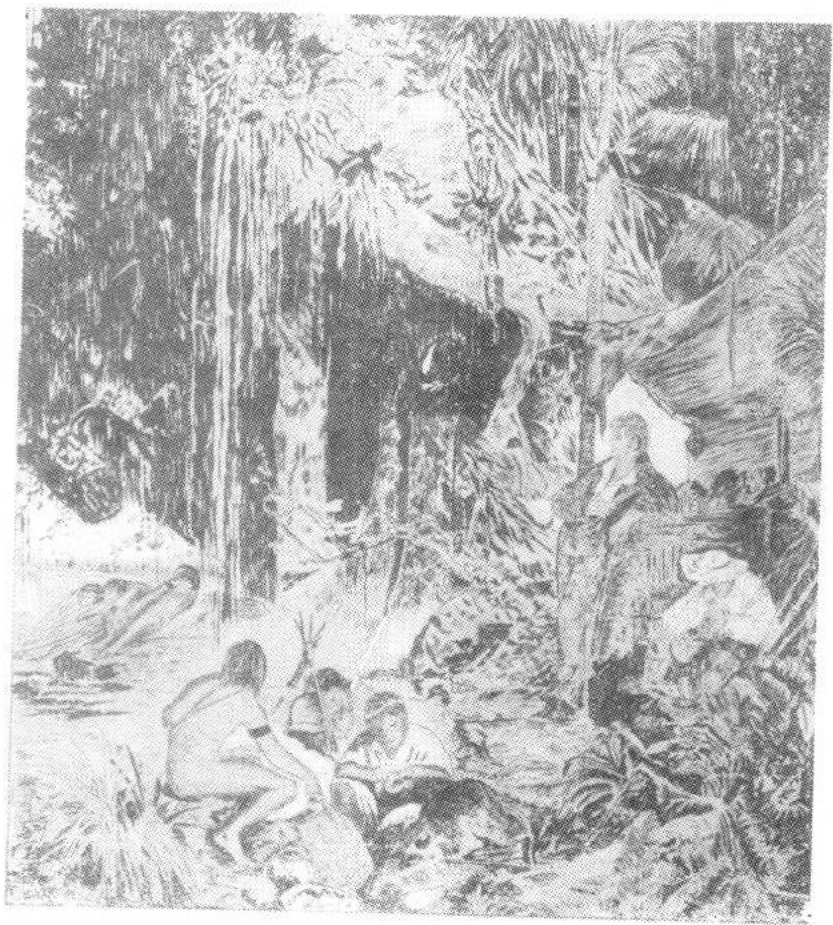
洪堡和邦普兰在奥里诺科河畔