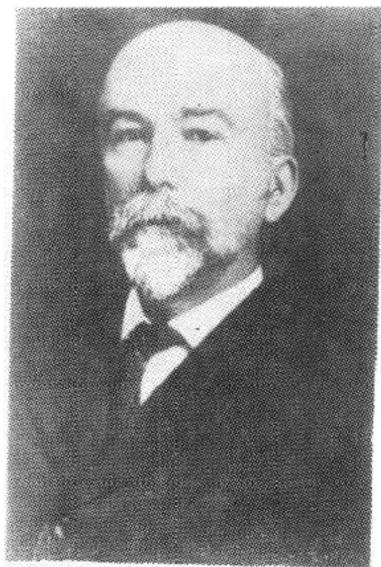
威廉·莫里斯·戴维斯