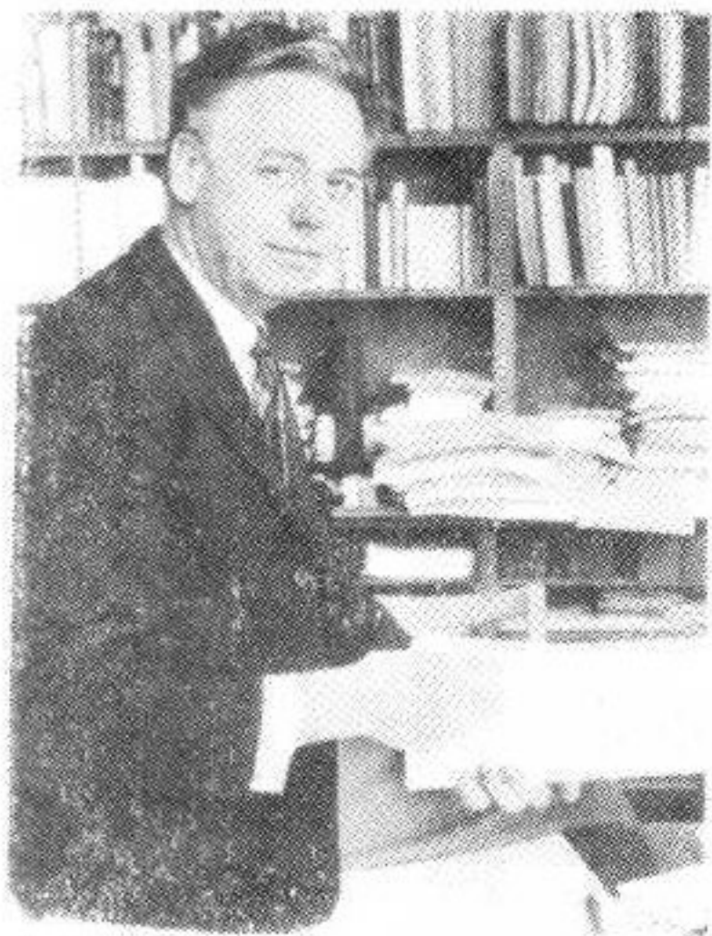
托尔斯坦·哈格斯特兰