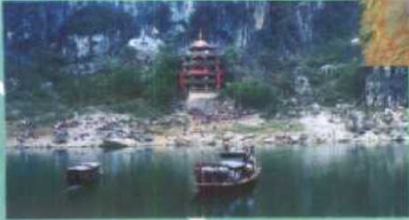
扶绥金鸡岩放花节