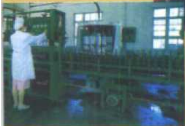
都安葡萄酒厂包装车间