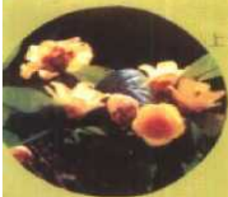
上思十万大山金花茶