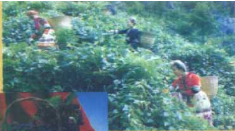
瑶家姑娘采摘高山葡萄