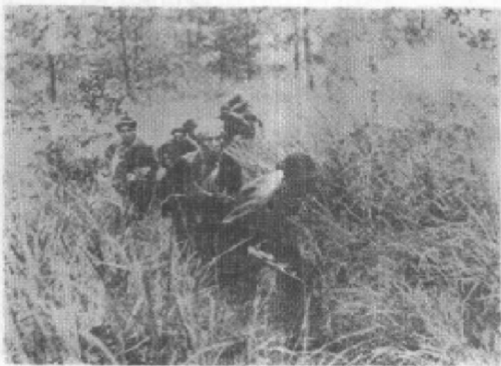
兄弟民族的民兵在搜索残匪。