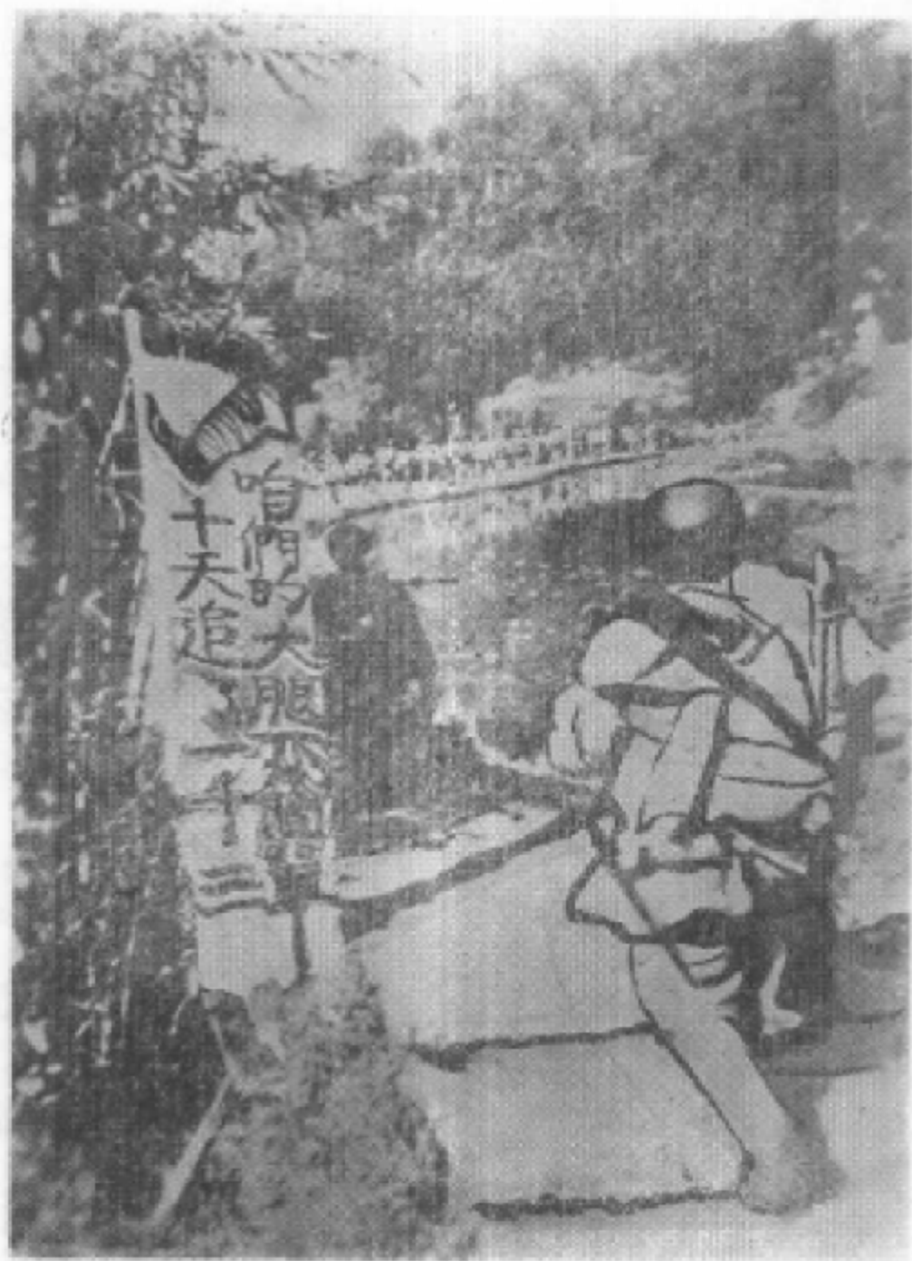
解放军日夜兼程追歼溃敌。路边的标语是：“咱们的大腿不简单，十天追了一千三”。