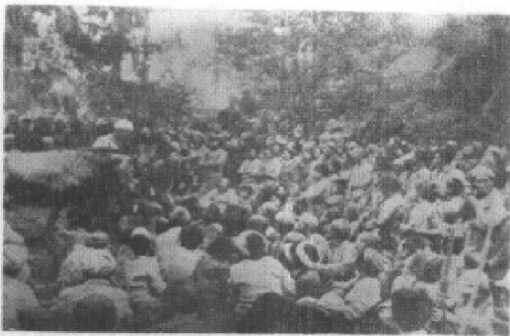
把土匪抢去的牛马夺回来还给农民。