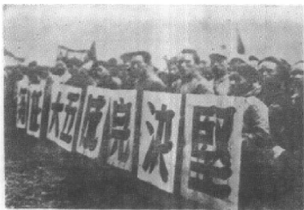
安順专区农民在农代会上表决心，坚决完成五大任务。