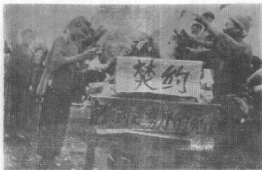
宣布封建势力的死亡——焚烧租佃地契。