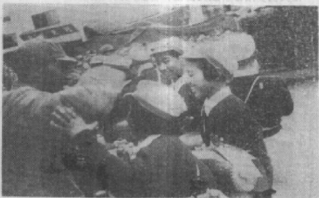
一九五一年元月，贵州军区文工团腰鼓队欢送路经贵阳去 昆明的二野四兵团司令员陈赓同志。