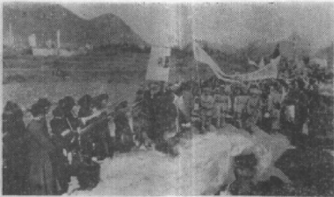
解放军整队进入贵阳。