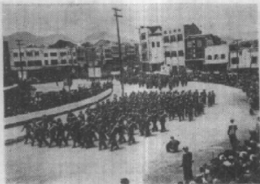
军民欢庆贵阳解放。