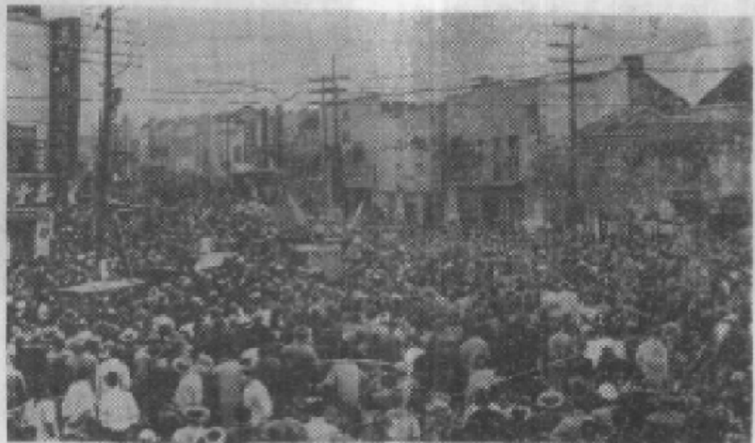
万众欢庆贵阳市解放。