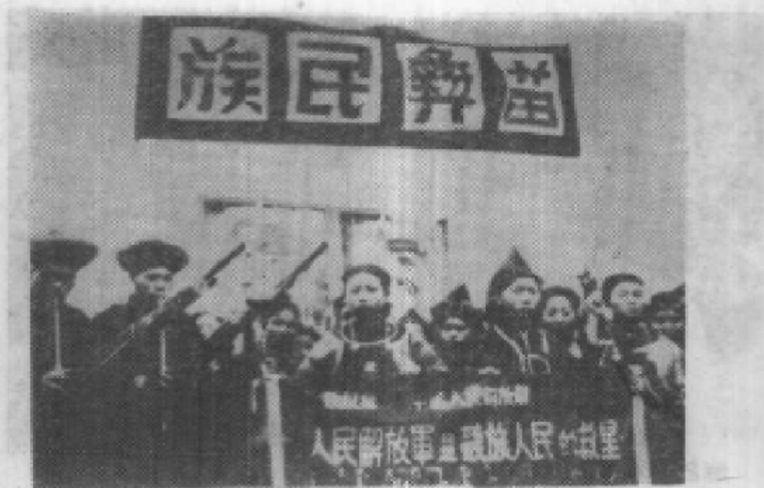
在庆祝贵阳市解放大会上，各族人民向解放军献旗。