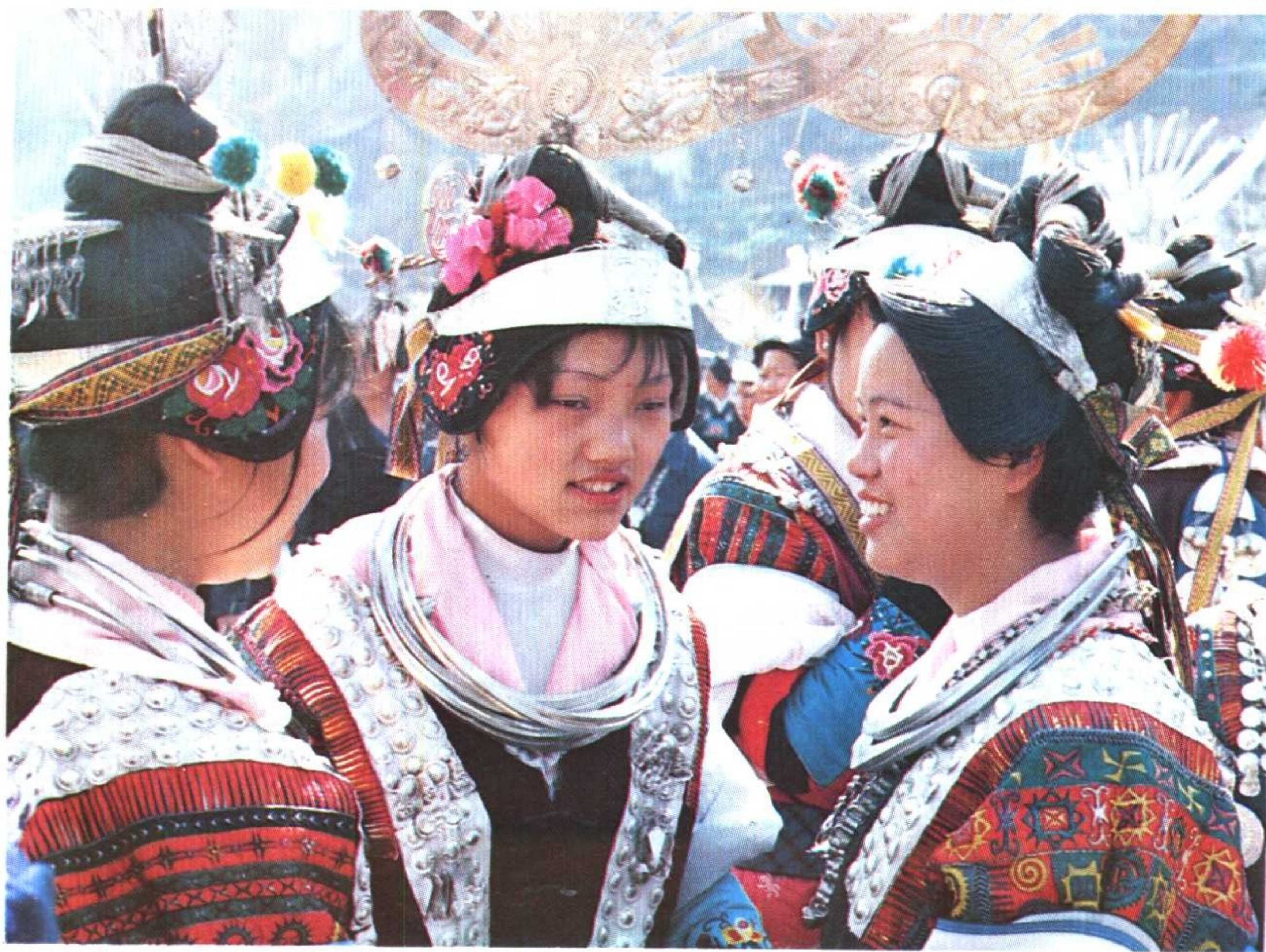
凯里市青曼一带少女的头饰。