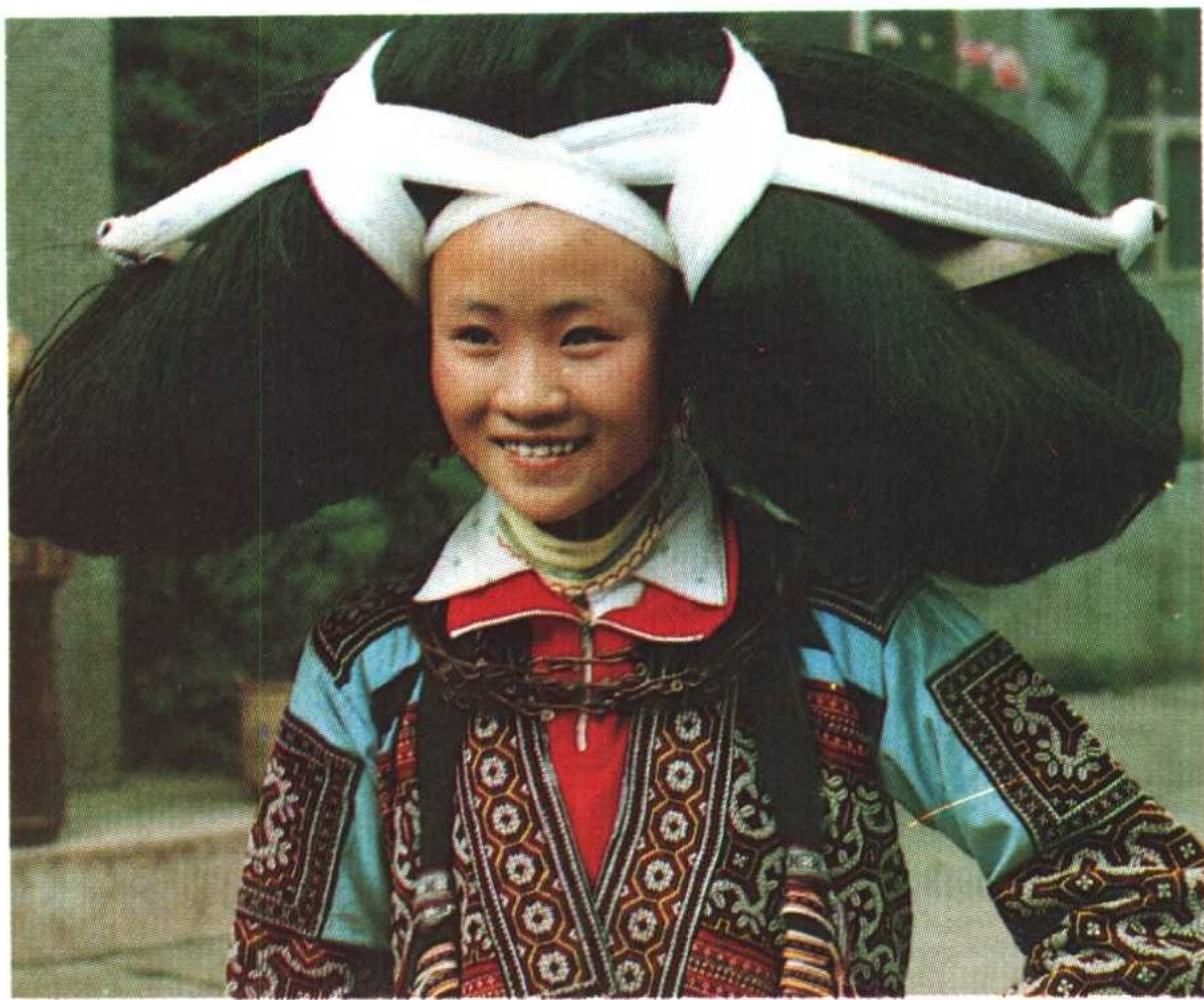
六枝特区陇嘎苗族女性头饰。