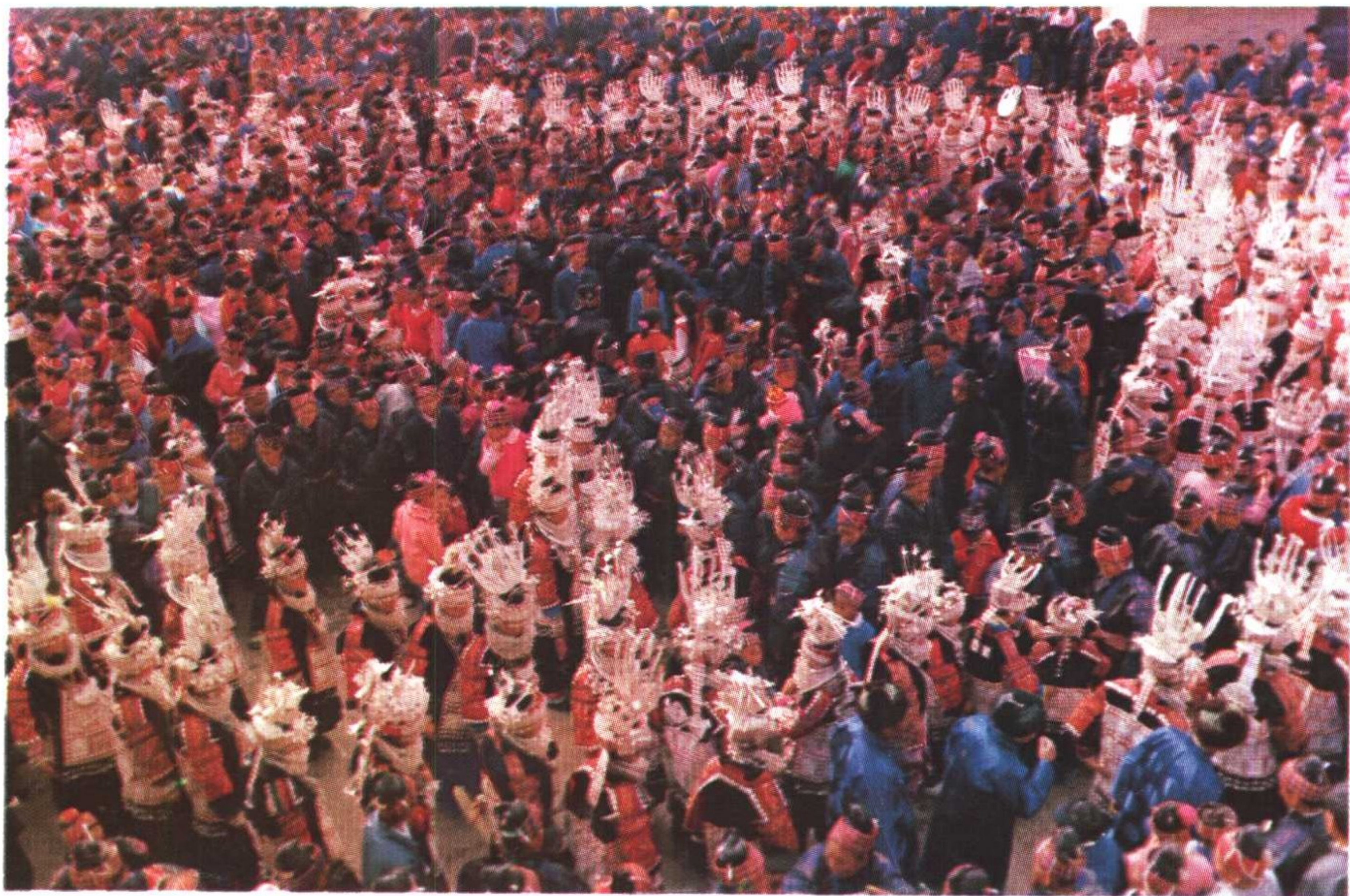
施洞苗族农历三月十五“姊妹节”期间,是一片盛装银衣的世界。