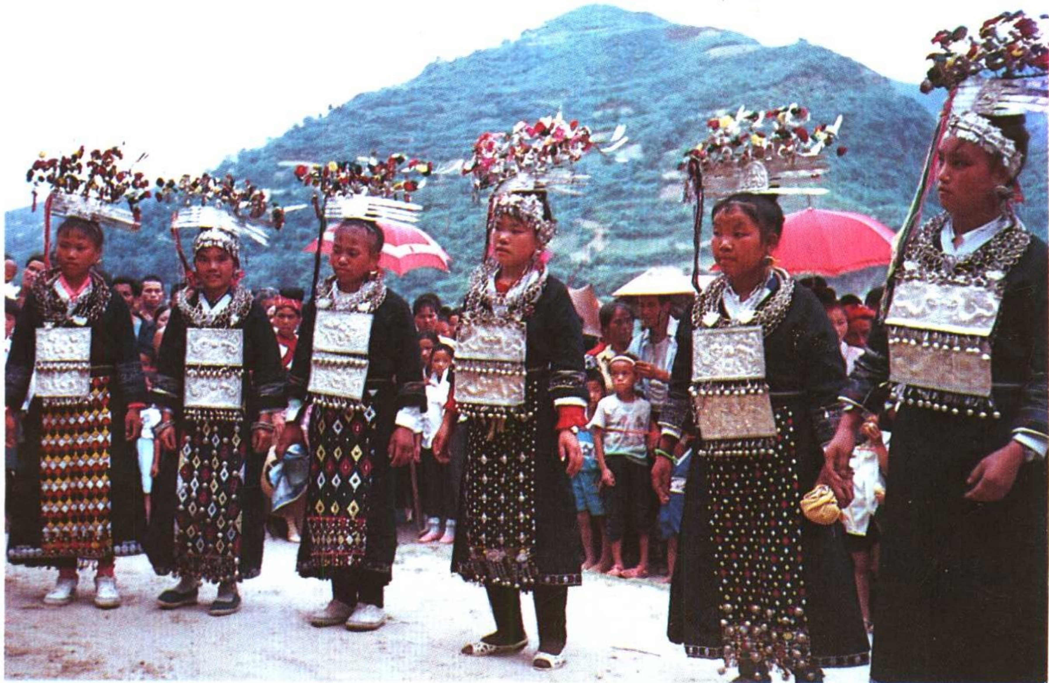
台江县反排苗族女性盛装。