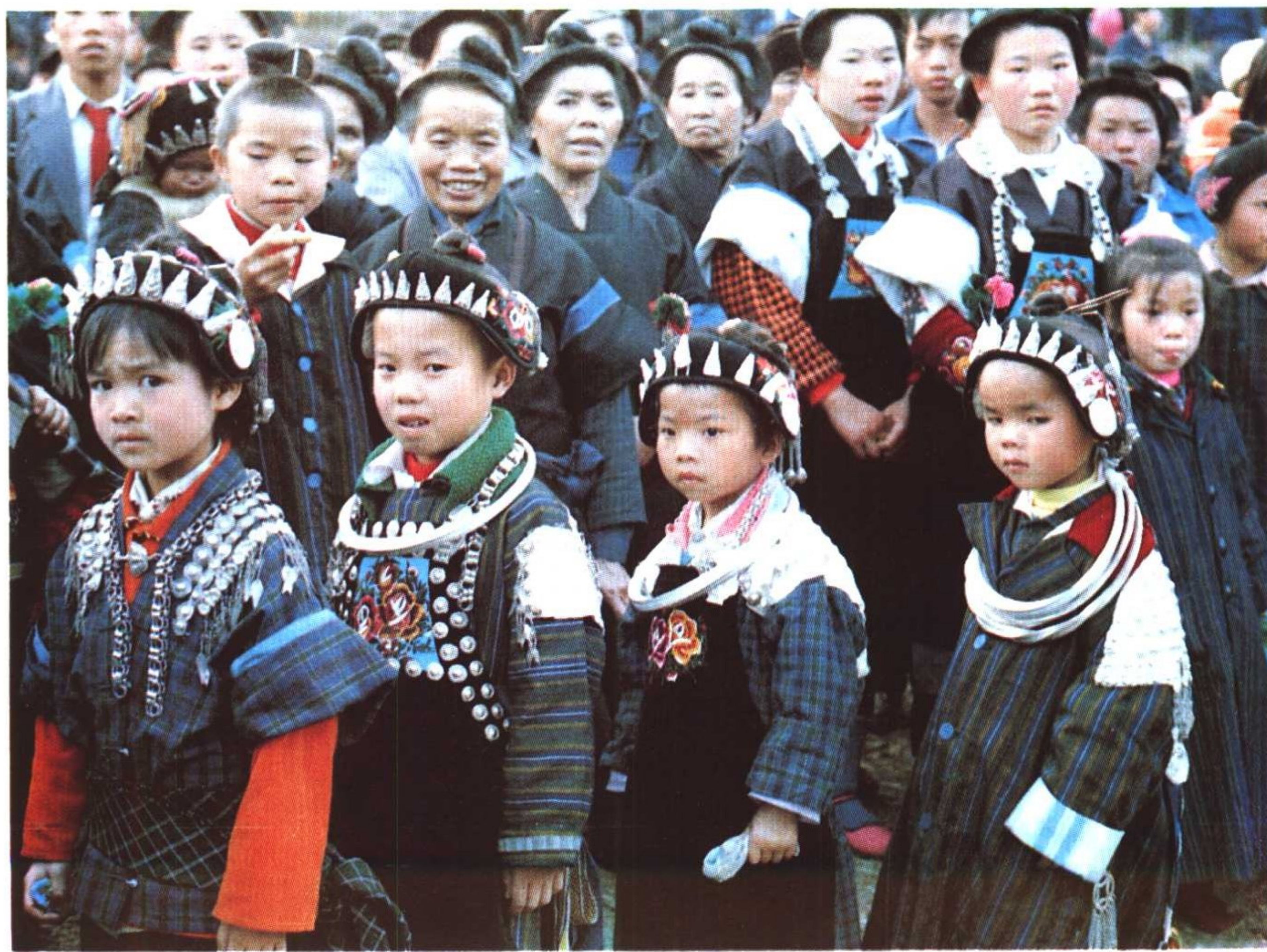
凯里市青曼一带苗族儿童的服饰。