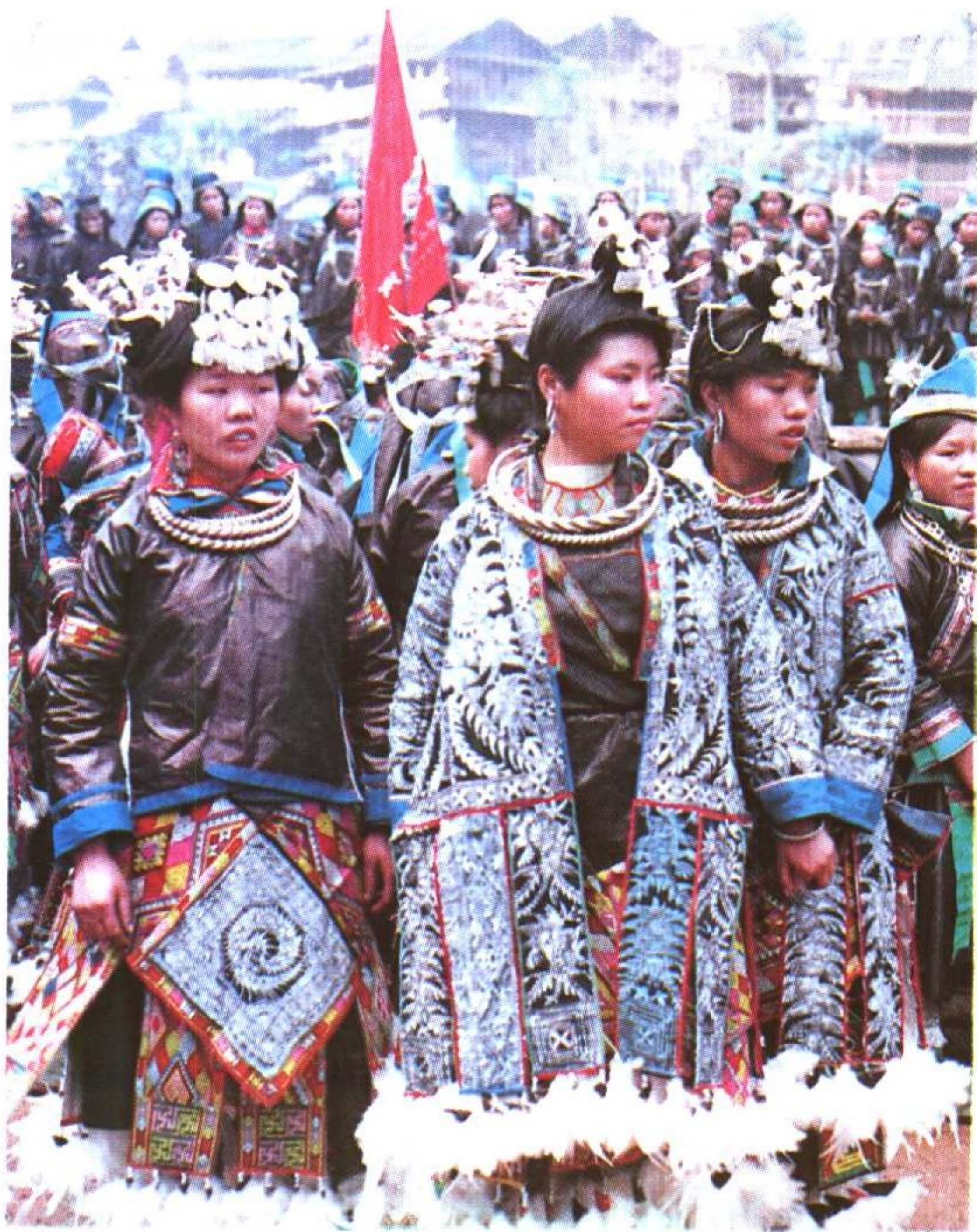
从江县月亮山区“花衣苗”女性盛装。