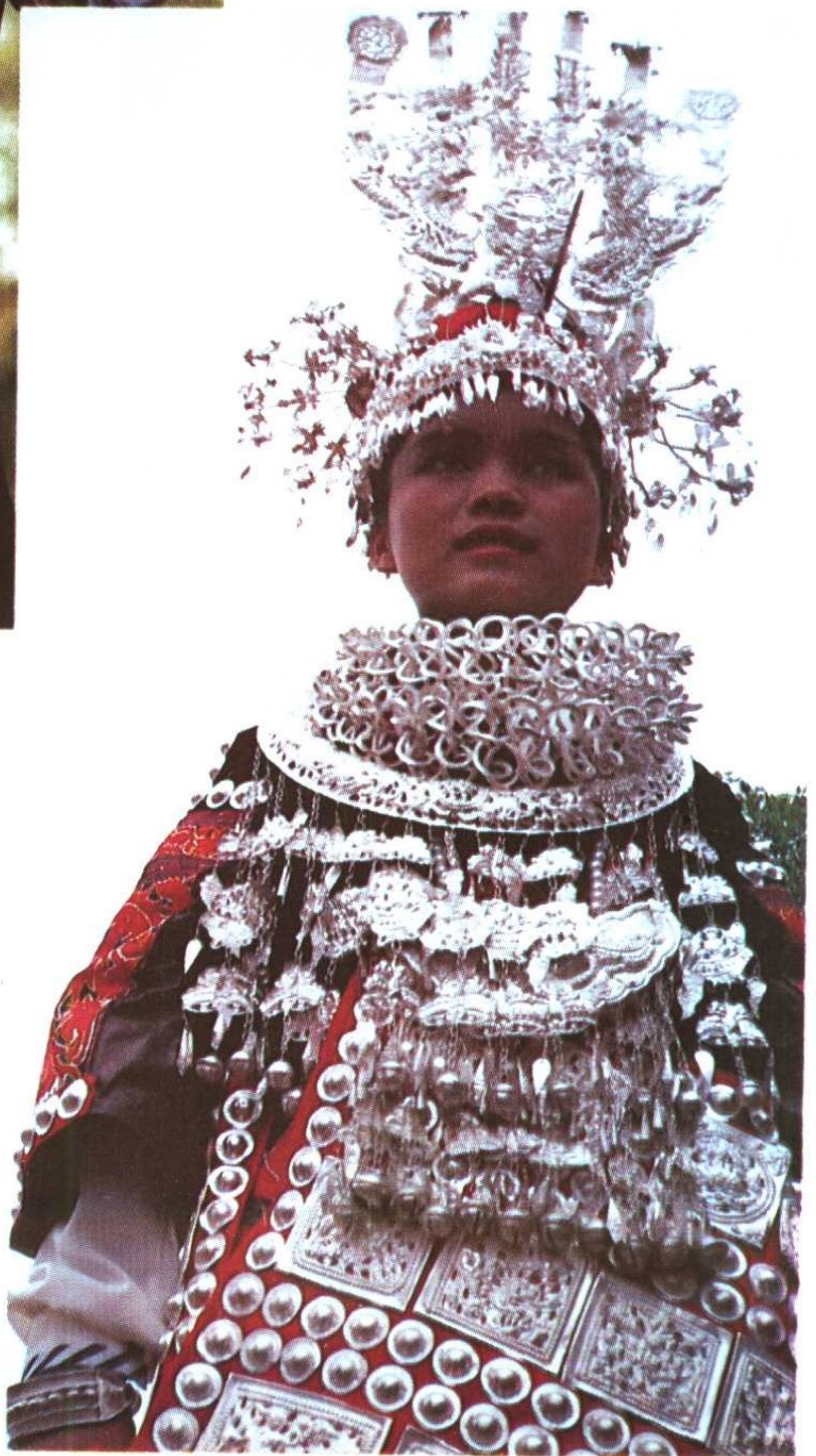
施洞苗族女性的一等盛装。