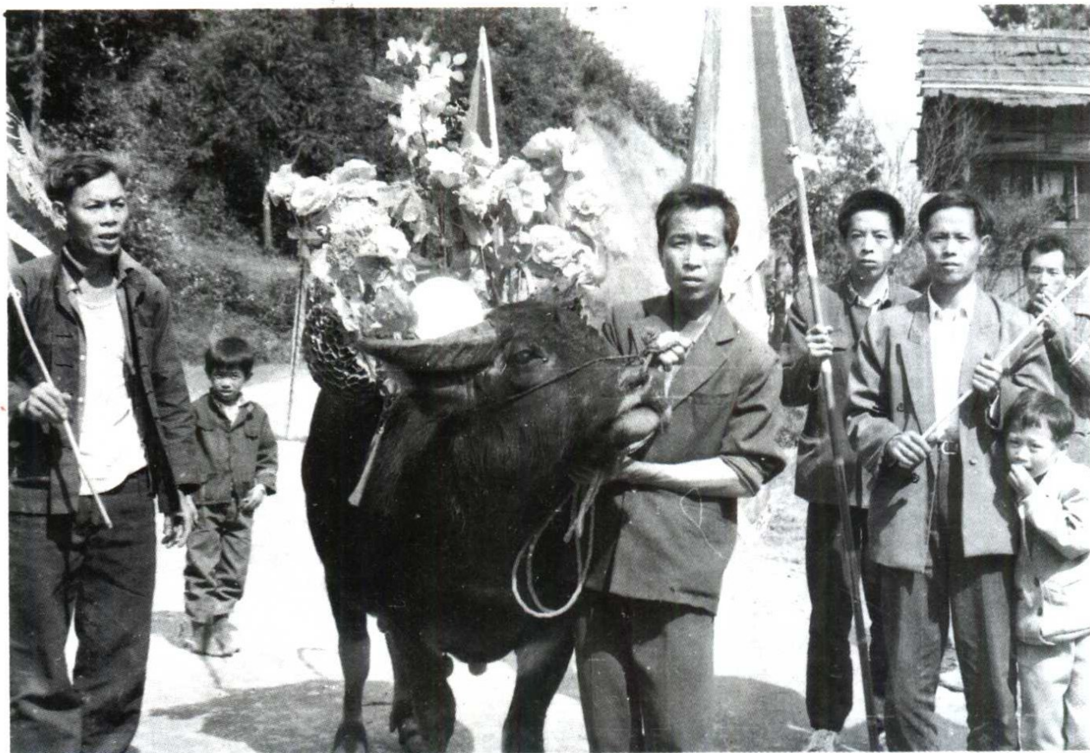
九寨“安瓦”中的牛王