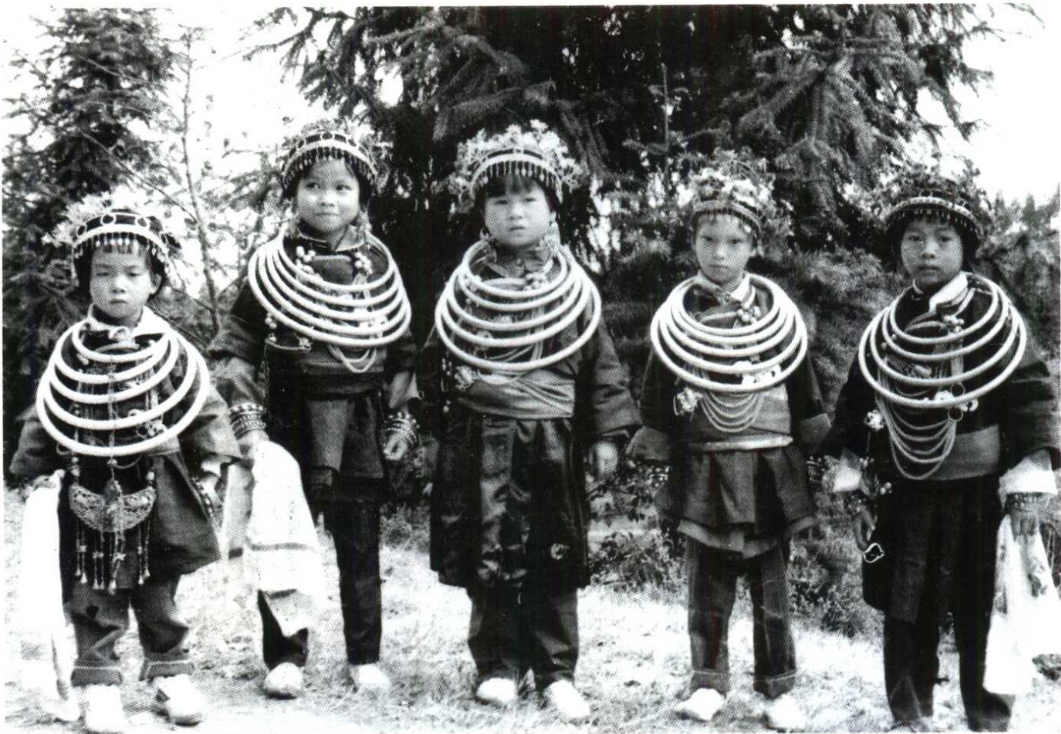
身着盛装的九寨女孩