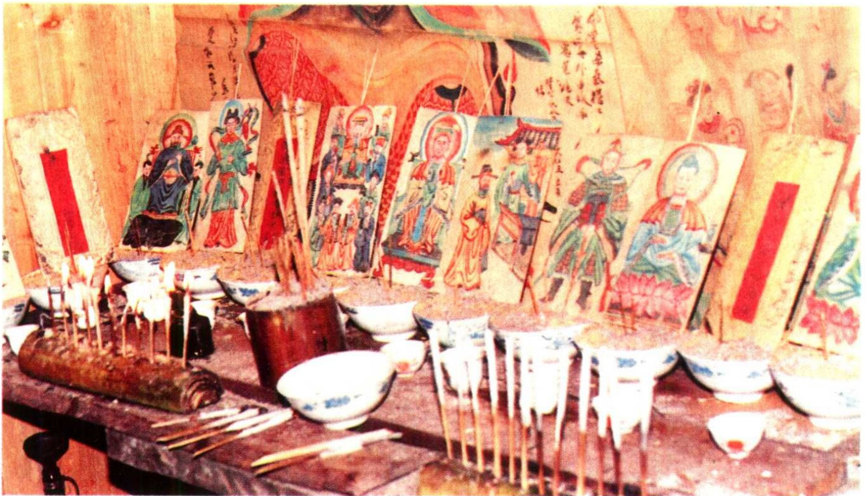
九寨丧事中的经堂神位