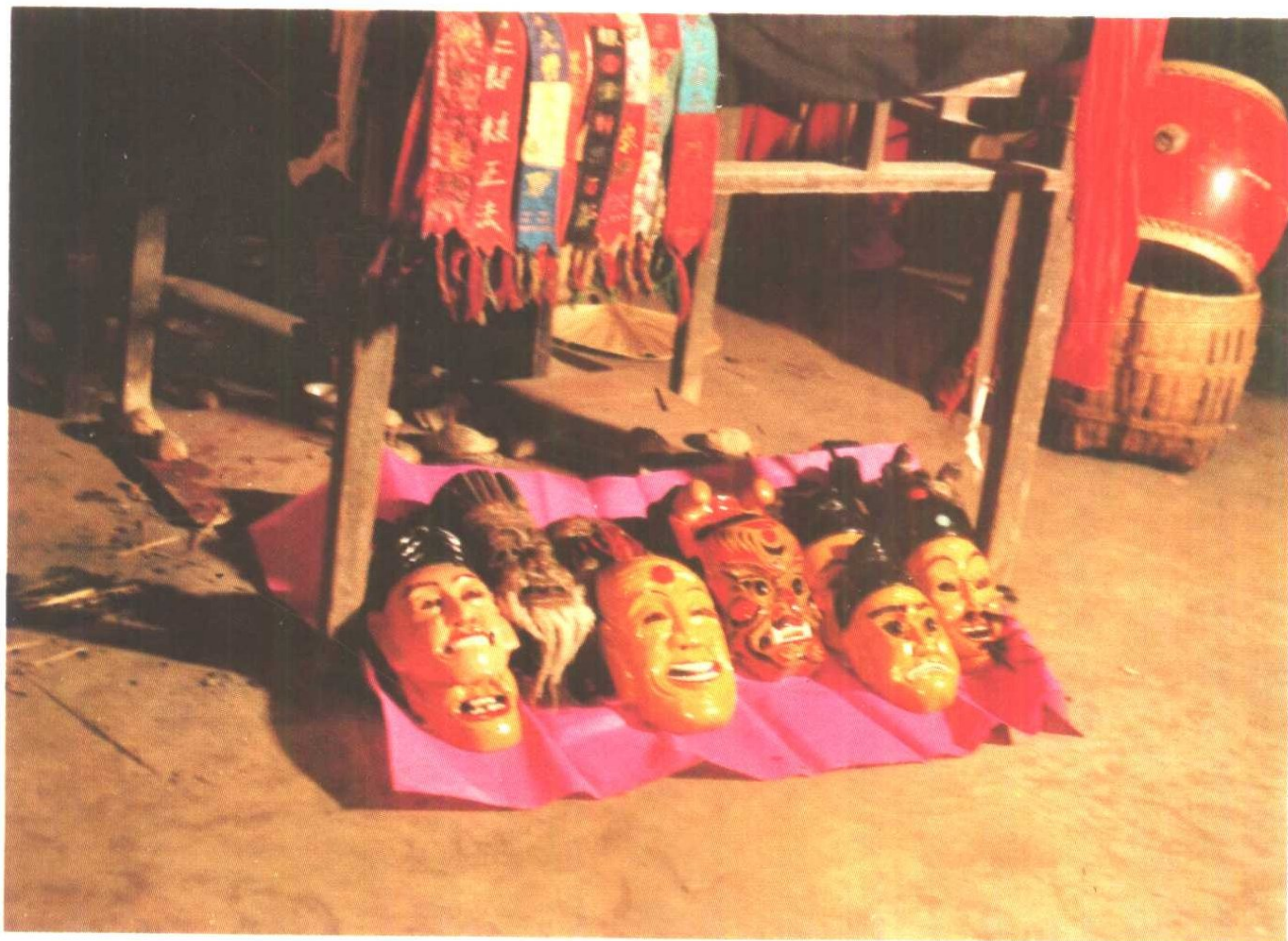
岑巩注溪乡喜侗神·侗面具