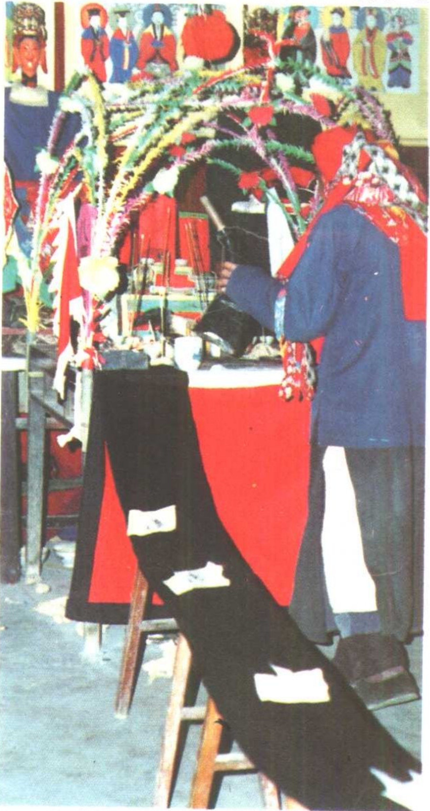
岑巩注溪乡喜侗神·搭桥