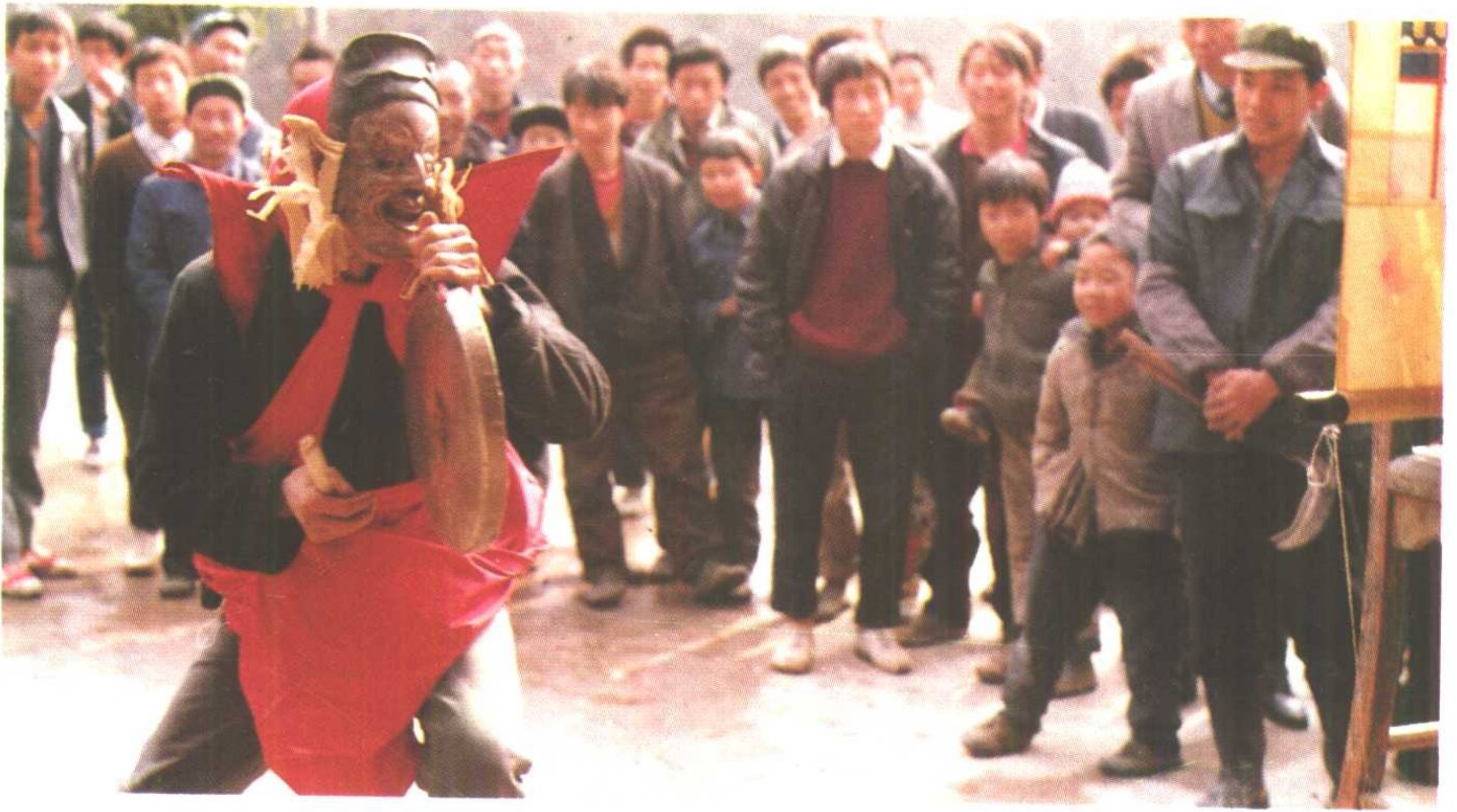
岑巩注溪乡喜侗神·跑报