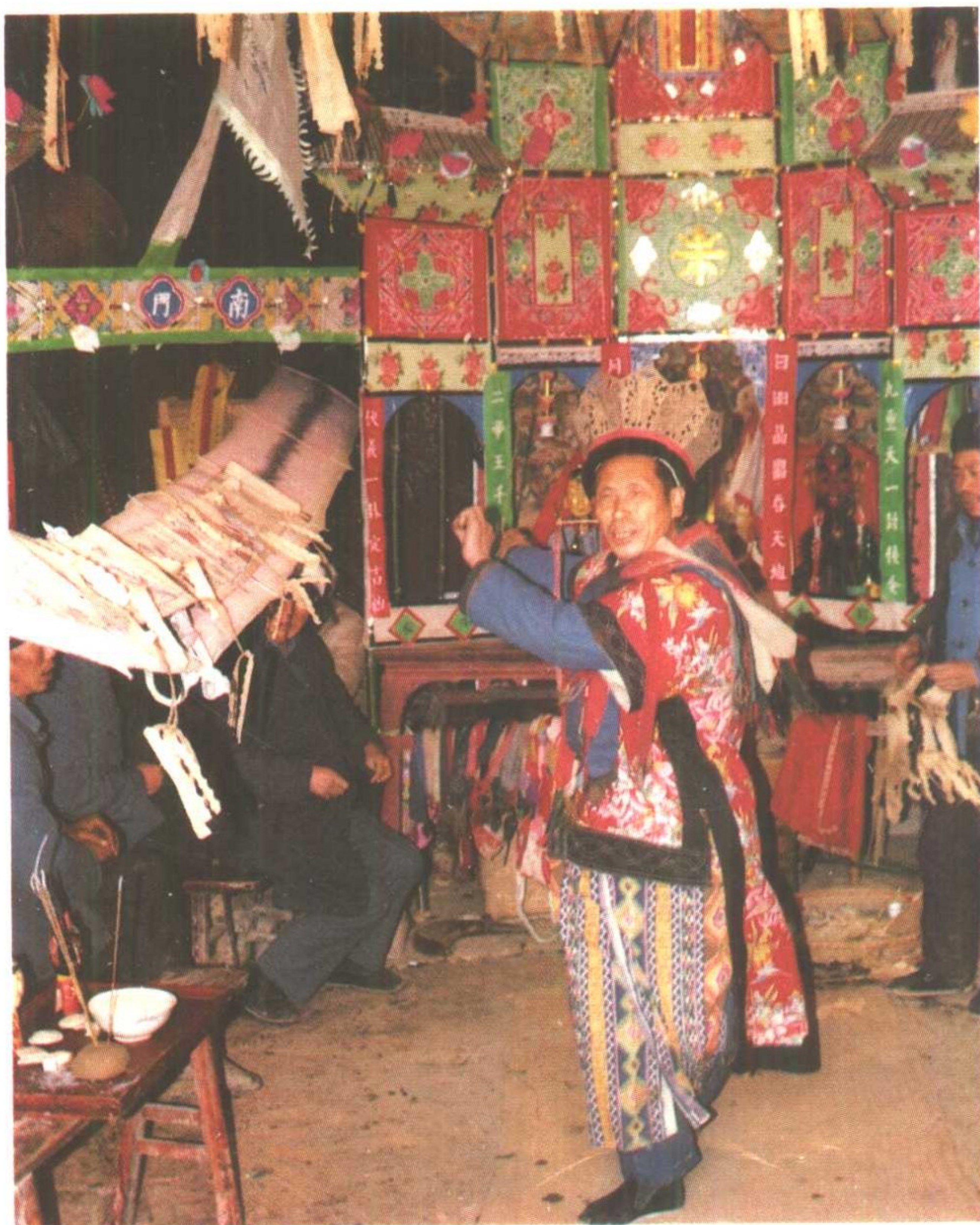
德江冲寿雉·迎銮接驾