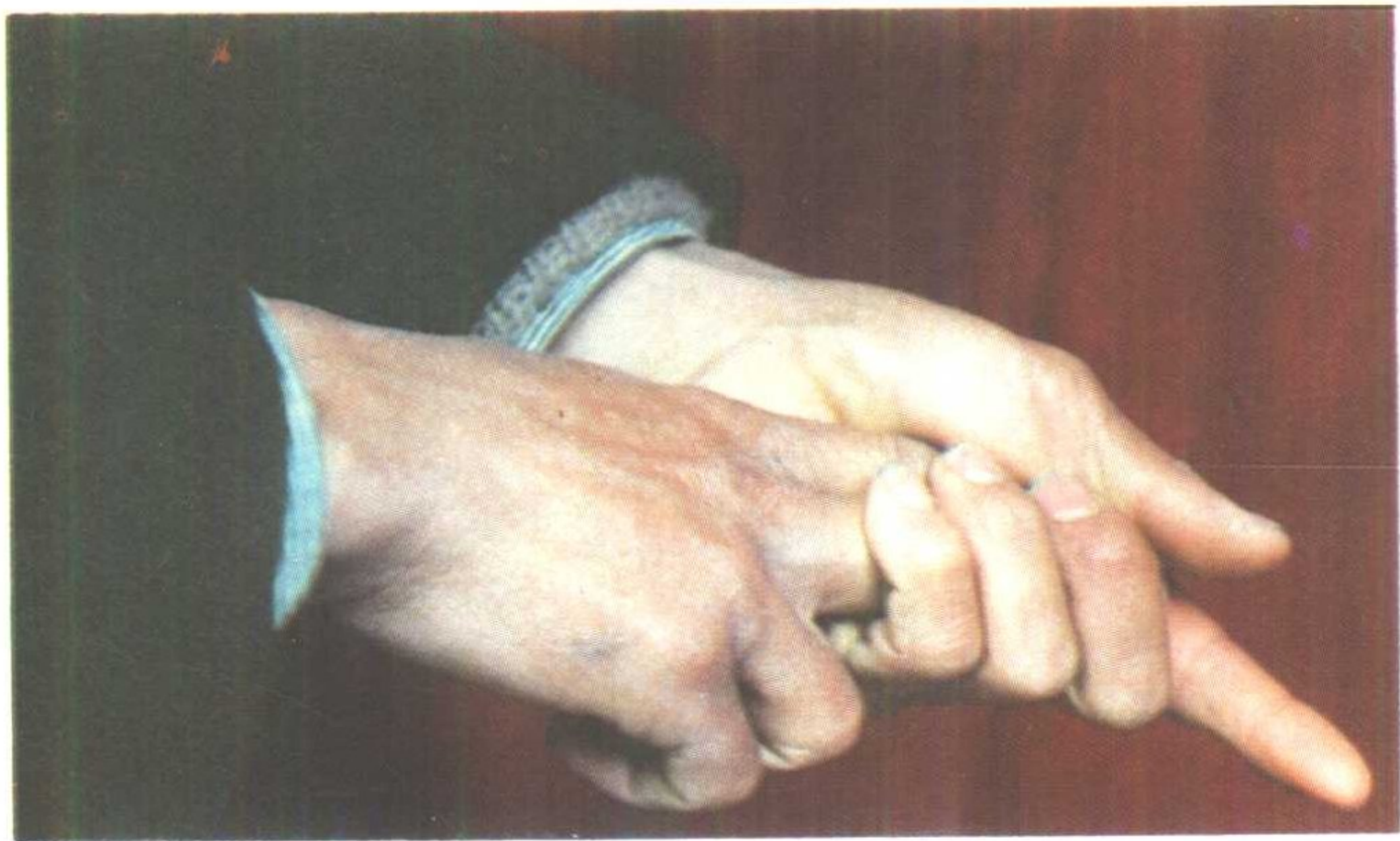
岑巩注溪乡喜侗神·手诀之一