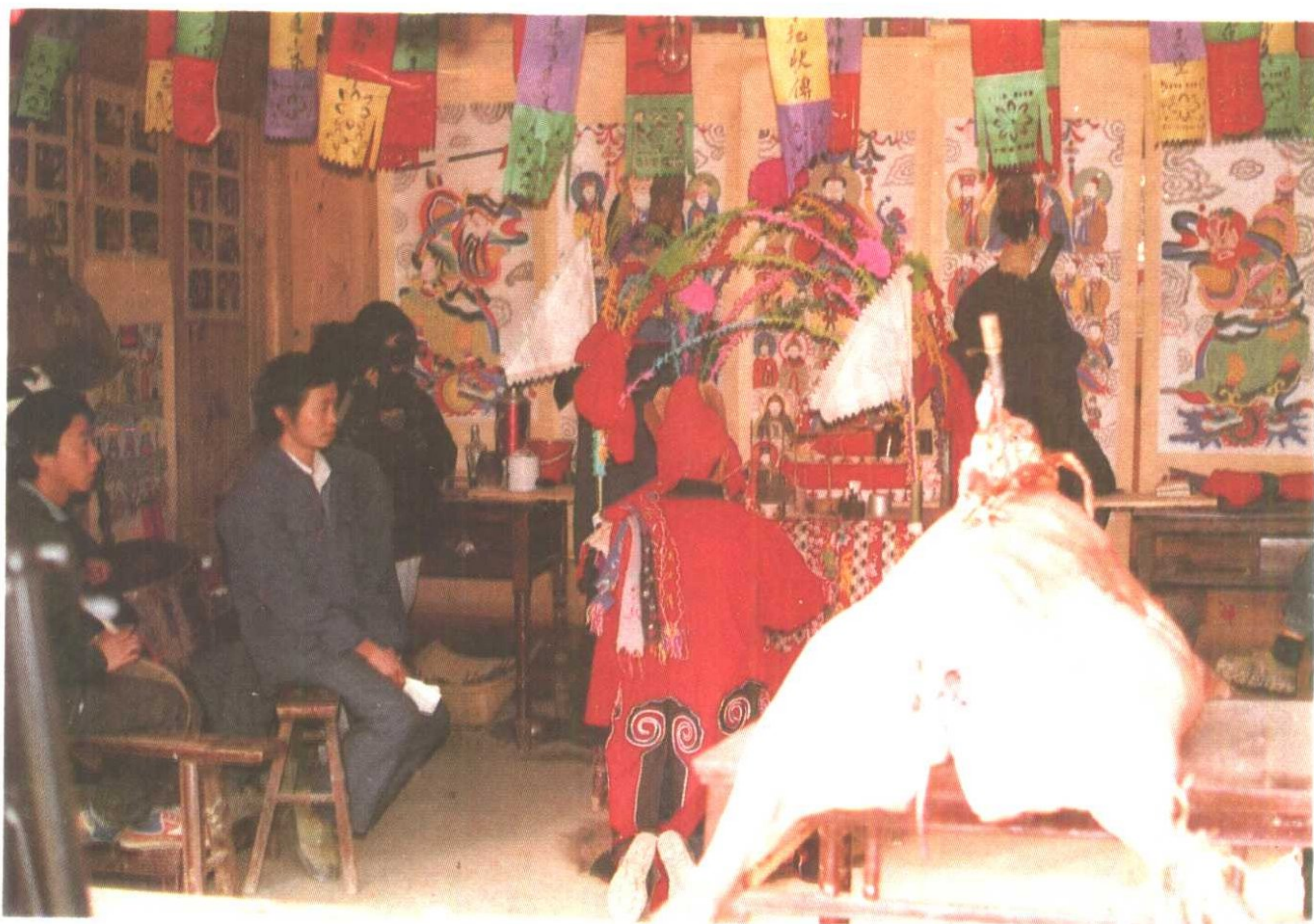
岑巩注溪乡喜侗神·献白