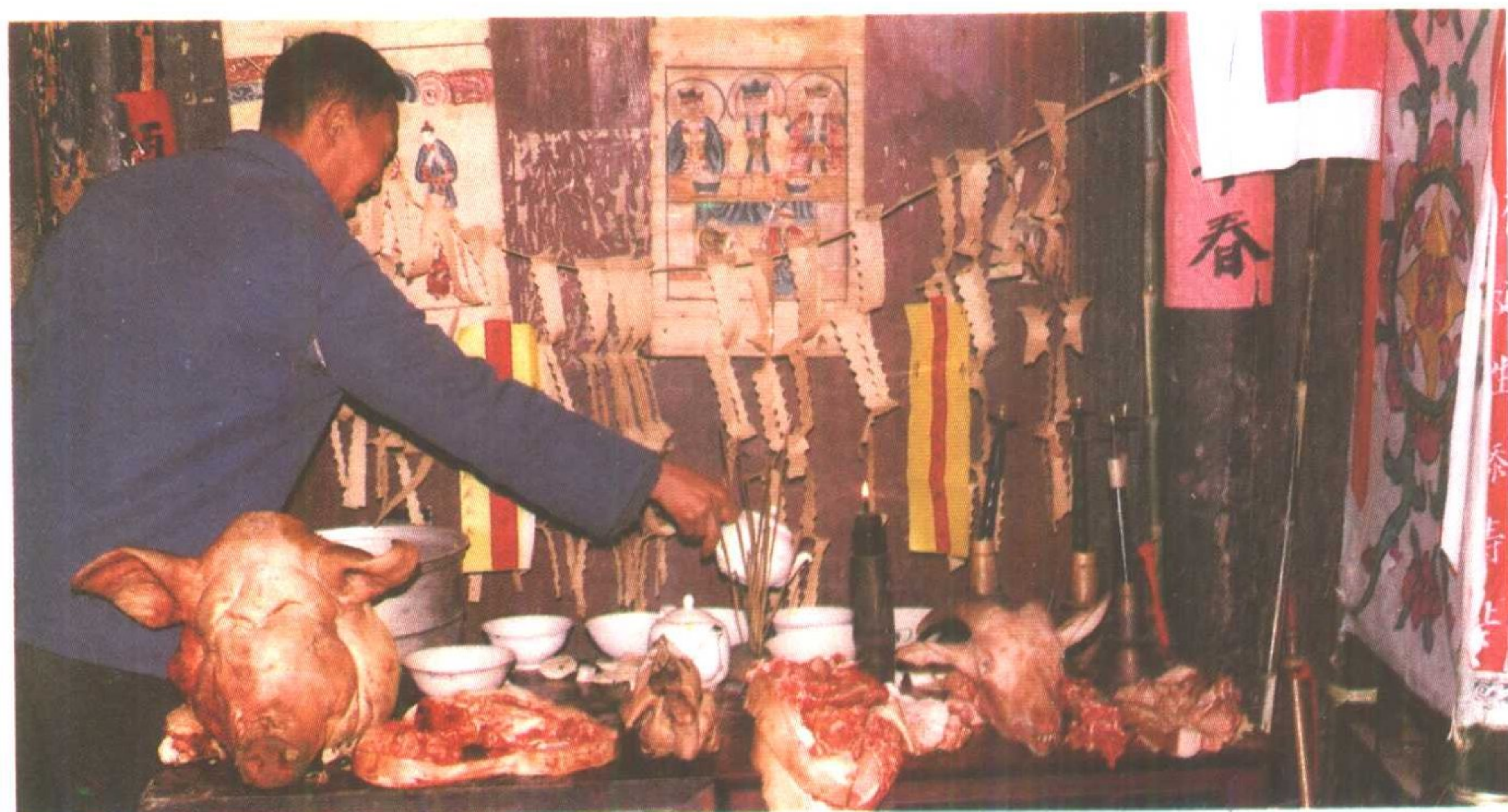
德江冲寿雉·上熟