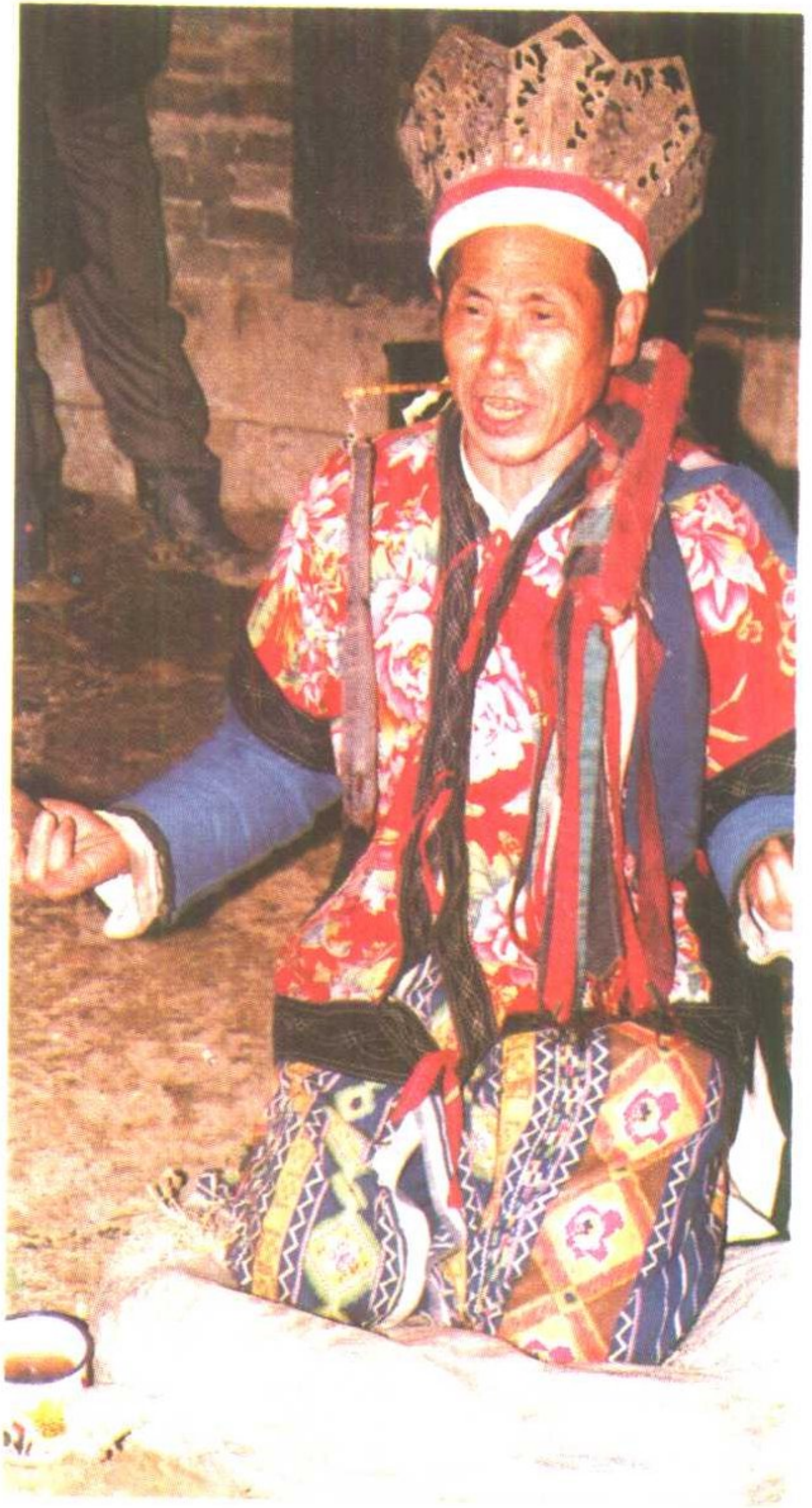
德江冲寿侗·开坛·打卦·请神