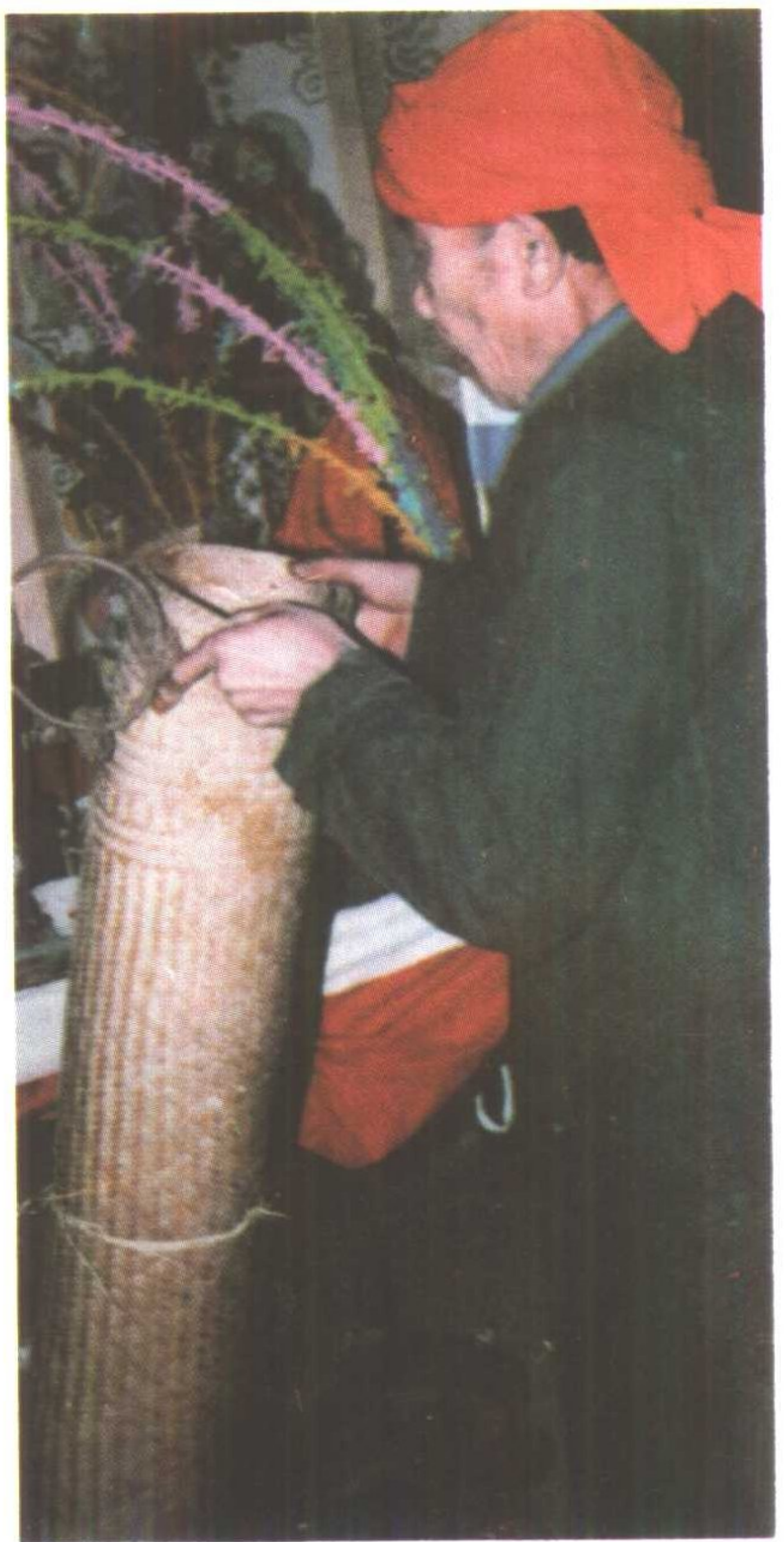
岑巩注溪乡喜侗神·辞席