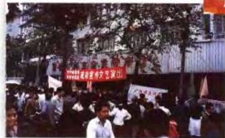
税收宣传活动 (90年代)