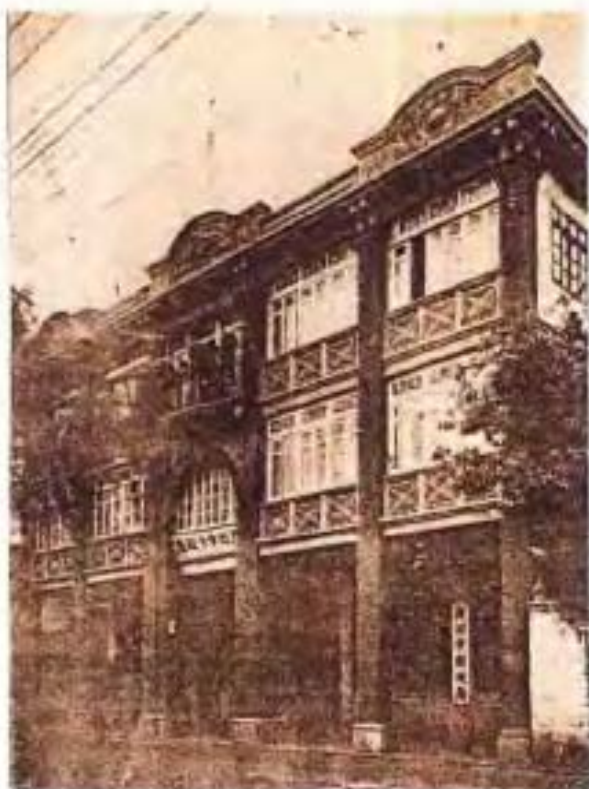
50年代的广州市财政局