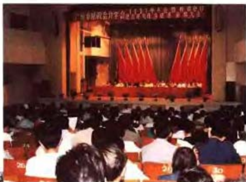
市财政会计学会颁奖大会 (1991年)