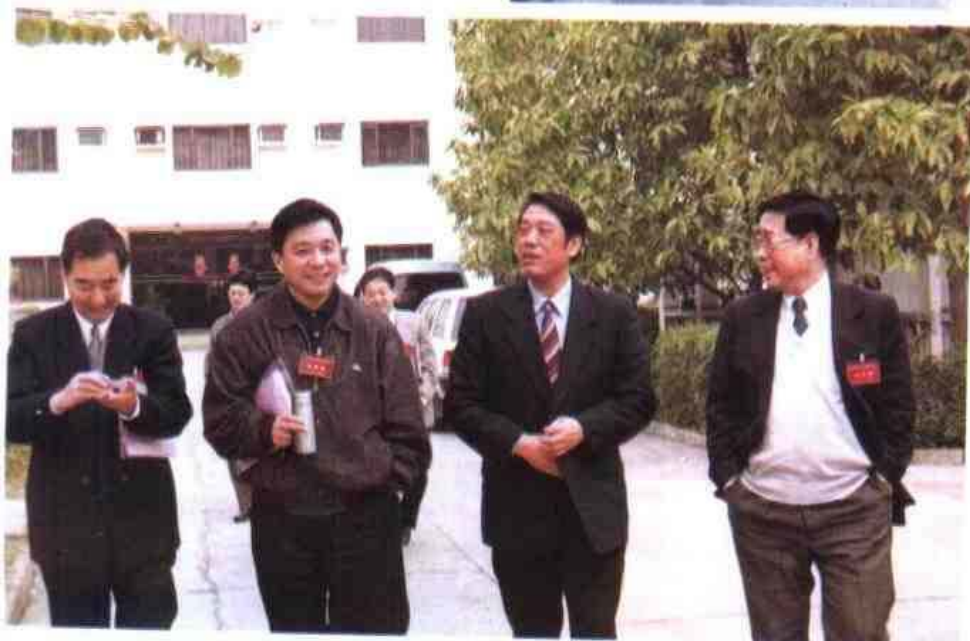
◁1997年2月，全国地方考试录用工作会议在南宁举行。图为国家人事部副部长张学忠（右一）、自治区副主席袁正中（右二）与代表们步入会场。