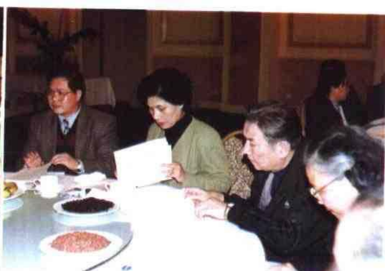
△1996年2月，自治区党委组织部、人事厅等8家单位联合举办在邕知识分子迎春团拜会。自治区领导赵富林、马庆生、潘琦、徐爱俐、袁凤兰、张慕洁、侯德彭等出席。