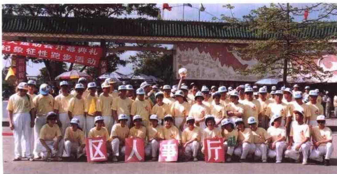
◁ 1996年5月，自治区人事厅30多名职工参加南宁市组织的第三届全国工人运动会开幕典礼和奔向21世纪象征性长跑活动。图为全体运动员合影。