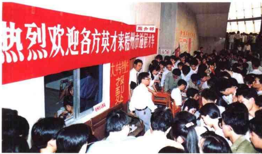
◁ 1996年7月29日，梧州市召开人才交流大会，热烈欢迎各方英才到该市施展才华。图为大会会场一角。