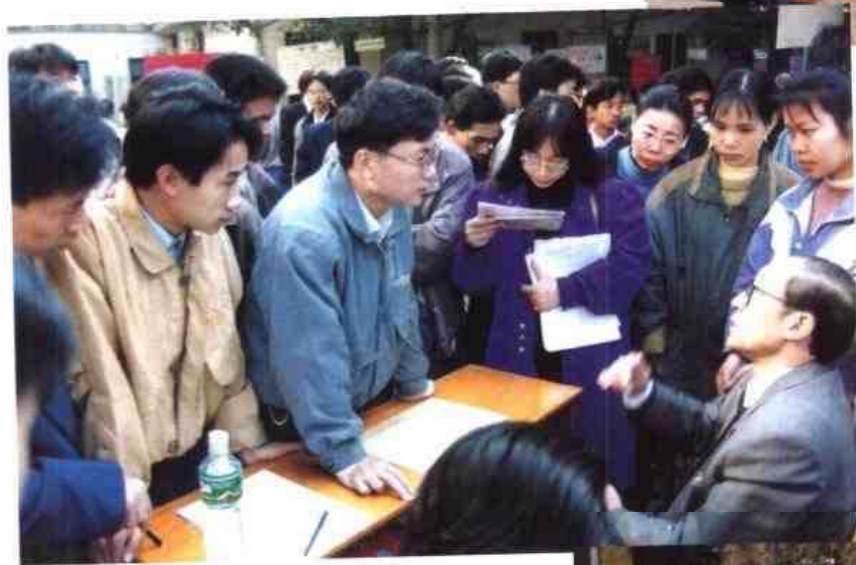
◁三资企业踊跃到南宁市人才市场招聘人才。图为1997年元月某外资企业的负责人（右一）向应聘人员介绍本企业的情况。