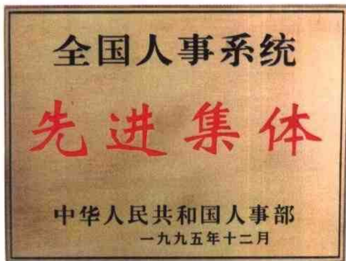
◁1995年12月，柳州市人事局荣获全国人事系统先进集体称号。