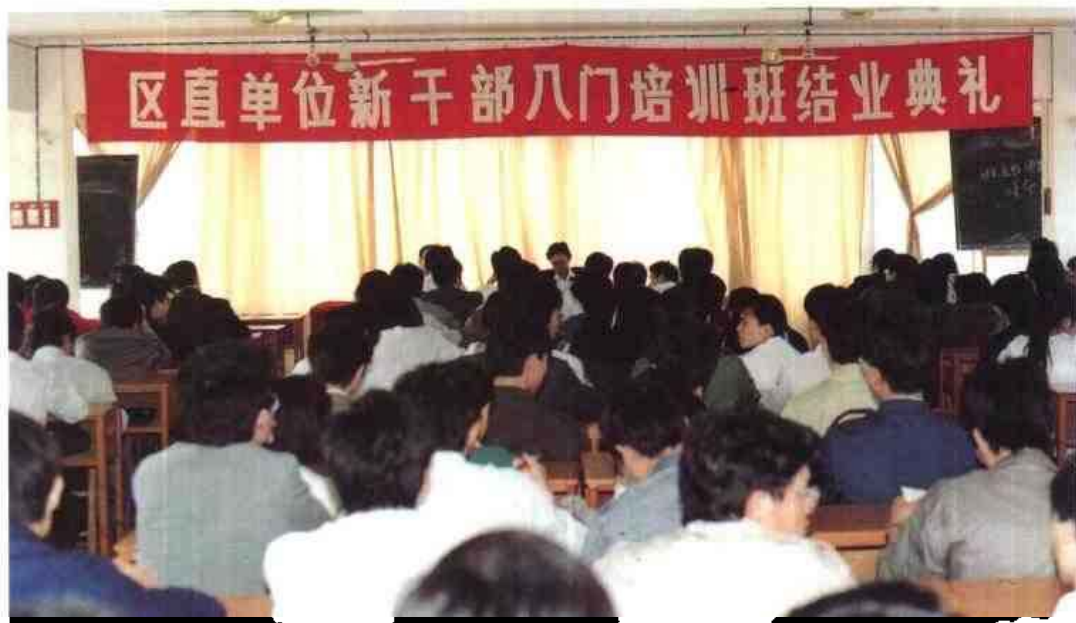
▷ 1991年12月15日，自治区人事厅开办区直单位新干部入门培训班。图为培训班结业典礼会场一角。