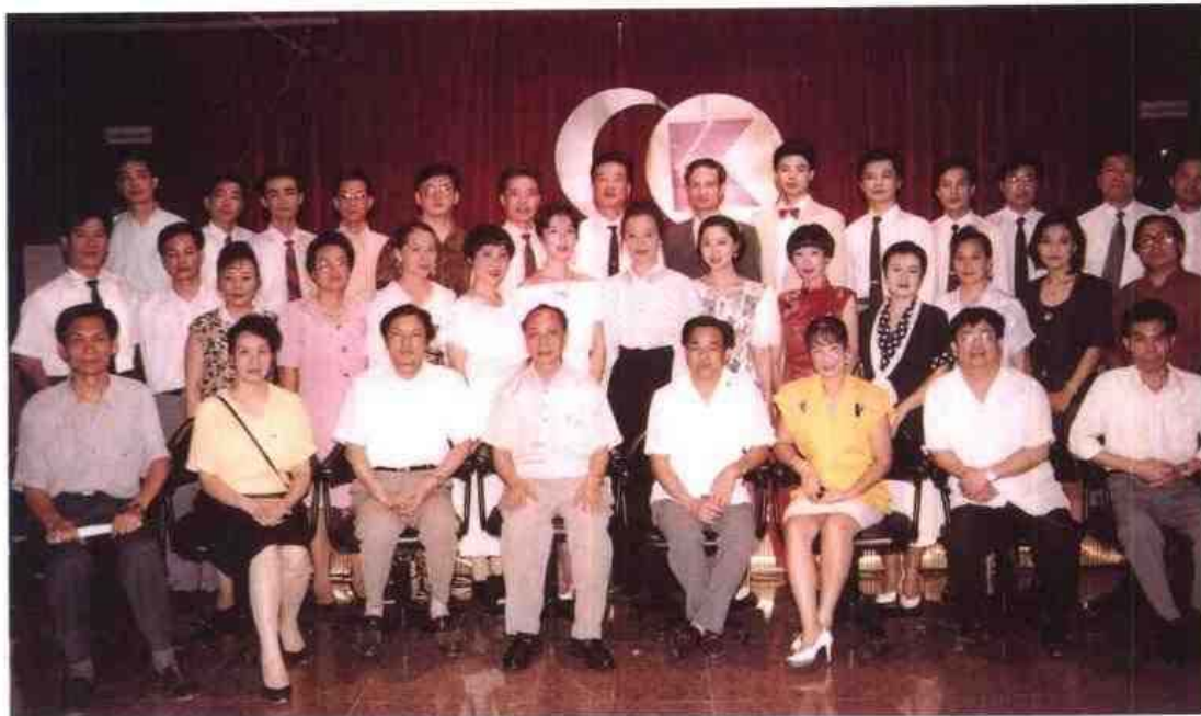
◁ 1994年4月，自治区人事系统首届卡拉OK比赛在南宁举行。图为自治区党委组织部副部长、自治区人事厅党组书记吴汉（前排左四）、自治区人事厅厅长莫军（前排右四）、自治区人事厅副厅长邵博文（后排右二）、农立进（前排左三）与参赛人员留影。