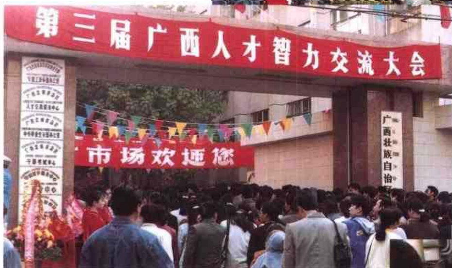
◁1995年12月，第三届广西人才智力交流大会在自治区人事厅大院内举行。图为大会入场情景。