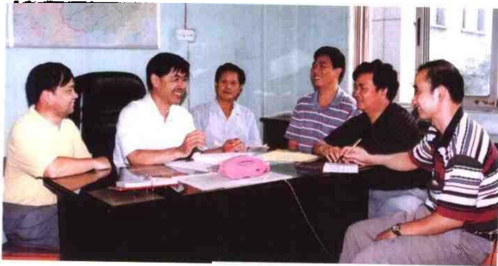
◁1997年7月8日，柳州市人事局领导与中层干部一起研究新时期的人事工作。