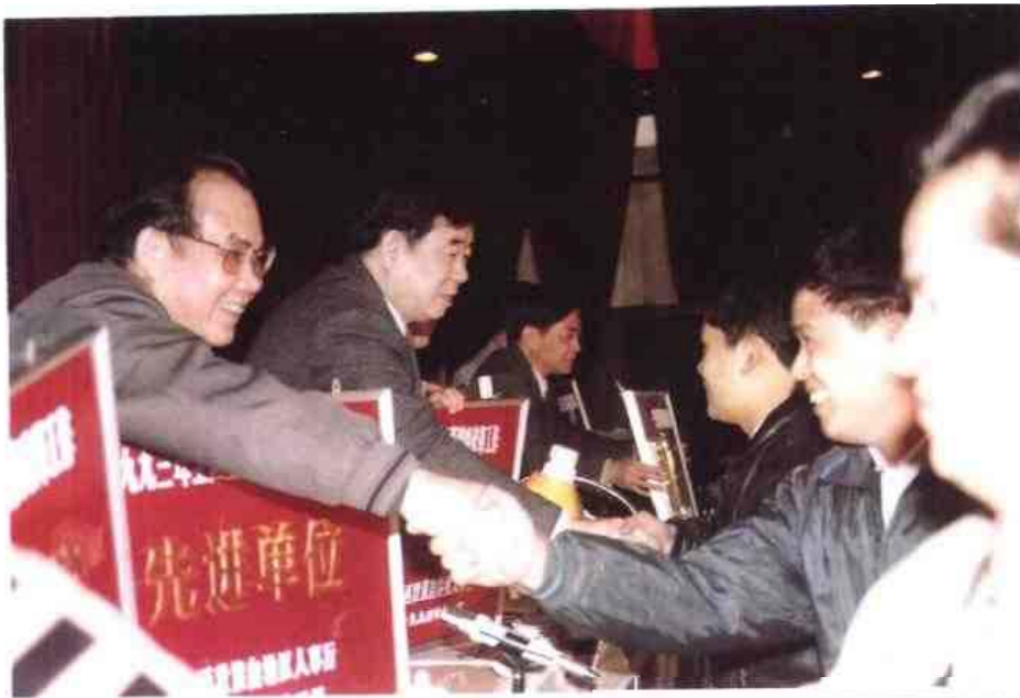
◁ 1990—1994年度全自治区人事系统先进集体、先进个人表彰会于1994年12月在邕举行。图为自治区党委副书记马庆生（左二）等领导为获奖单位和个人颁奖。