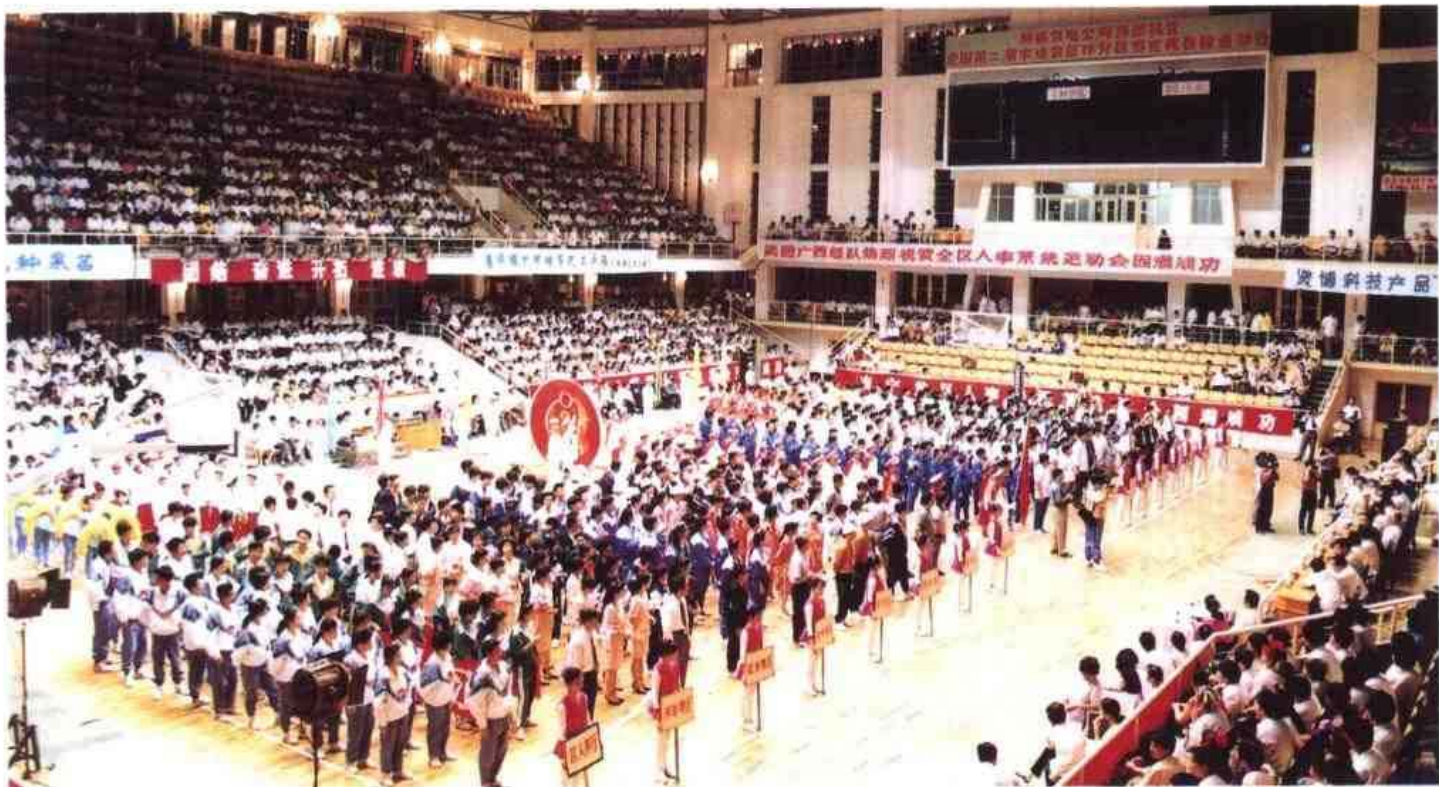
△ 1993年5月，自治区人事系统首届运动会在广西横县举行。图为运动会会场一角。