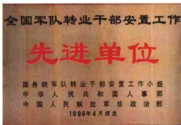
▷1996年4月，柳州市第二次荣获全国军队转业干部安置工作先进单位称号。