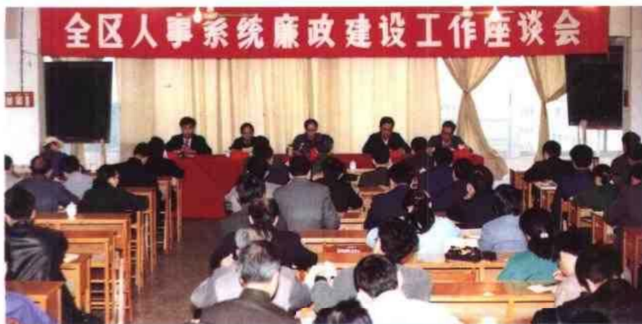
◁1990年12月19日，自治区人事厅召开全自治区人事系统廉政建设工作座谈会。图为座谈会会场一角。