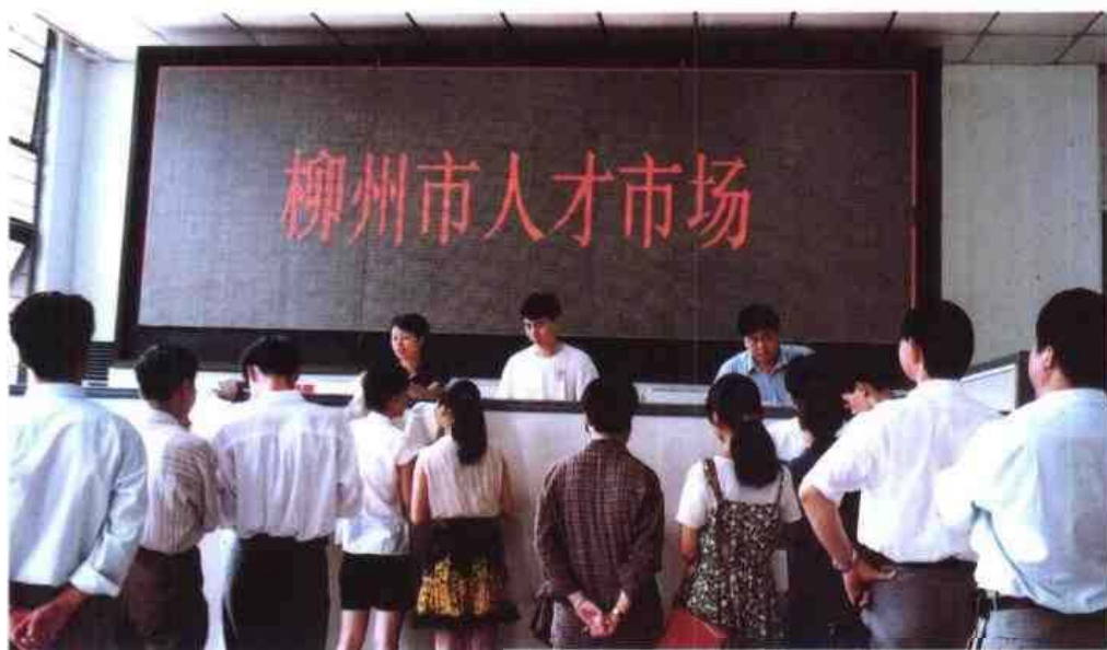
◁从1997年3月开始，柳州市人才市场就利用电子大屏幕发布人才信息广告。