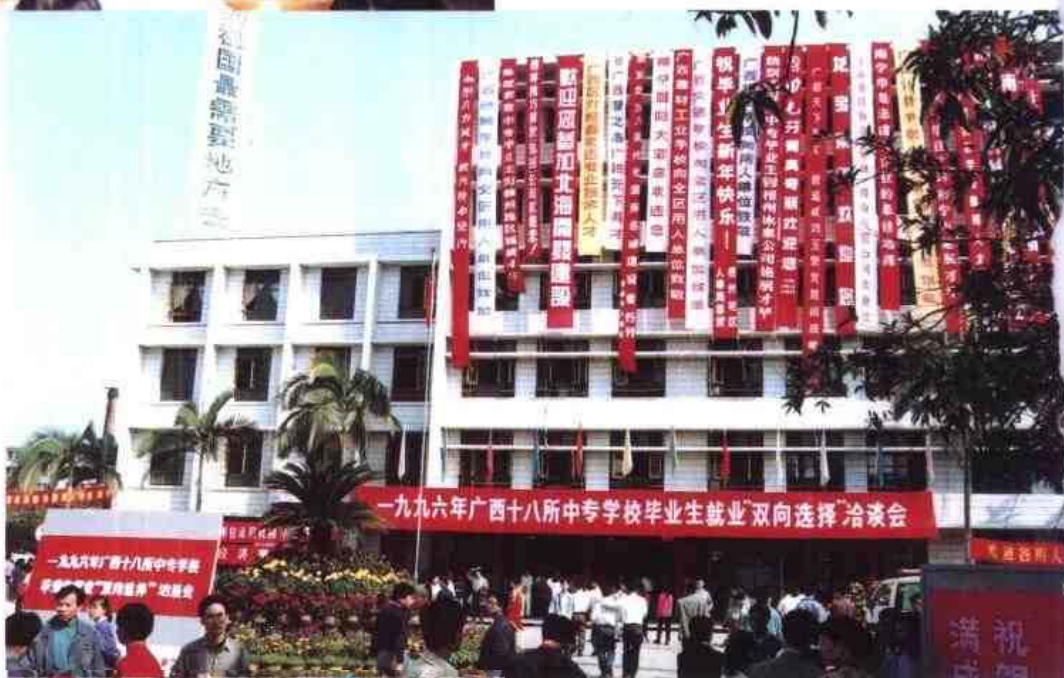
▷1996年广西18所中专学校毕业生就业“双向选择”洽谈会在南宁召开。图为大会会场一角。