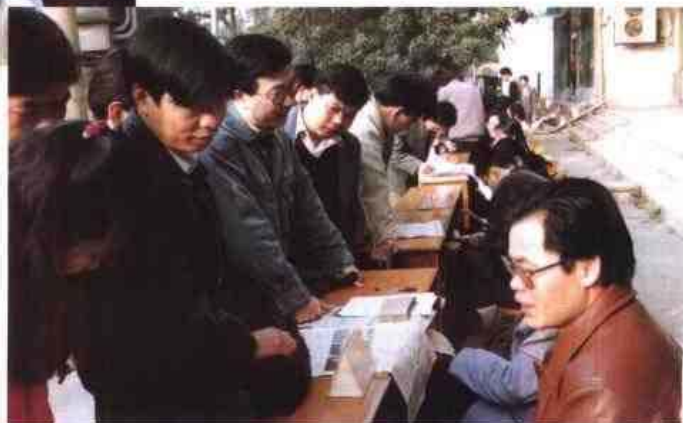
▷1996年元月，自治区直属机关10个厅局首次面向社会公开招考国家公务员。图为报名的场面。