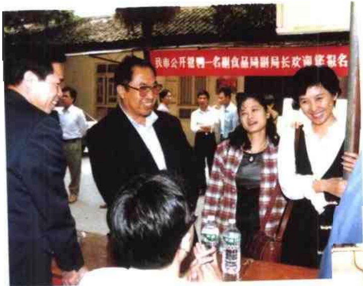
◁1996年3月，南宁市首次向社会公开招聘副处级领导干部。图为中共南宁市委副书记徐文彦（左二）到报名现场指导工作。