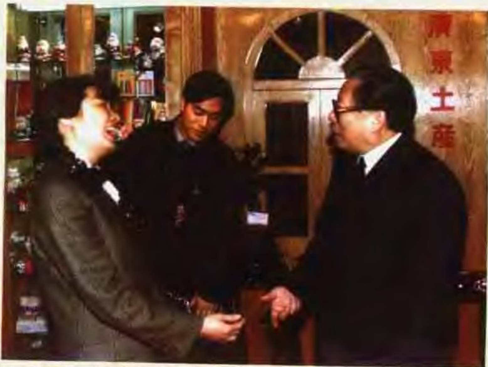
1991年12月，在北京举办的全国外贸出口商品生产基地成果展览会上，中共中央总书记国家主席江泽民来到广东省土产进出口（集团）公司的展台上参观，并与工作人员亲切交谈。