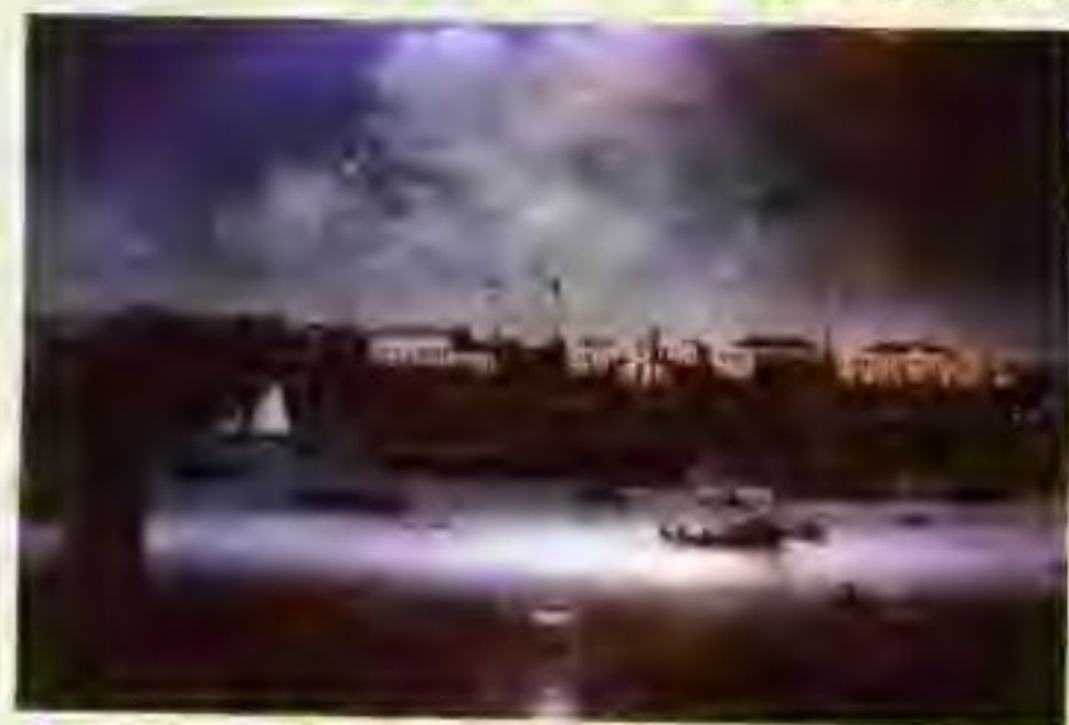
▲ 图为鸦片战争前的广州港。

● 广东产品的出口市场，分布在180个国家和地区。 ● 在广东投资的国家或地区，共70个。 ● 广东在海外设立的企业800多家，分布在60多个国家和地区。