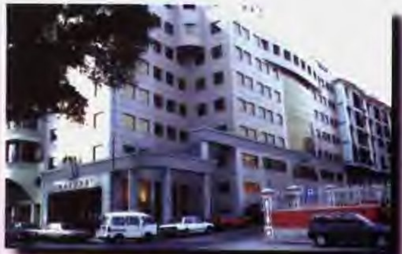
南粤集团大厦 Nam Yue (Group) Building

Nam Yue (Group) Co., Ltd. is a representative economic organization of Guangdong Provincial Government in Macau, as well as the sole agent in the Territory for all the import and export corporations and other economic enterprises Guangdong. The business scope of the Group Company, initiated with the import and export trade, covers trading, manufacture, finance, transportation, tourism, hotels, project contracts, real estate, insurance, labour service export and property management as a whole, which guarantees the diversified, associated and transnational business activities, so the the Group Company takes pride in its large scale and comprehensive economic strength.