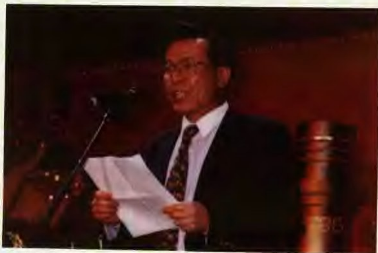
1996年1月5日，广东省副省长卢瑞华在香港会议展览中心庆祝粤海企业(集团)有限公司成立十五周年晚会上发表讲话。