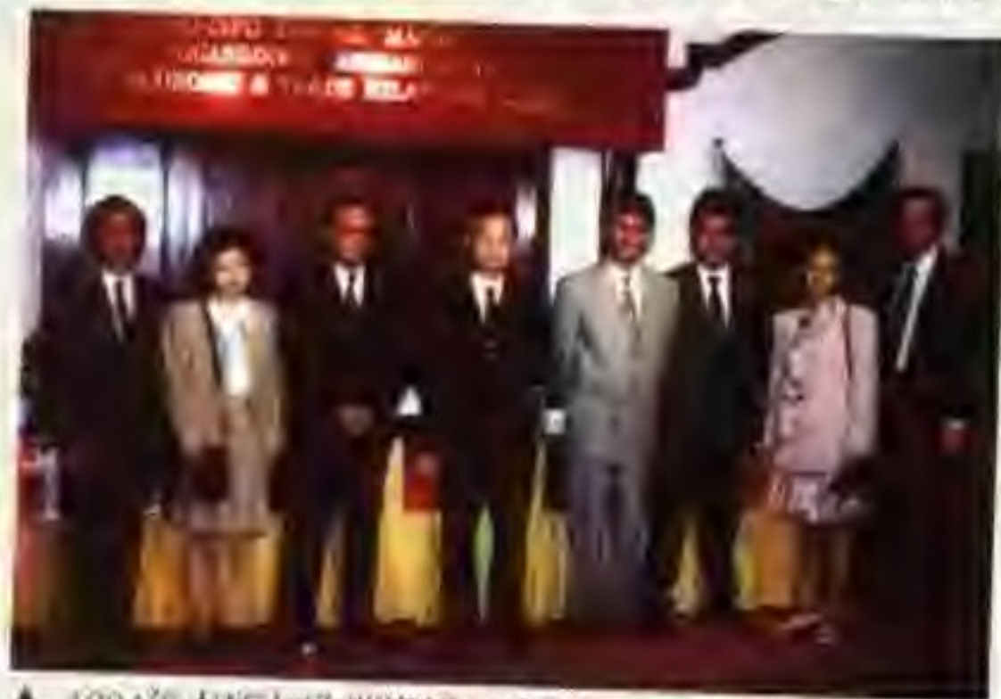
▲ 1994年本所与欧洲资讯（澳门）中心签署合作协议。

该所拥有多年从事对外经济贸易业的、经验丰富的研究员及经济师，聘请了一批资深专家学者为高级咨询员，并建立了信息员网络，形成了高效率的研究、咨询与信息一体化的工作系统。