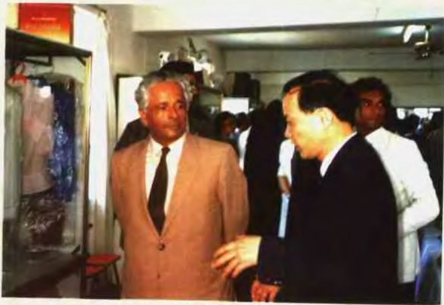
1989年2月21日毛里求斯总理贾格纳特在广东省外经贸委徐德志同志陪同下，参观在该国举办的广东省出口商品展销会。