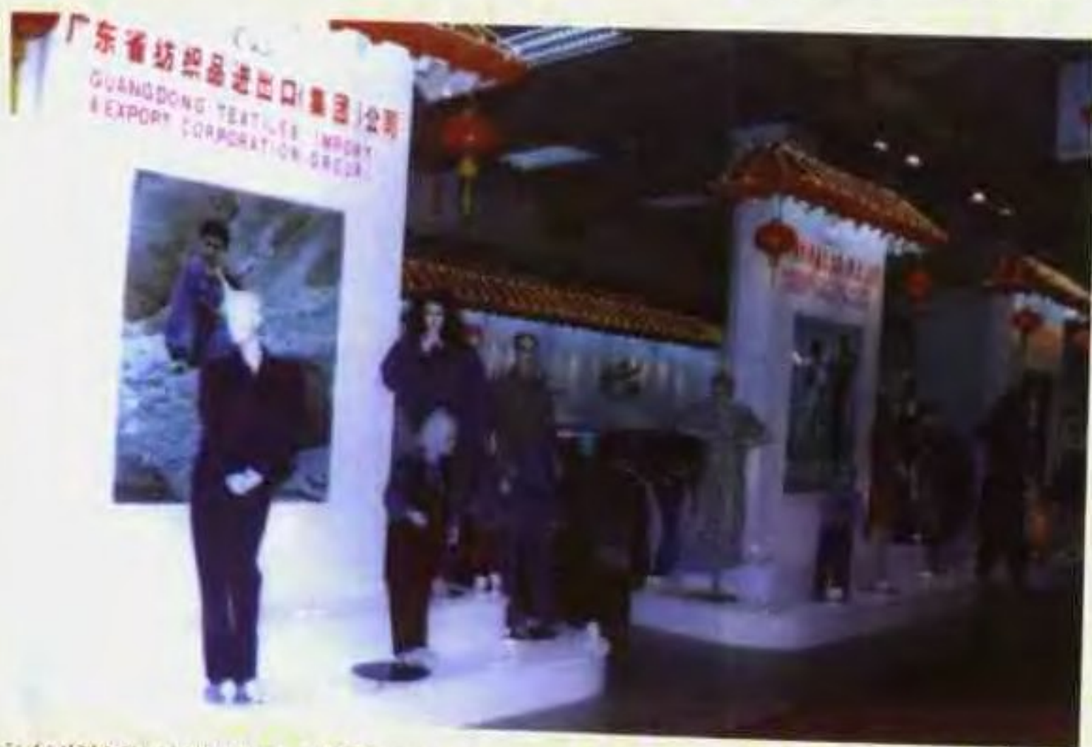
广东省纺织品进出口(集团)公司1996年春季中国出口商品交易会的展厅。