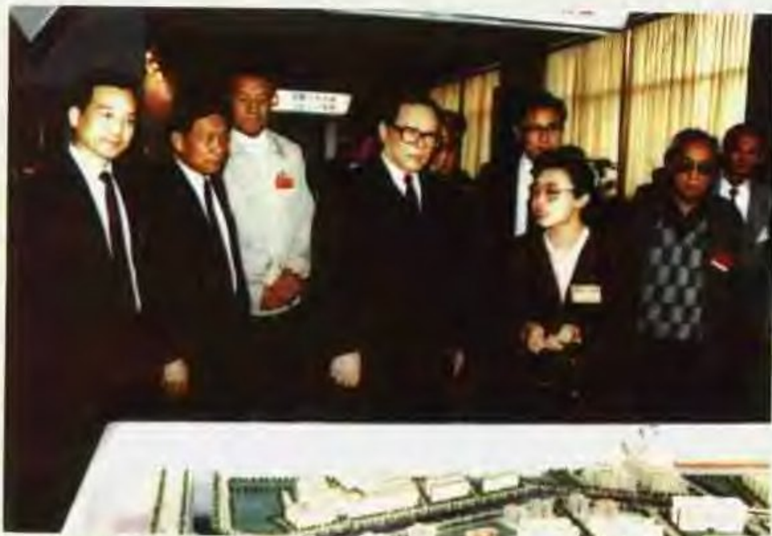
1991年12月17日，江泽民总书记参观汕头经济特区成立十周年成就展览。