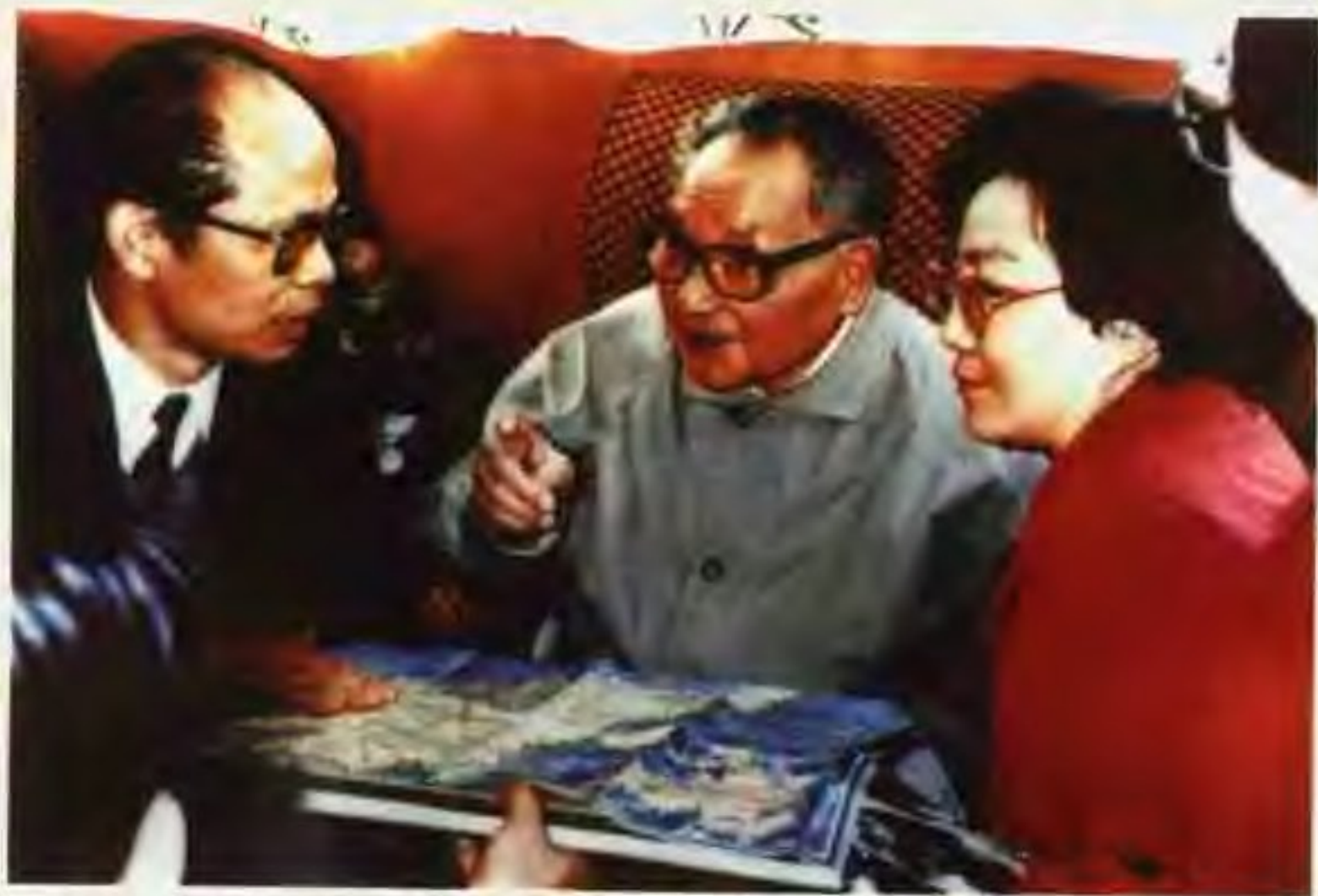
1992年1月23日，邓小平同志视察广东时与中共广东省委书记谢非同志交谈。