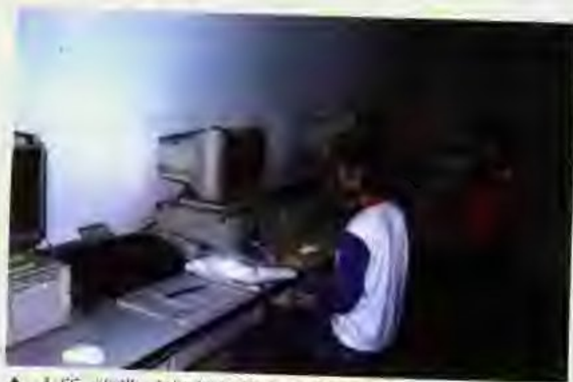
▲ 本所《国际市场每日传真EIF》制作室。