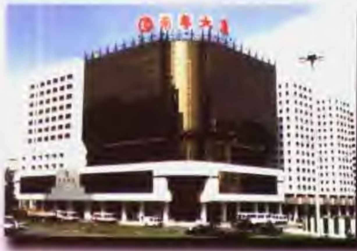
南粤大厦 Nam Yue Building