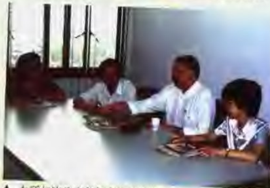
▲ 本所与波兰商务领事洽谈合作项目。