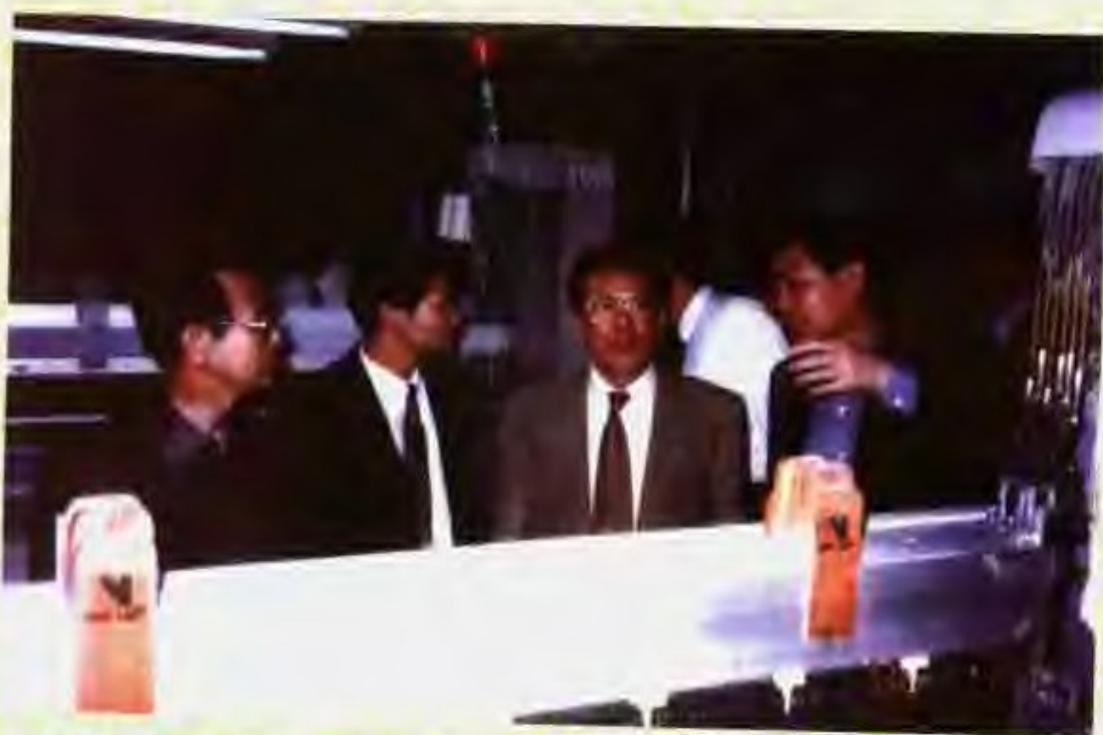
1996年4月17日，广东省省长卢瑞华到韶关视察了解国有企业在改革中如何重建机制，实现两个根本性转变。(图为卢瑞华省长到韶关第一棉纺织厂视察)。