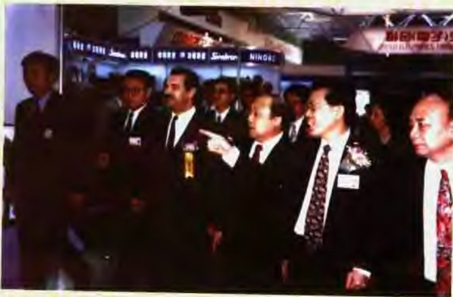
1996年4月15日，广东省省长卢瑞华(右二)视察第七十九届中国出口商品交易会展览馆。