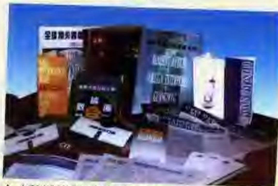
▲ 本所出版的部分信息系列产品。