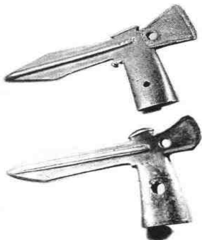
铜戈（公元前 5 世纪至 1 世纪）

在这些姑师人的墓中，不仅用马和驼殉葬，还用人来殉葬。在一座最大的墓葬中出现两具人的骨架，据推测可能是负责养马的奴隶，表明墓主人的身份十分显赫。即使在一般姑师人的墓葬中，也放进一个羊头、驴头或马头，还有的墓中放着一只羊腿或羊排骨，并置放一把小刀，或把小刀直接插在羊腿上。充分显示了姑师人以畜牧业为主和喜爱肉食的习俗，体现出那种游牧民族的草原文化特色。