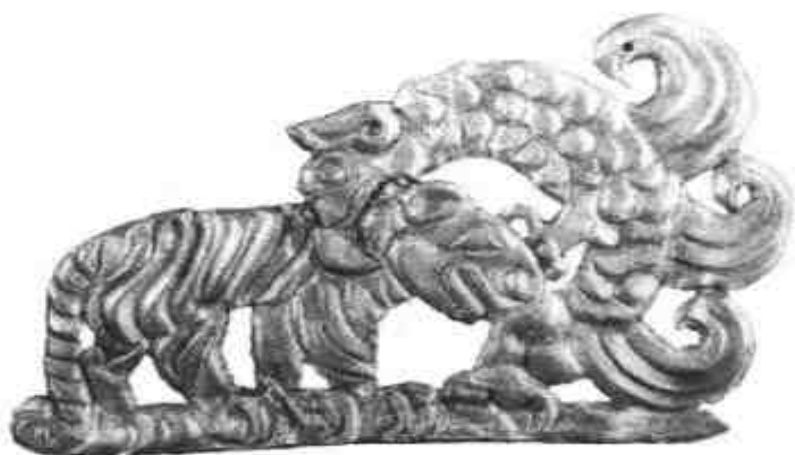
怪兽啄虎纹金牌饰

她腰带上的金牌就有 8 块，每块金牌都足重 20 克。圆形金牌刻着老虎的形象，虎头微昂，前腿举至颌下，后腿高翘，躯体半卷曲作攻击状，