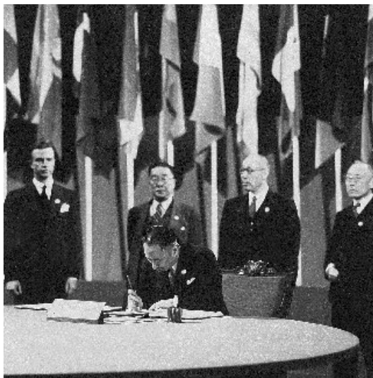
1945年6月，董必武（右二）作为中共代表参加《联合国宪章》签字仪式

临危受命，董必武主持华北财经办事处工作。1947年4月，中共中央决定在华北解放区成立华北财经办事处，职责是统一华北各解放区的财经政策。董必武被任命为办事处主任。在接到任务后，董必武立刻携同家人从晋西北出发，经过