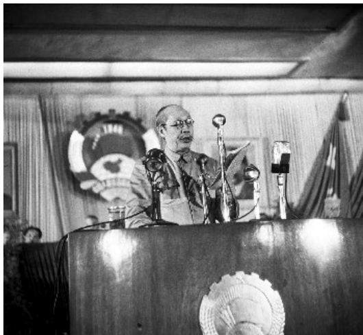
1949年9月21~30日，中国人民政治协商会议第一届全体会议在北京召开。筹备会第四小组组长董必武作《关于草拟中华人民共和国中央人民政府组织法的经过及其基本内容的报告》

中共中央交给华北人民政府的任务是：把华北解放区建设好，使之成为巩固的根据地，从人力物力上支援全国解放战争；摸索、积累政权建