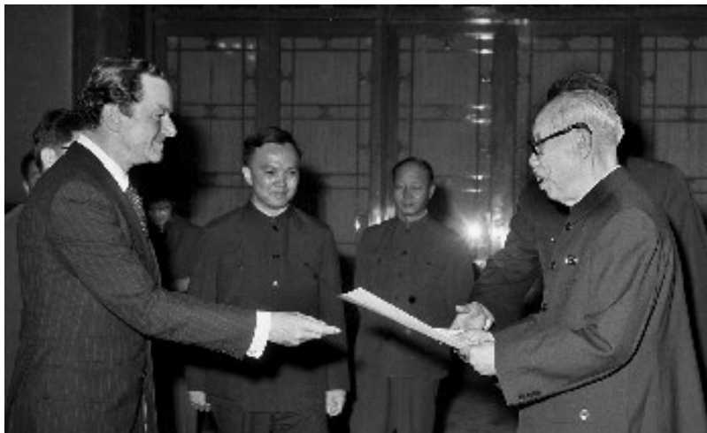
1973年4月19日，联邦德国首任驻中华人民共和国特命全权大使罗尔夫·保尔斯向中华人民共和国董必武代主席递交国书

中央人民政府成立之后，1949年10月25日，周恩来总理向中央人民政府主席毛泽东呈送请示报告，请主席批准并命令华北人民政府结束工作。27日，毛泽东批准了这一报告。28日，董必武以华北人民政府主席名义，向五省、二市及直属单位转发了中央命令，并通知华北人民政府11月1日停止办公。这样，交接工作迅速而有序地完成，保证了中央人民政府各部门组织机构的建立和顺利办公。